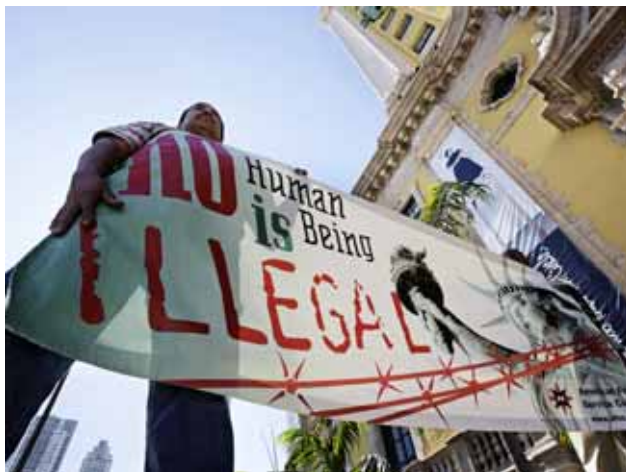
Als EUA, hi ha onze milions de persones indocumentades