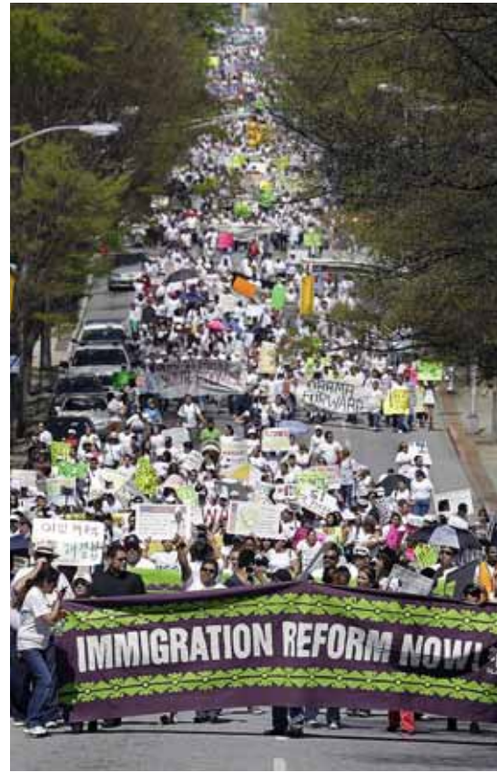
Desenes de milers de persones van sortir al carrer per exigir una reforma migratòria integral i per la fi de les deportacions el 10 d'abril. A la fotografia, la manifestació d'Atlanta