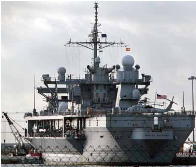
El vaixell de guerra nord-americà 'Mount Whitney', provinent de l'Iraq, va estar atracat al port de Tarragona l'octubre de 2010