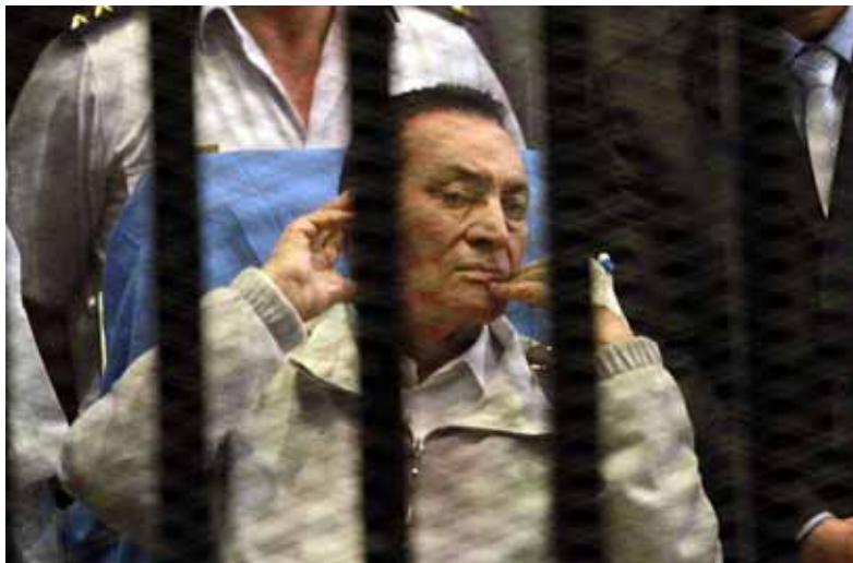
Hosni Mubarak davant el tribunal de l'Acadèmia de Policia el 15 d'abril d'enguany

Quan, el novembre passat, el president Mursi va destituir l'antic fiscal general, Abdel Maguid Mahmoud, i el va rellevar per Tallat Abd Allah, els Germans Musulmans van argumentar que ho feien per assegurar el restabliment de la justícia i