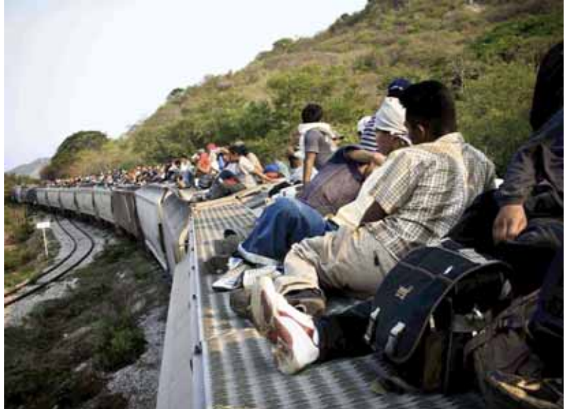
Els centenars de migrants que creuen Mèxic de sud a nord damunt el tren conegut com 'La bestia' sovint són objecte de robatoris i extorsions per part de les màfies