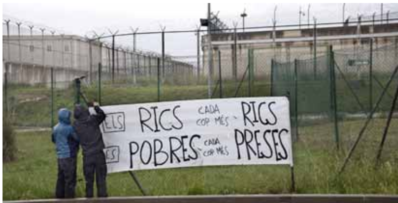
Marxa contra les presons a Quatre Camins el 28 d'abril / MARIA ZENDRE

abans de sortir de Quatre Camins, ho després d'haver controlat el motí. Els presos afectats parlen de pallisses brutals i de “l'obligatorietat de passar per un llarg pasadís format per carcellers a banda i banda que repartien cops de porra brutals i puntades de peu de manera indiscriminada”. El procés d'acusació contra els presos amotinats es va dur a terme l'any 2008. Disset presos van anar a judici i el veredict va dictaminar condemnes contra set d'ells per un delict d'homicidi en grau de temptativa, set van ser declarats culpables per delictes de lesions i tres van quedar absolts. Alguns d'aquests presos van veure incrementada la seva pena fins a dinou anys de presó, fet que convertia la seva condemna en una cadena perpètua encoberta de fins a 30 anys acumulatius de presó. ◀