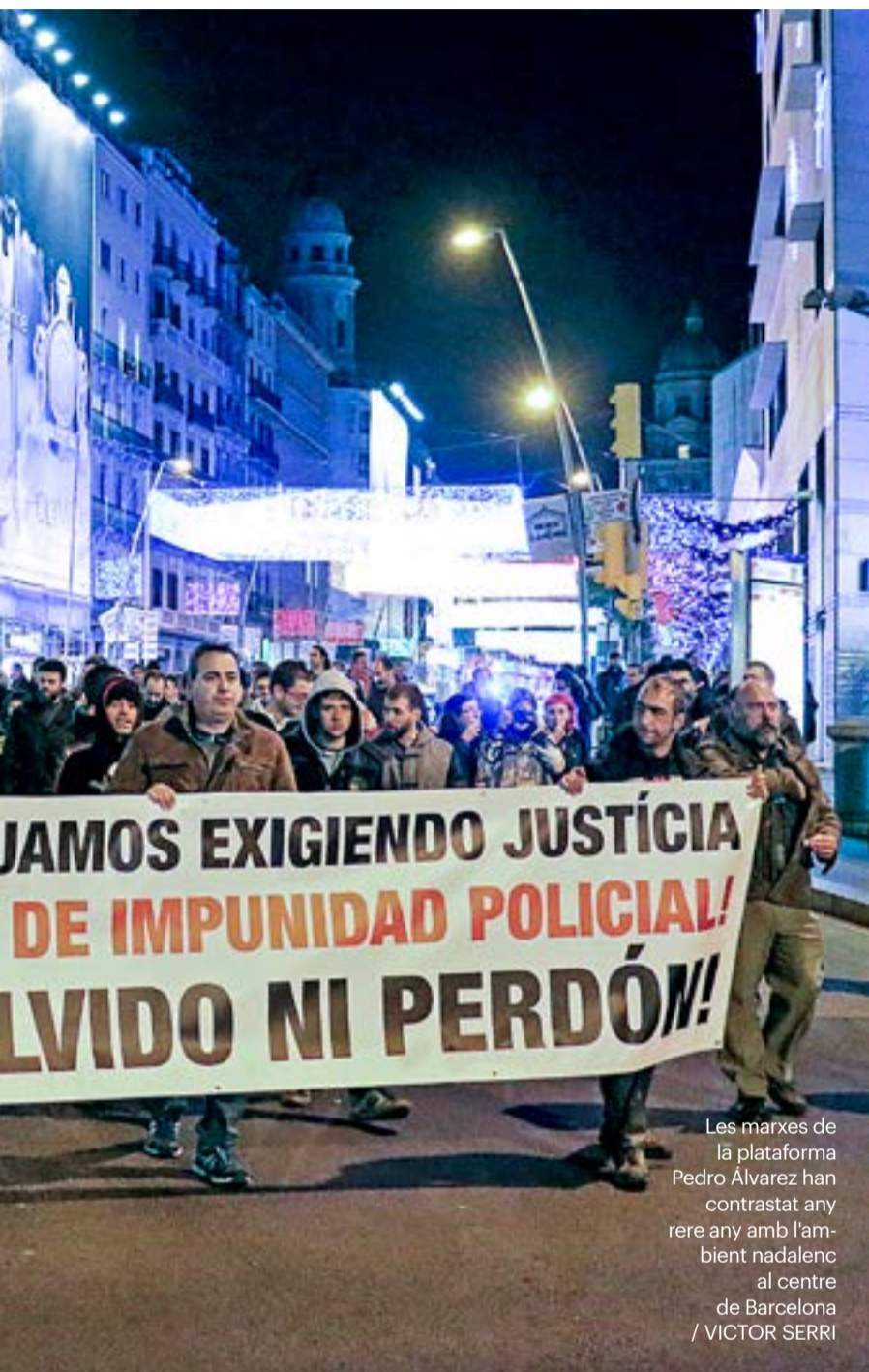
Les marxes de la plataforma Pedro Álvarez han contrastat any rere any amb l'ambient nadalenc al centre de Barcelona