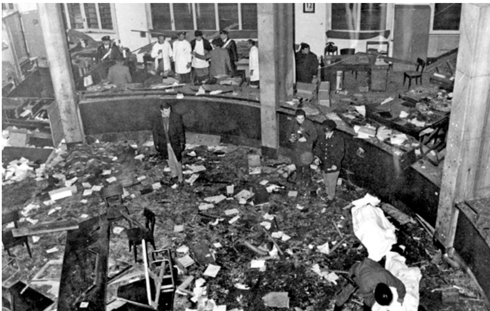
El 12 de desembre de 1969 va esclatar una bomba al banc de l'Agricultura de Piazza Fontana de Milà (Itàlia), que va matar 17 persones i en va ferir 88. El primer acusat va ser Giuseppe Pinelli, anarquista i treballador del ferrocarril. Dos dies després de l'atemptat, va "caure" des de la comissaria mentre l'estaven interrogant. L'any 2001 el Tribunal Suprem va concloure que l'atemptat va ser executat per l'organització d'extrema dreta Ordine Nuovo.