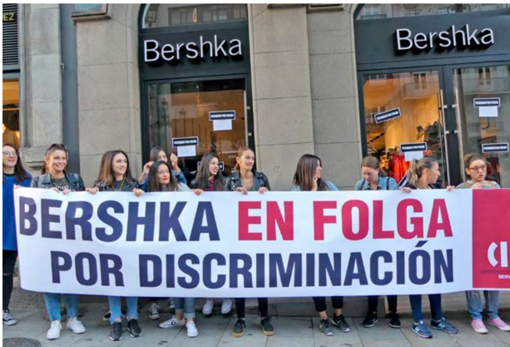
Protesta davant d'una seu de Bershka a Vigo / CIG

treballadores, les assessores sindicals i les negociadores de l'empresa, i això es va notar tant en les formes de la negociació com en la seva agilitat”.