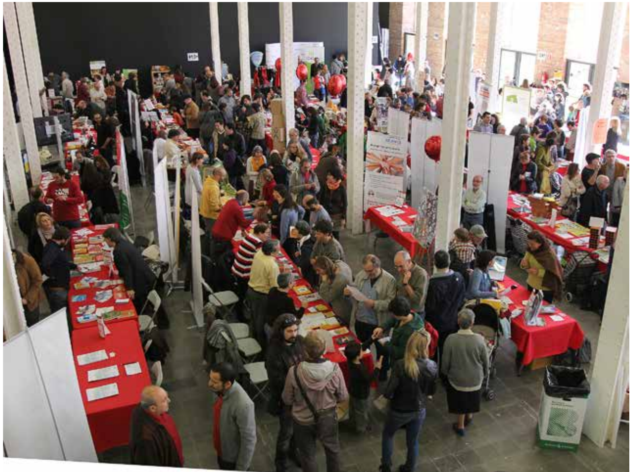
Imatge de la I Fira d'Economia Solidària de Catalunya

Per segon any consecutiu, la Xarxa d'Economia Solidària (XES) organitza la Fira d'Economia Solidària, que tindrà lloc a Barcelona, a la Fabra i Coats de Sant Andreu, el 26 i 27 d'octubre . Aquestes vuit pàgines que tens a les mans pretenen ser una eina amb informació pràctica sobre el funcionament de la trobada, les activitats que s'hi duran a terme i les entitats que hi participaran.