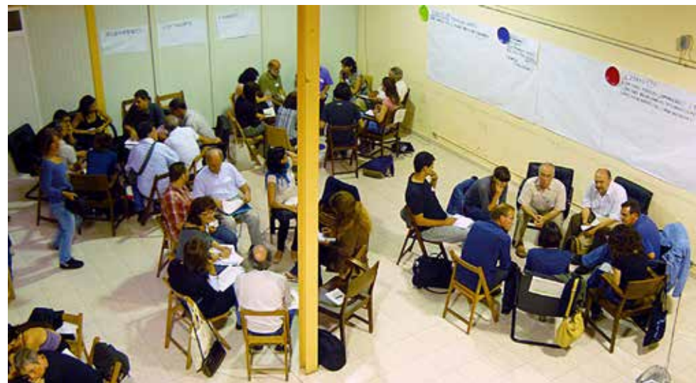
Taller de la XES a la Casa de la Solidaritat de Barcelona el juny de 2010

La crisi sistèmica que vivim, que també és social i nacional, ens empeny a continuar experimentant noves formes d'organitzar la societat i l'economia. L'economia social i solidària és una realitat i, al mateix temps, pot ser una valuosa font d'inspiració.