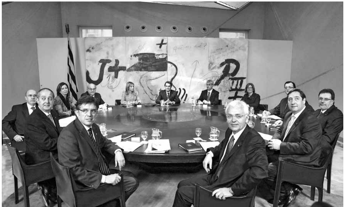
Fotografia del consell executiu dissenyat pel polític convergent Artur Mas