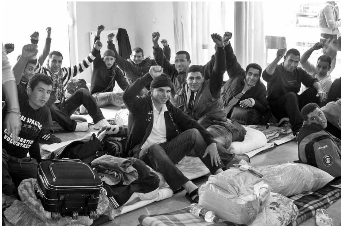
Algunes de les 200 persones immigrades que el 25 de gener van començar una vaga de fam a Atenes

Amb el suport d'organitzacions de l'esquerra extraparlamentària, les persones immigrants -la majoria provinents de països del Magreb i del nord d'Àfrica- protesten i esperen aconseguir permisos de treball per tota la gent immigrada del país, independentment del seu estat legal. Aproximadament unes altres 50 persones migrades s'han sumat a la protesta a la ciutat del nord del país, Tessalònica.