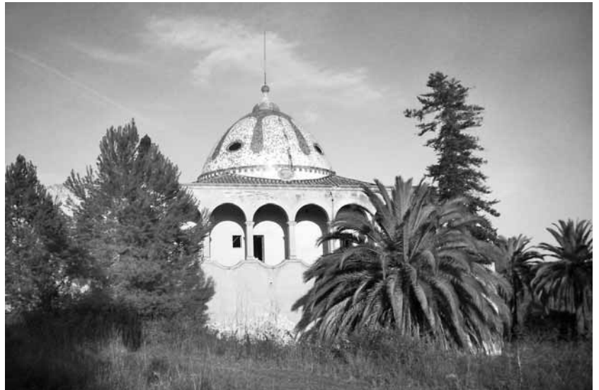
El mas d'en Sorder és una estructura històrica en perill, com l'anella verda

gista i, llavors, també socialista -encara a l'oposició- va fer retirar aquest pla i, un cop al govern, va tornar-lo a redactar. La crisi econòmica va propiciar i afavorir l'aturada d'alguns plans parcials, però el 31 de gener d'enguany es va evidenciar la manca de compromís polític. Sacrificant la Budaia i l'Horta Gran, Tarragona ha pogut evitar el passeig de la Mora i la Mora 2 i ha pogut salvar