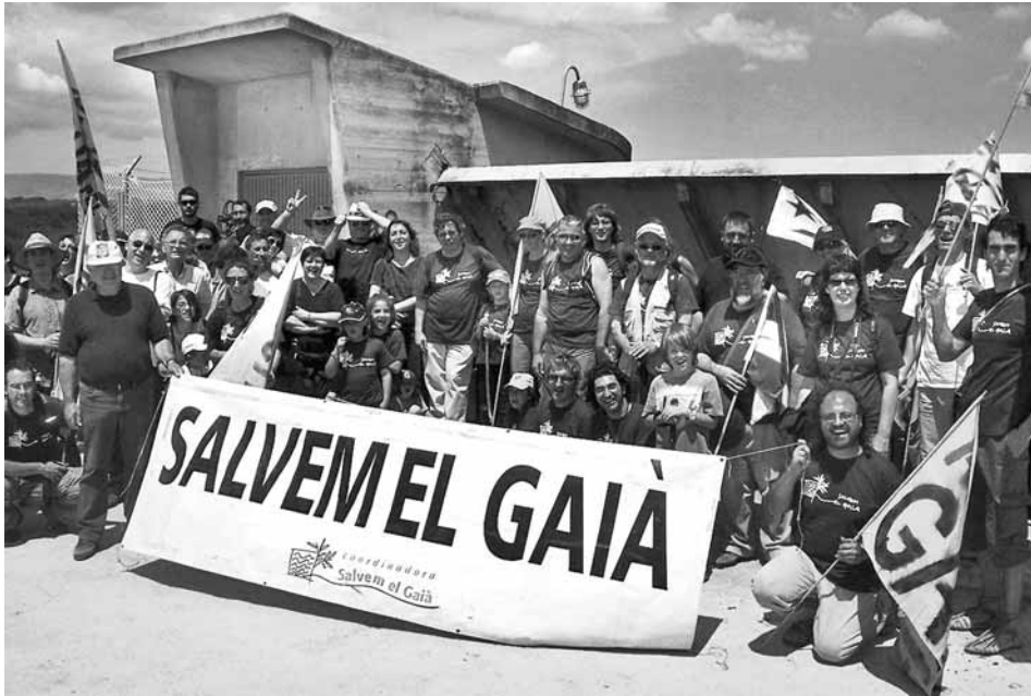
La mobilització ciutadana permet explorar un futur sostenible pel Gaià