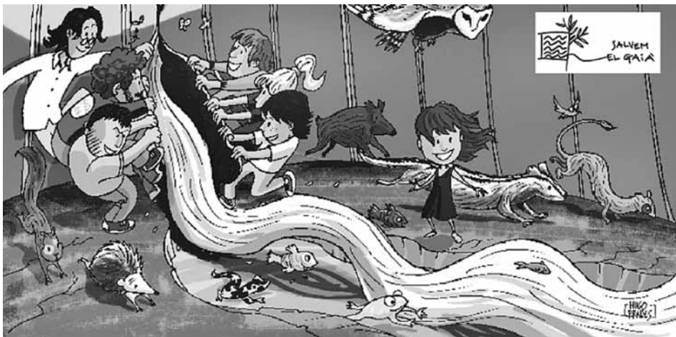
Còmic reivindicatiu de la plataforma

La plataforma d'entitats constituïda al Tarragonès arriba al seu desè aniversari amb el repte de recuperar el cabal del riu i que les terres dels seus voltants passin a formar part de la xarxa de parc naturals.