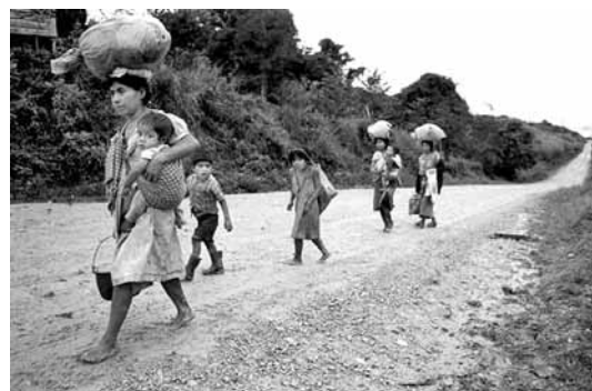
Aquesta foto del llibre recull la imatge d'un grup de persones que han de fugir

'Migraciones ambientales' parla de les causes que hi ha darrere les migracions i la insostenibilitat del sistema