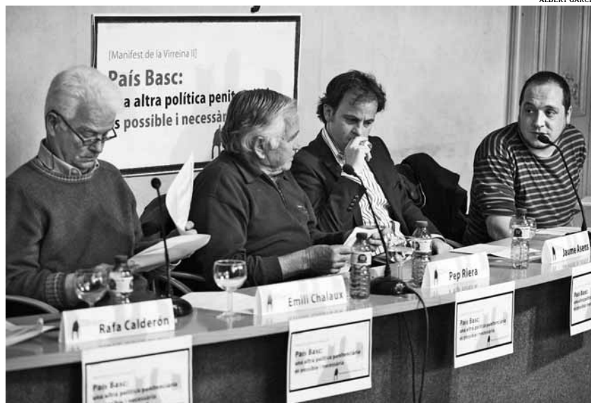
Roda de premsa per presentar el manifest Virreina II