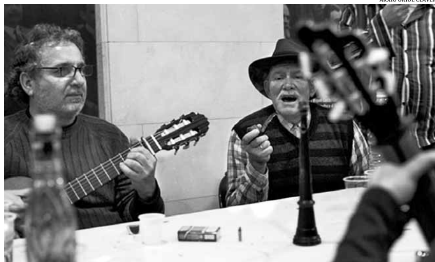
ARXIU ORIOL CLAVERA