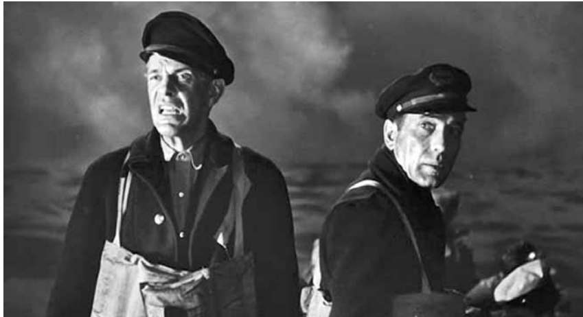
Fotograma de 'Acción en el Atlántico Norte', un film protagonitzat per Humphrey Bogart

S'editen en DVD tres films de quan els EUA estaven a la Segona Guerra Mundial