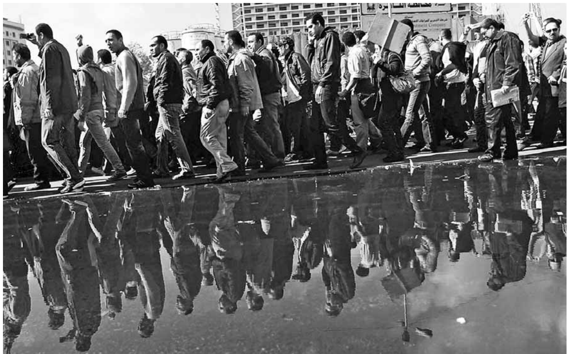
Les protestes van continuar durant el setè dia, quan milers de persones van sortir al carrer per exigir la renúncia del president del país

En el segon cas, Tunísia, es van anar concedint engrunes poc a poc per veure si les persones revoltades ho deixaven estar: primer, el president Ben Ali va anunciar que no es presentaria a les eleccions del 2014;