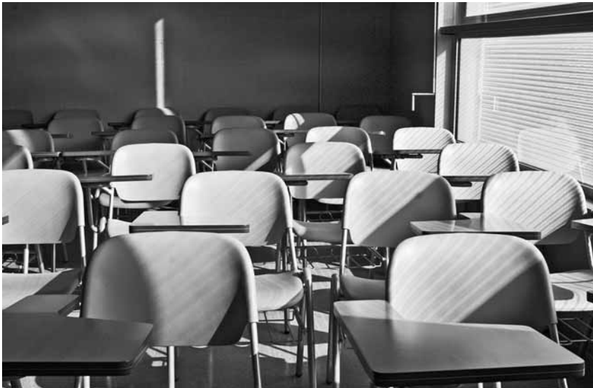
Aula buida del campus de la Universitat de Barcelona, al Raval