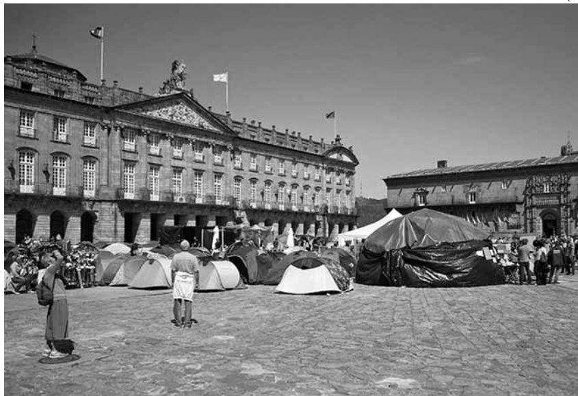
La plaça compostel·lana de l'Obradoiro presenta més d'un centenar de tendes

de Arousa. Durant la trobada es va veure necessària l'extensió de les acampades i del moviment als barris, instituts i nous pobles per muntar noves assemblees i l'inici