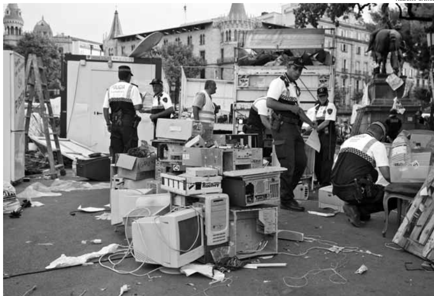
Agents de la Guàrdia Urbana etiqueten els objectes que consideren importants