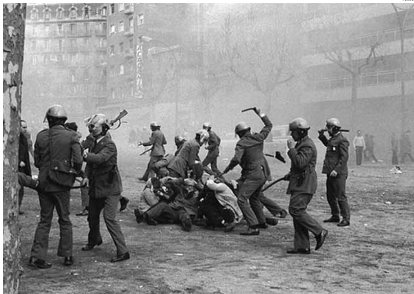
Càrregues policials registrades al passeig de Gràcia de Barcelona l'any 1976

Quan el clam de milers de persones demana "democràcia real ja" i les crítiques al capitalisme han passat els petits cercles de l'activisme social més compromès, és útil fer memòria per