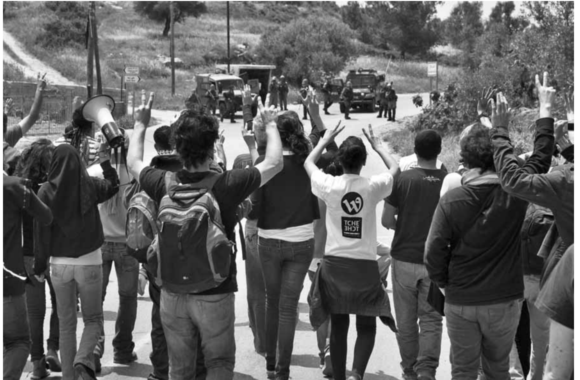
La marxa de Bil'in se celebra cada divendres per denunciar la construcció del mur i la confiscació de terres

El gran canvi des d'aleshores, però, és que han desaparegut els grups massius que apostaven per la pau dins l'Estat hebreu. Organit-