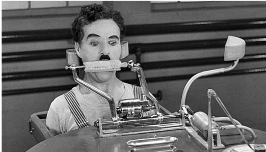
Fotograma de la pel·lícula 'Tiempos modernos'

S'editen tres pel·lícules reivindicatives i socials del còmic anglès en format Blu-ray