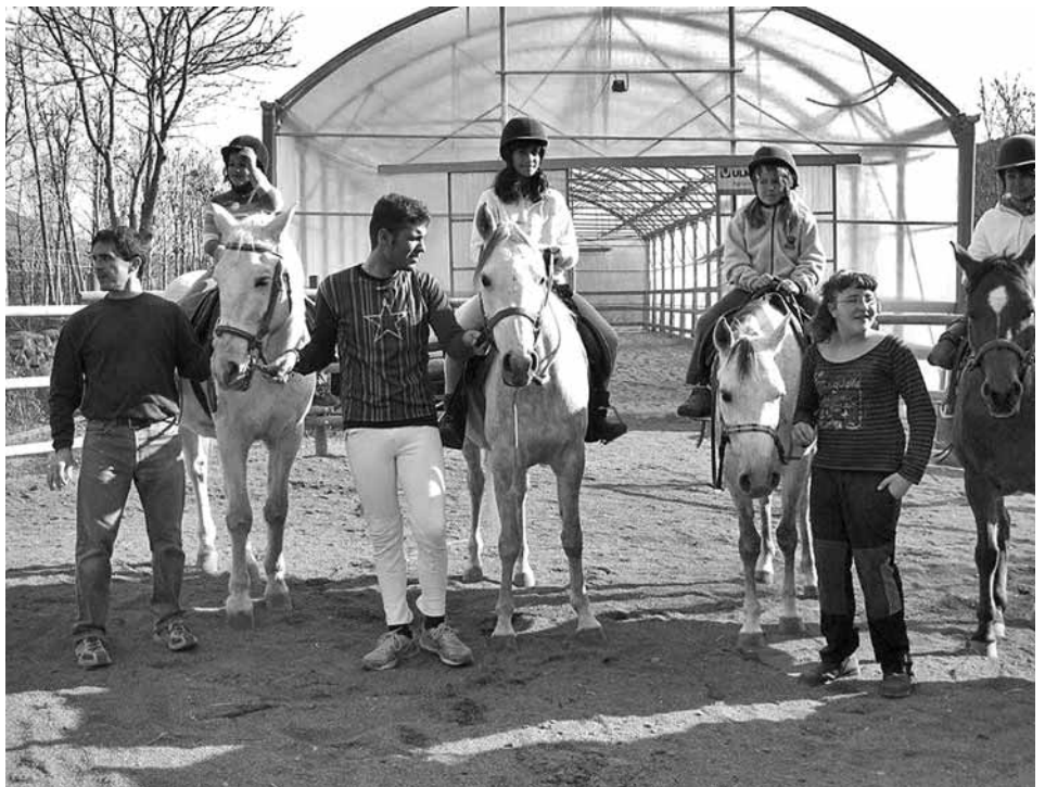
El monitors acompanyen les nenes durant les sessions

L'equinoteràpia és una tècnica terapèutica que utilitza el cavall per millorar el desenvolupament psicomotriu i sensorial de les persones. No té res a veure amb l'aprenentatge de l'equitació. Està adreçada a persones amb discapacitats físiques, psíquiques i sensorials i també a col·lectius amb riscos d'exclusió social. És una tècnica terapèutica poc desenvolupada a casa nostra, però en països europeus com Itàlia, l'Estat francès o Alemanya és un mètode de gran tradició i fins i tot està subvencionat pel govern.