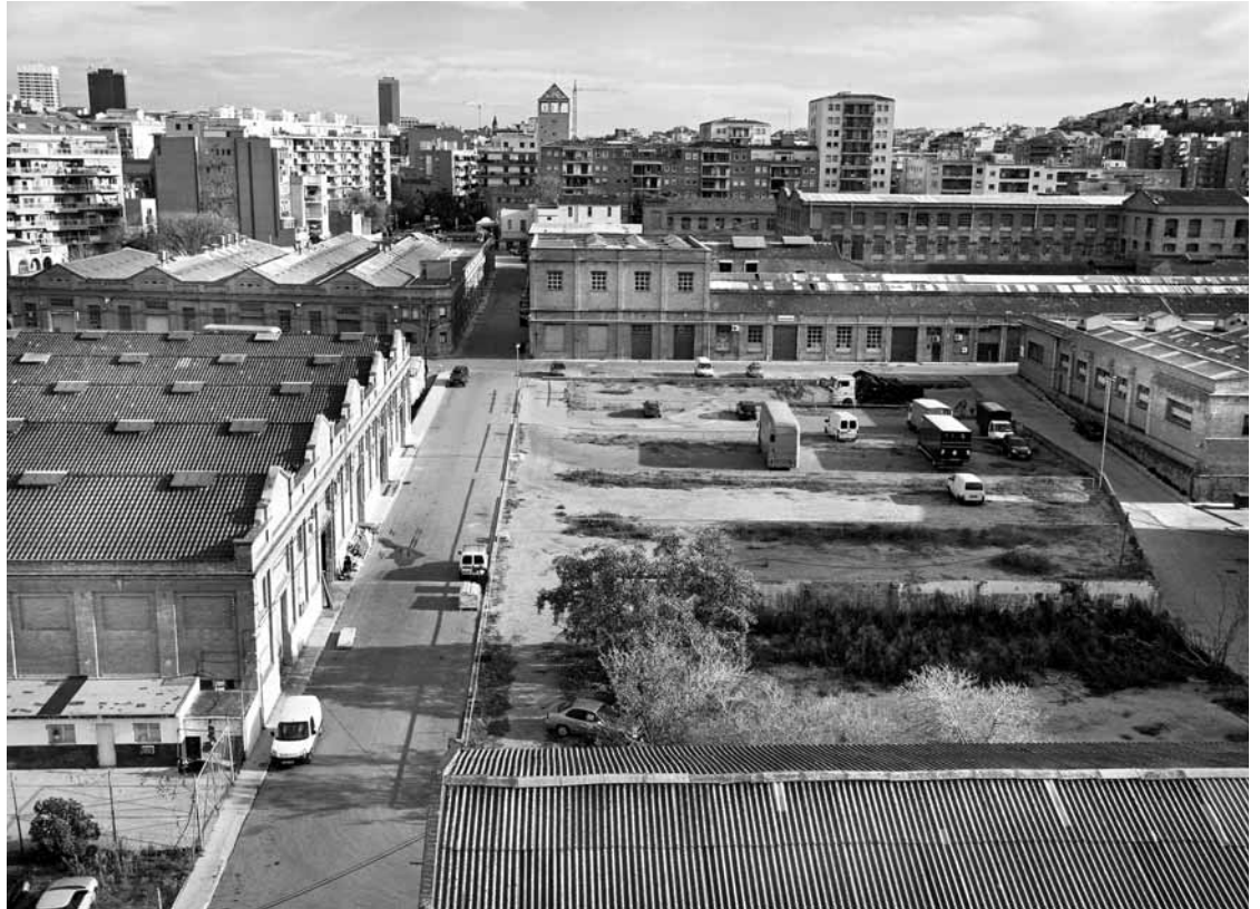
Vista aèria de l'antic recinte fabril de Can Batlló, situat al barri de La Bordeta

Nora Miralles redaccio@setmanaridirecta.info