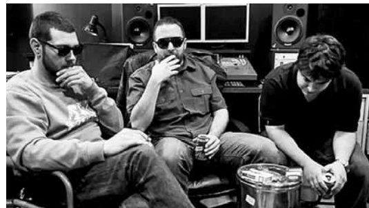
El grup valencià Los Chikos del Maíz encapçala el concert de l'11 de juny

El tercer Festival de Hip-Hop de Manresa se celebrarà entre l'11 i el 18 de juny