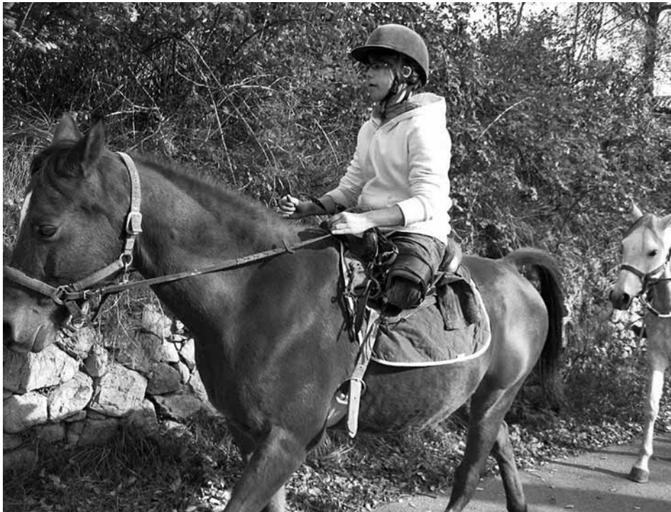
Damunt dels cavalls el pacient se sent allunyat de les seves pors

Socials. Permet desenvolupar el respecte, la responsabilitat, la constància i l'amor cap als animals. Aquestes actituds positives faciliten la integració social.