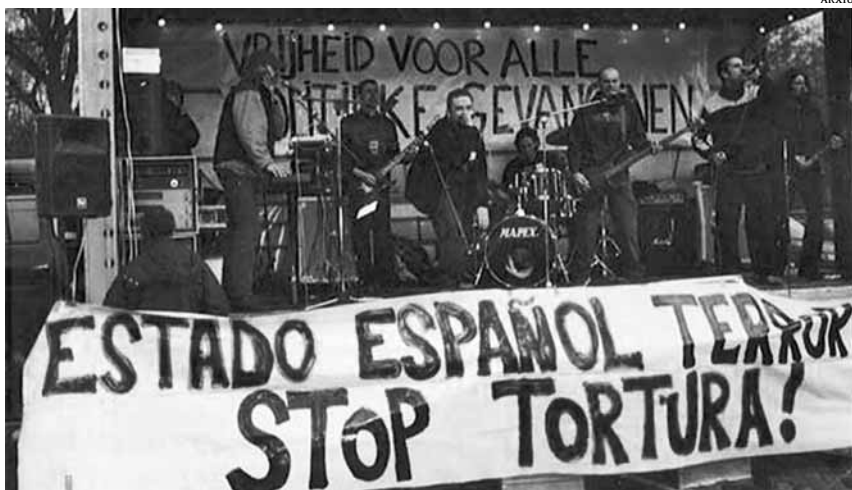
Un moment d'un concert de Tipu Així, la banda original

Es recuperen els seus temes més populars i tornen a sonar les lletres satíriques i iròniques del grup de rock alternatiu Tipu Així