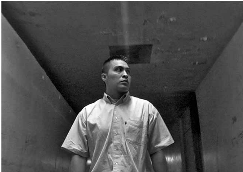
'Presunto culpable', de Roberto Hernández i Geoffrey Smith, és un dels documentals que es presenten al festival

Es podrà veure en el marc del primer Festival de cinema i drets humans de Barcelona, on es projectaran més de 50 cintes