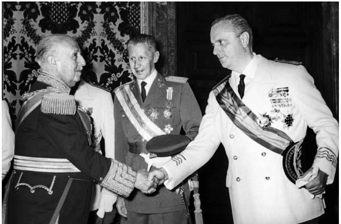
Manuel Fraga Iribarne, ministre d'Informació i Turisme de la dictadura franquista entre 1962 i 1969, va ser l'encarregat de la imatge del règim

La família de Luís Cernuda, el poeta que va immortalitzar els versos "recorda-ho tu i recorda-ho als altres" era del mateix parer. Quan, en plena dictadura, van demanar permís al ministre franquista perquè el poeta pogués assistir a l'enterrament de la seva mare des de l'exili mexicà, Manuel Fraga Iribarne els va etzibar: "¡Que se quede dónde está! ¡Ya tenemos bastantes maricones en España!". Poc abans, el 1962, va titllar les dones dels miners en lluita de la conca del Nalón d'Astúries de "polloses". Havien estat rapades a la caserna de la Guàrdia Civil, humiliades, passejades pels carrers de Langreo i reiteradament colpejades. Dos anys després, Fraga Iribarne dirigia la cínica campanya del règim 25 años de Paz . També va