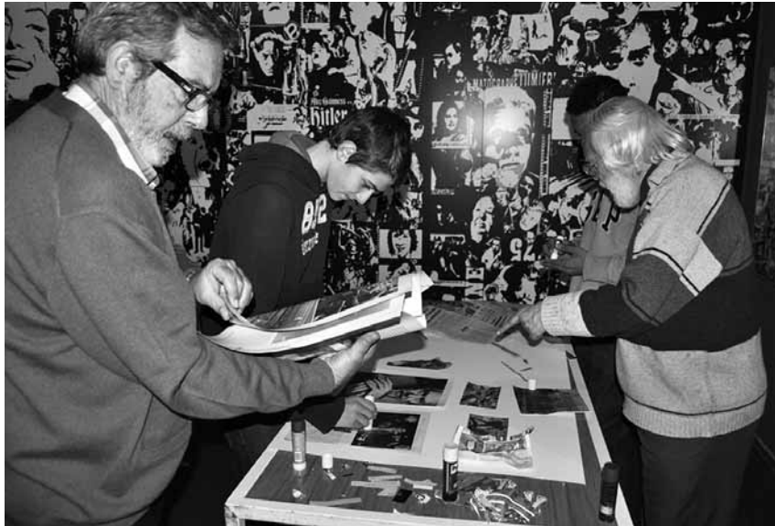
Dos membres del grup Praxis 75 durant el taller de 'collage' que forma part del conjunt d'activitats de l'exposició

Quim Gibert expressions@setmanaridirecta.info