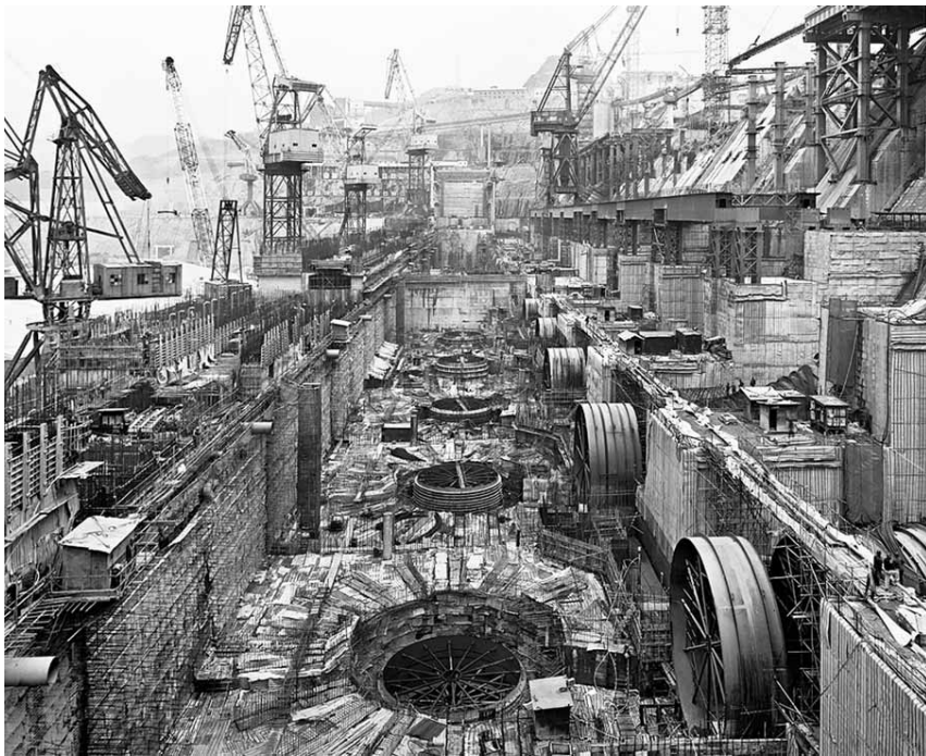
'Damm #6' és una fotografia de la presa de les Tres Gorges, on les persones són quasi invisibles a l'ull del públic espectador

manera, les fotografies de la presa mostren els treballadors com petites formigues enmig dels enormes materials, un espai ocupat només per ciment, tubs i turbines que sembla una ciutat futurista sense ànima. Igualment, la sèrie Urban Renewal #6 (Renovació Urbana) retrata uns edificis quasi infinits que s'acosten més a la maqueta ideada per Fritz Lang a Metròpolis que no a la realitat quotidiana de les persones que hi han de viure.