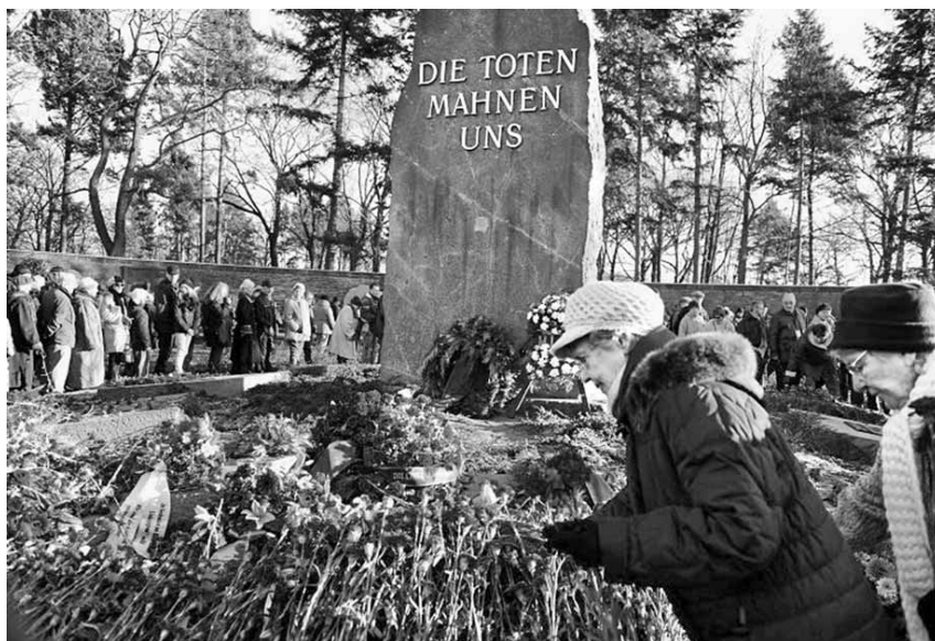
Ofrena de flors, a càrrec del partit socialista Die Linke, al 'Memorial dels Socialistes'

lisme, el poder dels bancs, la intenció del govern Merkel d'establir un govern econòmic europeu, l'impopular subsidi d'atur de llarga durada Hartz IV i els minijobs . El bloc més nombrós va ser el que formaven les bases de Die Linke, seguit pel Partit Comunista Alemany (DKP). Es va poder veure gent gran amb parques marrons i casquet de pell o ushanka russa, amb banderes de la República Soviètica de Baviera i de la RDA. També hi havia un grup de joves de prop de 30 anys amb camises blaves de la FDJ (l'or-