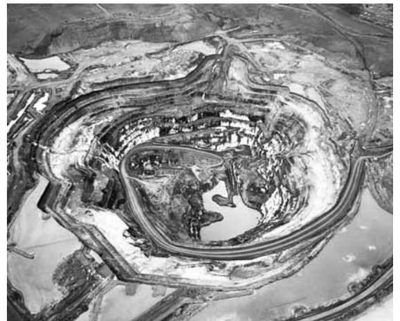
'Silver Lake Operations #1': el gran forat que s'ha fet a Austràlia és una mina d'argent

condicions climàtiques i laborals inhumanes, al voltant del Kingfisher , un antic vaixell de pesca que està esperant la seva fi. El conjunt de les Pedreres-fetes a Portugal i a les famoses pedreres de Carrarà a Itàlia Carrara marble quarries #2 (Pedreres de marbre de Carrarà)- és una autèntica obra cubista. Aquest tipus de marbre ha estat molt apreciat des de l'antiguitat i és el que va utilitzar Miquel Àngel per fer les seves famoses escultures, però, avui dia, la pedrera gairebé és un forat sense fons, després d'haver estat explotada al màxim. Potser una de les fotos més atractives