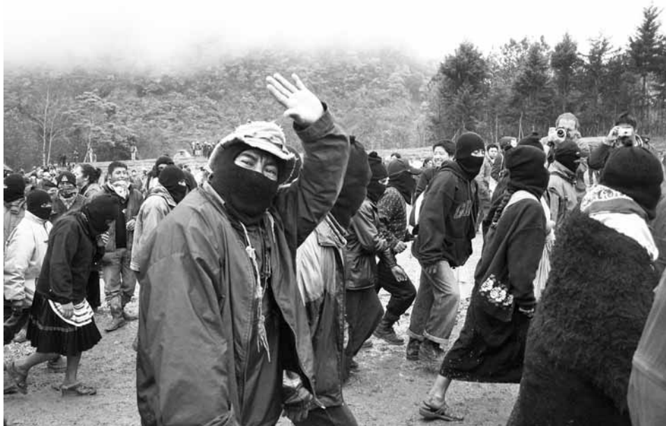
A través de Promedios, coneixem en primera persona el relat de la lluita indígena

Per coordinar bé la seva labor, Promedios s'estructura en les àrees de capaciació, seguiment i assessorament de les produccions i coordinació entre les comunitats. També hi ha l'àrea de dis-