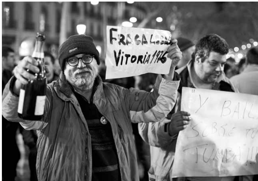
400 persones van celebrar amb cava la mort de Fraga a Canaletes

David Fernández estirantdelfil@setmanaridirecta.info