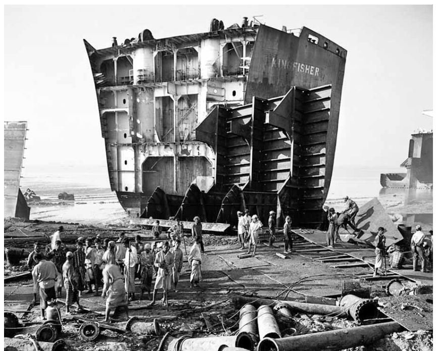
'Shipbreaking #4' mostra treballadors que participen en el desballestament de vaixells a Bangla Desh

Xangai. També es reproduceix el documental dirigit per Jennifer Baich sota el títol Manufactured Landscapes (Paisatges Fàbriques), que segueix Burtynsky al llarg dels seus viatges a la Xina. El treball presenta els efectes adversos de la ràpida i forta revolució industrial que ha viscut la zona. De la mateixa