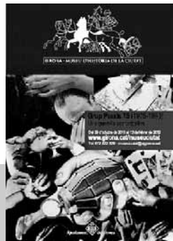
Grup Praxis 75 (1975-1990) Una guerrilla comunicativa