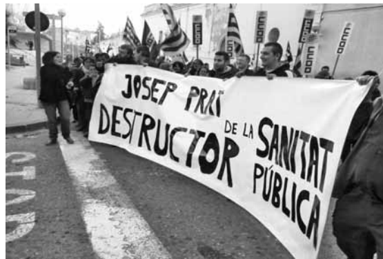
El Camp organitza accions més contundents contra la privatització de la sanitat

Algunes ja s'han afanyat a titllar Prat d'"innovador" per la seva dedicació al holding municipal INNOVA. El model de gestió de serveis reusenc és, al cap i a la fi, el model cap al qual s'encaminen totes les administracions sota el segell de Convergència i Unió: crear empreses privades per a la gestió de tots els serveis i béns, des de l'aigua fins a la sanitat. El pressupost és tres vegades més elevat que el del consistori i els comptes del holding són completament opacs: ningú no sap com es distribueixen els fons públics en aquesta corporació, ni tampoc quin és el sou de Josep Prat. Després de la denúncia de la CUP, caldrà esperar la resolució de l'Audiència Nacional espanyola, que provocarà la investigació