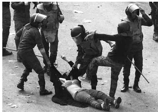
Una manifestant és arrossegada i colpejada durant les protestes del 20 de desembre

Aquests fets s'han produït enmig de la preocupació per la minsa presència femenina al proper parlament egipci. Les votacions, emmarcades en un sistema que desempara qualsevol paritat de gènere, han dibuixat un parlament de majoria masculina aclaparadora. La clara victòria de les forces islamistes, amb un augment significatiu del partit salafista Nour, ha ajudat a configurar un panorama que les analistes occidentals no veuen massa propici als drets de les dones. Molts sectors activistes, però, han demanat calma i prudència i han re-