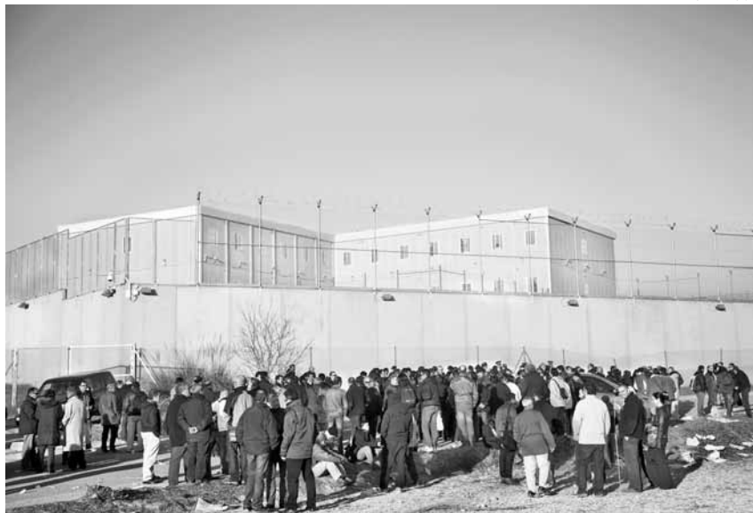
Concentració de funcionàries de la presó de Quatre Camins celebrada el 14 de gener

antidisturbis dels Mossos es van desplegar al voltant dels principals centres penitenciaris catalans per controlar la vaga del funcionariat de presons, que també protesten per les retallades que afecten les seves condicions salarials. La majoria de la gent present a les dues mobilitzacions es va