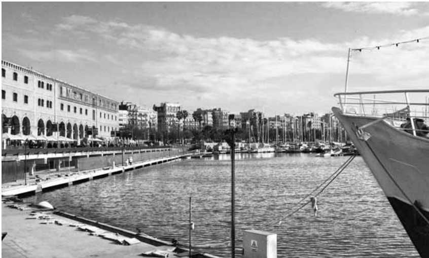
Inèdita imatge del Port Vell, sense embarcacions ni pantalans. Els operaris han instal·lat tanques per a fer les obres.

Marc Iglésias redaccio@setmanaridirecta.info