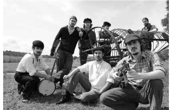
El treball del grup del Maresme es pot descarregar a través de la seva web

Oriol Fuster i Cabrera expressions@setmanaridirecta.info