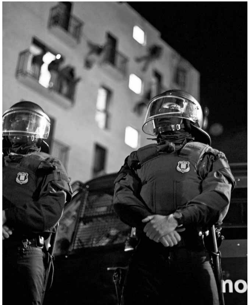
Antidisturbis dels Mossos d'Esquadra custodien l'edifici 18-N durant el seu desallotjament