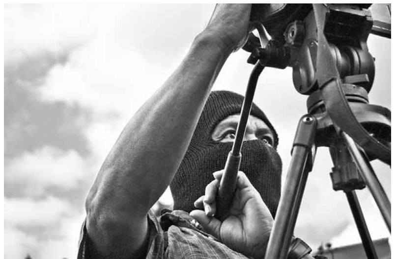
La revolta zapatista s'ha servit dels mitjans per projectar-se arreu del món

Precisament, Promedios es va formar gràcies a l'aliança entre diferents activistes i organitzacions mexicanes i estrangeres involucrades en el món del periodisme. L'interès de les comunitats per utilitzar les seves càmeres de vídeo i la col·laboració de persones