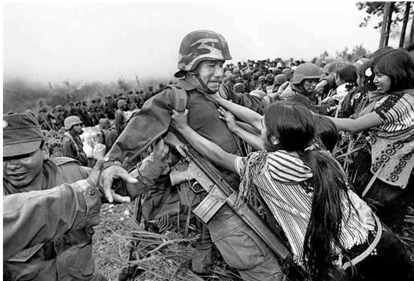
Una de les múltiples protestes contra la militarització a la regió de Chenelhó, a Chiapas

El jutge Alvin W. Thompson, cap de la cort federal del districte de Connecticut, decidirà, el proper 27 de febrer, si vol fer història i jutjar l'expresident mexicà Ernesto Zedillo per crims de lesa humanitat, arran d'un dels episodis més obscurs de la seva legislatura: la matança d'Acteal. En aquesta població rural de Chiapas, el 22 de desembre de 1997, 45 indígenes de l'organització civil Las Abejas van ser assassinades per diversos grups paramilitars. L'episodi d'Acteal va evidenciar cruelment la guerra de baixa intensitat duta a terme pel govern del Partit Revolucionari Institucional (PRI) contra l'Exèrcit Zapatista d'Alliberament Nacional (EZLN) arran del trencament del diàleg de l'agost de 1996.