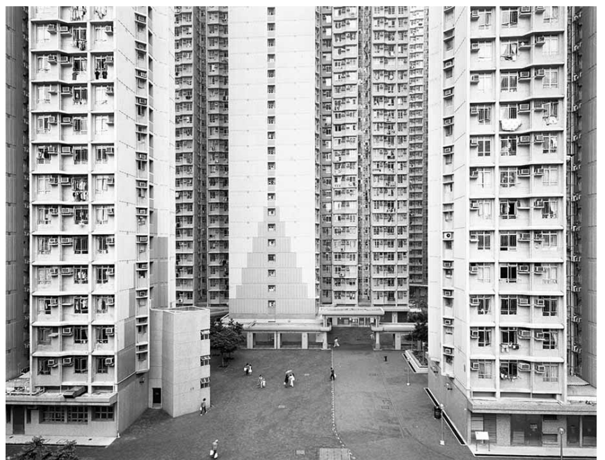
L'obra 'Urban renewal #6' reflecteix com està creixent de manera incontrolada la ciutat de Xangai