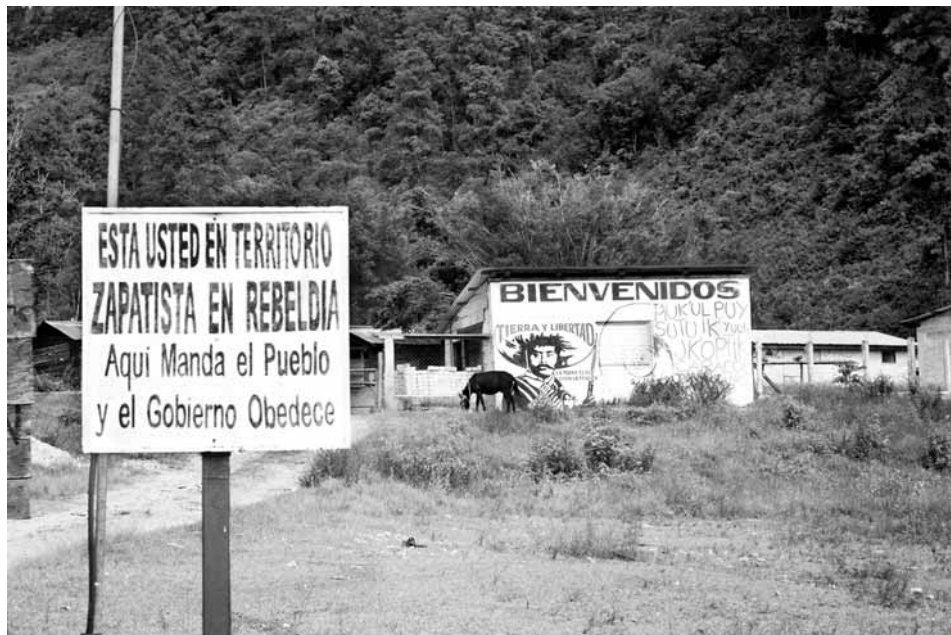
La majoria de documentals ofereixen una mirada nítida de la vida a Chiapas

Des de l'any 1998, Promedios facilita capacitació, recursos tecnològics i la informació necessària per utilitzar-los a totes les comunitats indígenes de Chiapas, que, amb cinc milions d'habitants censades (dedicades al turisme, a la producció agropecuària de cafè i de xocolata i a l'artesanía), arrosseguen un