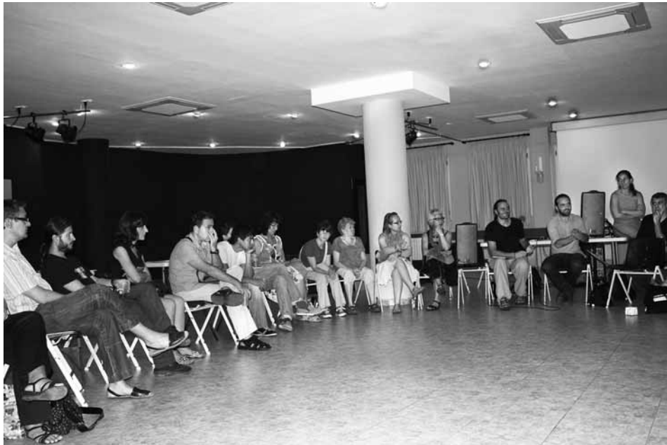
Presentació del PEP al Centre Cívic Sant Martí el 7 de juliol de 2011

En aquest cas, el projecte es va desenvolupar al barri de Sant Martí i va ser una de les primeres iniciatives que es van posar en marxa en el marc de l'anomenat Pla Energètic Participatiu de Sant Martí de Provençals (PEP). A Sant Martí, setze famílies van participar a l'estudi; de totes elles, vuit havien instal·lat comptadors intel·ligents i unes altres vuit no. Cada quinze dies, es van convocar trobades amb les veïnes participants per compartir les impressions i les experiències sobre el projecte i, de pas, anar creant una xarxa de relacions dins el barri.