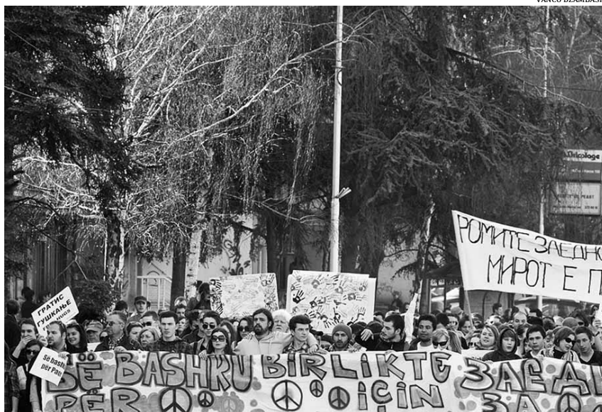
Marxa per la Pau a la ciutat d'Skopje, Macedònia, després d'una onada d'enfrontament racistes al país

al Parc de la Ciutat de la capital, Skopje. Però, malgrat la intenció noble de la mobilització, la marxa va quedar marcada per la utilització política que en va fer el govern a través de la participació d'alguns dels seus membres a la convocatòria i pel biaix mediàtic. A Macedònia, els enfrontaments, normalment protagonitzats per joves, van des dels avalots, les agressions i els assalts a trens i autobusos, fins als grafitis, el hackeractivisme, els atacs incendiàries a esglésies cristianes ortodoxes o mesquites i la crema de banderes. El balanç, avui dia, és d'una trentena de persones detingudes i una cinquantena de ferides. Les baralles també s'han traslladat a les grades dels estadi de futbol; la lliga va quedar suspesa durant una setmana després que un grup d'ultras del FK Shkën-