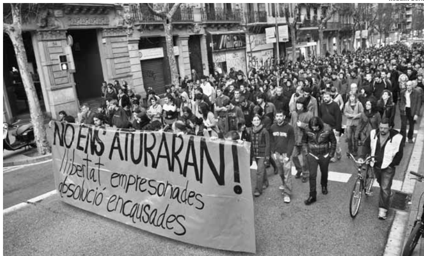
Manifestació a Barcelona en defensa de les encausades i les empresonades de la vaga del 29-M

puny de ferro i guant d'espargit contra la protesta social. El conseller, però, ho havia anunciat ara fa un any. El 2 de maig de 2011: "Aniré més enllà de la llei" en el combat contra la dissidència. Només tres setmanes després, el 27 de maig, vindria l'intent frustrat de desallotjament -sense cap ordre judicial- de l'acampada del 15M a la plaça de Catalunya, que es va saldar amb 121 persones ferides i on es van estrenar les noves pilotes de goma. I fet i fet, Puig es va estrenar el gener de 2011 -sota la