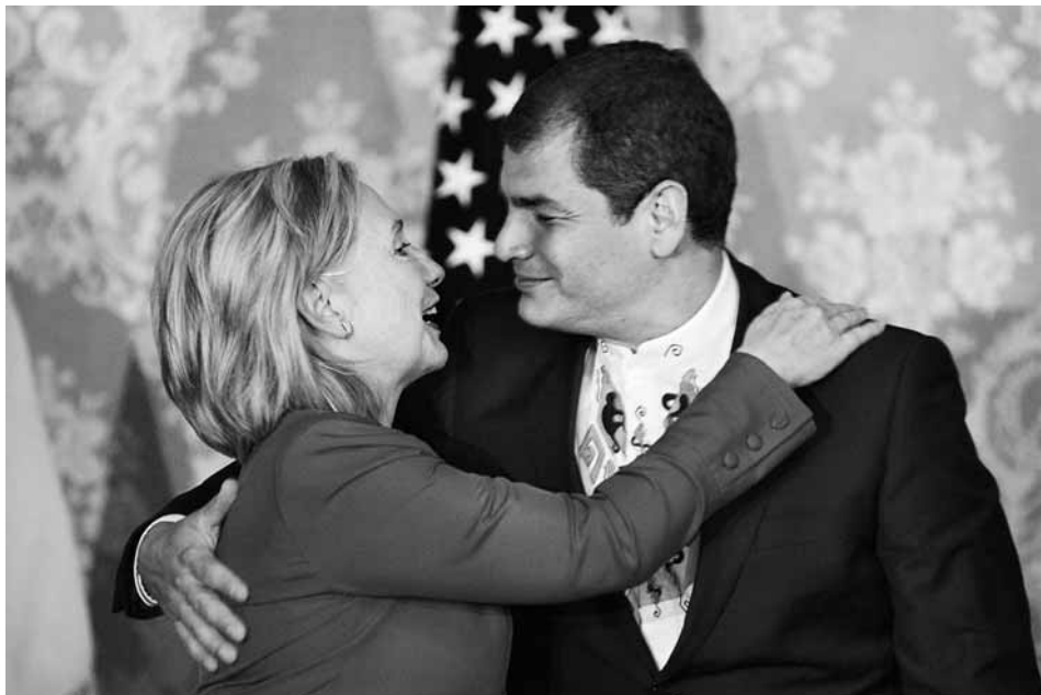
Correa rep la secretària d'Estat dels EUA, Hillary Clinton, a Quito, en una visita el juny de 2010

"Que, allà (EUA), els delictes d'opinió no comportin presó, no m'importa. Aquí, crec que és necessari", assegurava Rafael Correa. Un altre