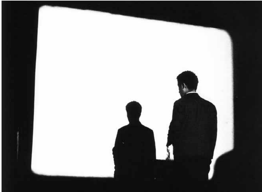
'Zen for Film', performance de Nam June Paik duta a terme l'any 1964

Alfonso López Rojo expressions@setmanaridirecta.info