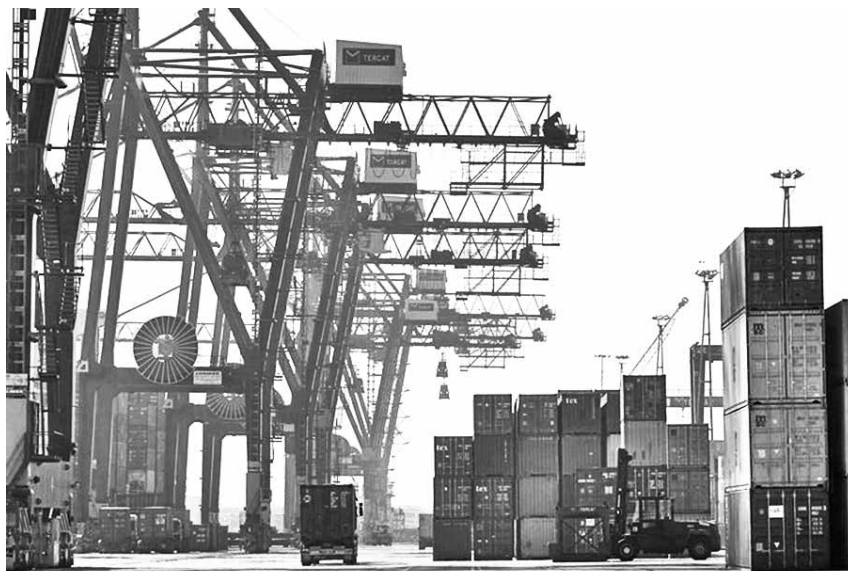
Detall d'una de les terminals del Port de Barcelona que controlava l'empresari José Mestre

hauria sufragat un 30% de les despeses per la importació d'un total de 1.700 quilos de cocaïna des de l'Amèrica Llatina. Exdirector general de Terminal de Contenedores de Catalunya (TERCAT), l'operadora logística més gran del port, Mestre va ser detingut el 22 de juny de 2010, quan es va descobrir la seva implicació a l'hora de facilitar l'entrada de diverses partides de coca, sobretot procedents de Panamà. L'operador, el jutge va decretar el seu ingrés a presó, d'on va sortir el juliol de l'any passat sota una fiança de deu milions d'euros.