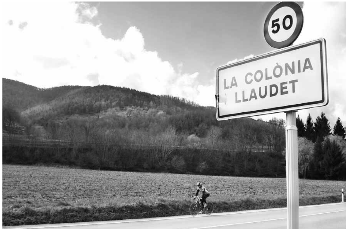
La planta de biomassa es vol construir a una de les poques planes fèrtils que encara resten a la comarca del Ripollès

presa promotora, Agefred, filial de Dalkia, defensa que la planta suposarà una inversió de 35 milions d'euros i que comportarà la creació de més de 250 llocs de treball (100 directes i 150 indirectes). Els números, però, no surten: d'altres plantes de biomassa amb una dimensió semblant que hi ha en funcionament donen feina directa-