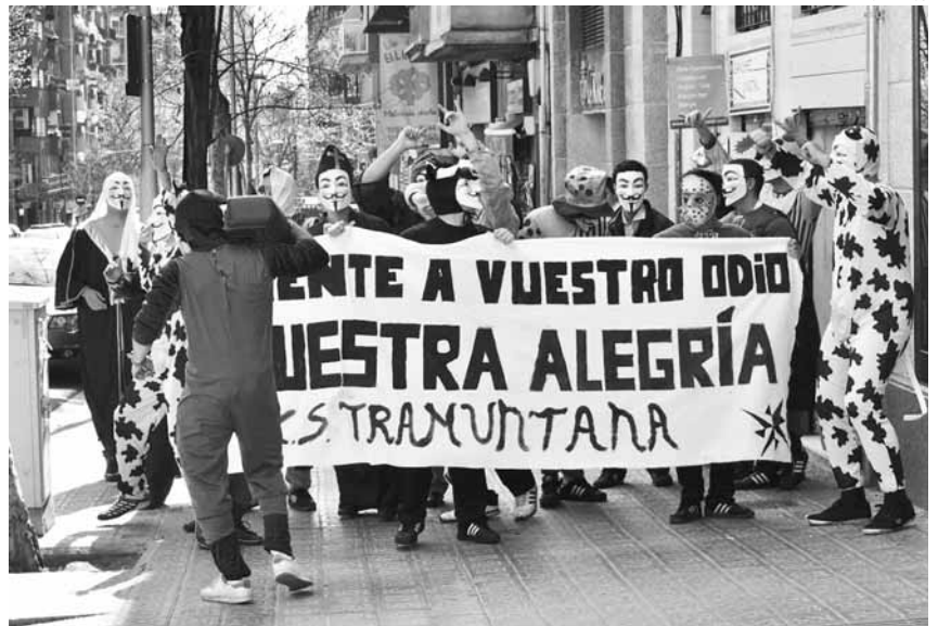
Membres del Casal Tramuntana de Barcelona, disfressats i ballant al ritme de Hard Bass, increpen un grup d'antifeixistes

Impulso però, a la web, no amaga la seua posició respecte a la immigració: "Defensem la identitat de cada poble, la seua idiosincràsia i la seua cultura davant les ingerències estranyes". La resta de l'ideari de l'associació bé podria ser signada per qualsevol moviment social crític, però, com que no entra en detalls, difícilment es pot deduir que es tracta