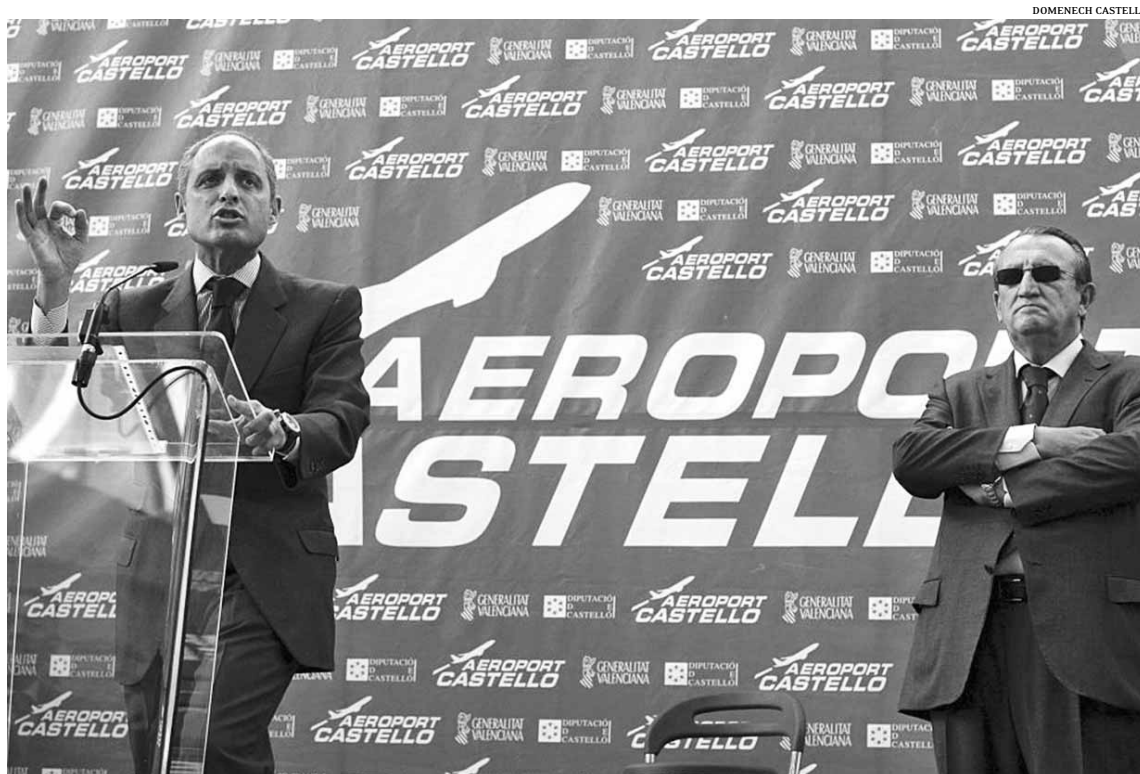
Francisco Camps i Carlos Fabra a l'acte d'inauguració de l'aeroport de Castelló el 25 de Març de 2011