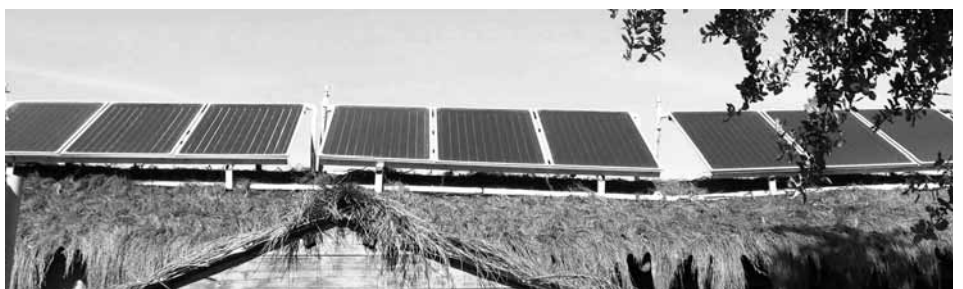
La descentralització energètica és una peça clau del PEP

mes de gener de 2011, de la segona convenció de signants de l'Agenda 21 de Barcelona, un punt de trobada per analitzar i valorar l'evolució de les necessitats emergents i les noves tendències locals de la ciutat de Barcelona en matèria de sostenibilitat. En aquella trobada, es va decidir reforçar la xarxa d'agents en les temàtiques de treball de l'Agenda 21 local. Dels diferents grups de treball organitzats per implementar accions i idees, en va sorgir l'anomenat Grup per la promoció d'un Pla d'Energia Participatiu d'un barri. A partir d'aquella taula de treball, un grup motor constituït pels grups de Sant Martí en Transició, Barcelona en Transició, Eco-Union, l'Institut de Govern i Polítiques Públiques (IGOP), l'Agència