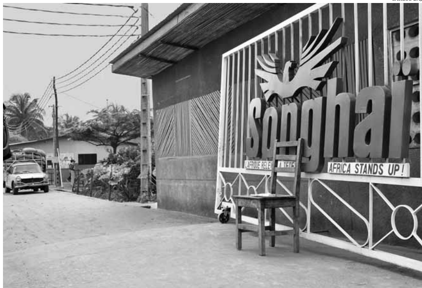
El Centre Songhai de Porto Novo també és un espai de formació i de capacitació per a les agricultores locals