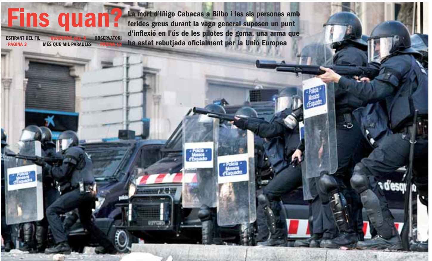
Diversos escamots de la Brigada Mòbil dels Mossos apunten a l'alçada del cap amb les escopetes de bales de goma durant la vaga general del 29 de març a Barcelona

La mort d'Iñigo Cabacas a Bilbo i les sis persones amb ferides greus durant la vaga general suposen un punt d'inflexió en l'ús de les pilotes de goma, una arma que ha estat rebutjada oficialment per la Unió Europea