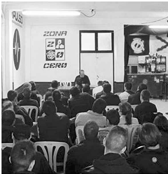
Acte a la seu de l'organització Impulso de Castelló de la Plana

Descobrim la militància neonazi d'alguns dels promotors de la xerrada amb neofeixistes italians de Casa Pound que s'organitzà el mes de gener passat a Castelló i les disfresses amables de les noves organitzacions i centres socials nazi-feixistes a casa nostra