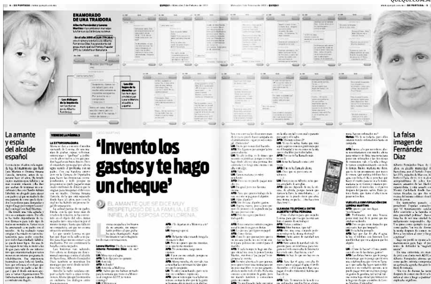
El diari mexicà 'Quequi' va publicar la notícia l'1 de febrer de 2012 amb el contingut de les gravacions d'àudio i els SMS

seva vida privada-, tot i que les direccions dels diaris i les editores de programes de televisió i ràdio n'estan al corrent des de fa setmanes. Les direccions d' El Periódico , La Vanguardia , el diari Ara , BTV i RTV , entre d'altres, han decidit no publicar el contingut de les gravacions tot i haver-ne pogut confirmar l'autenticitat. De les converses es desprèn que Fernández Díaz va crear una oficina electoral en el marc de les eleccions municipals de 2011, per afavorir els interes-