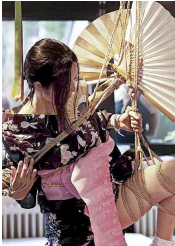
El poder transgressor del cos i de la sexualitat són els eixos que articulen el festival

El festival consta de 23 tallers dividits en tres àrees temàtiques: sexe i sensualitat ( Ioga per parelles nues, Ejaculació femenina, Orgies per a principiants... ), creativitat i jocs ( Jocs d'animals, Noves concepcions de l'orientació sexual que aporten les noies 'mariques' i els