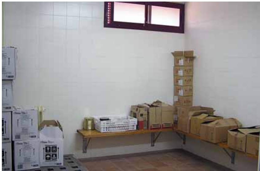
Els aliments del projecte solidari es desen al vestuari del centre cívic del barri