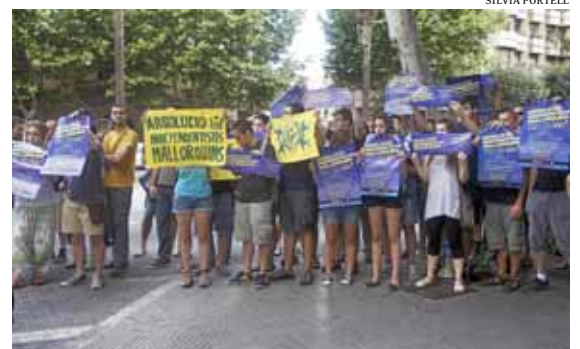
Concentració prèvia al judici dels encausats pels fets de la Diada de 2010