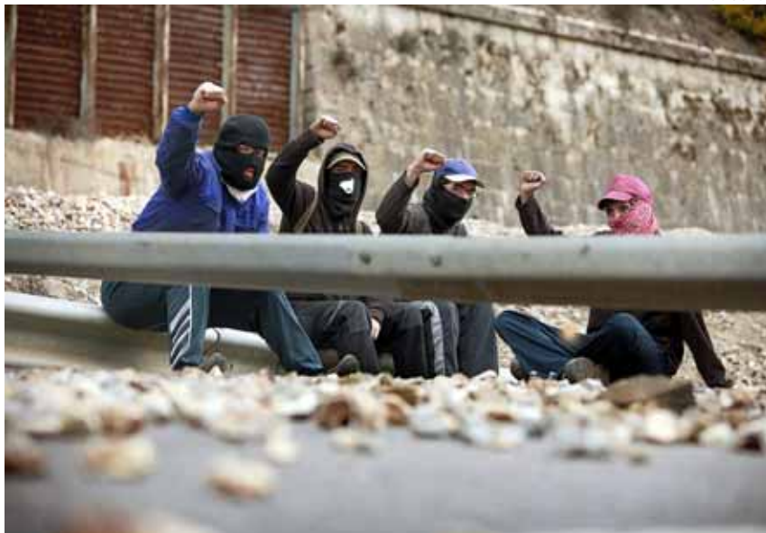
Miners del municipi asturià de Figueredo s'enfronten a la Guàrdia Civil amb llançacoets

Més de vint dies de vaga indefinida La llarga tradició de lluita de la mineria ha fet que la vaga sigui molt combativa i, ja des del primer dia, s'han viscut enfrontaments molt durs entre vaguistes i la policia, que, tot i exercir una repressió molt dura, ha estat incapaç d'aturar els piquets. L'organització de la lluita, l'ampli suport social, el coneixement geogràfic de la zona i la