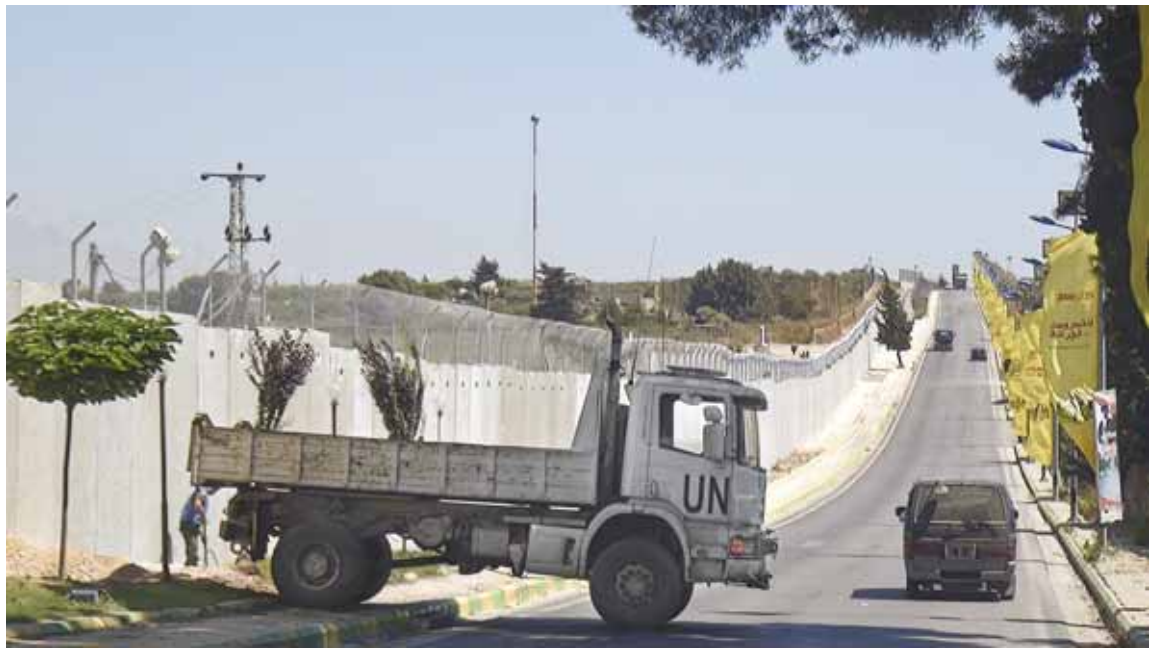
El mur de la carretera de Kfar Kila fa prop de sis metres d'alçada i s'estén al llarg de dos quilòmetres

Els incidents als quals feia referència la portaveu de les autoritats d'Israel són el llançament de pedres des del Líban cada cop que els soldats israelians s'aproximaven a la zona de Kfar Kila a patrullar. També hi havia friccions entre els soldats d'ambdós països, "molts d'ells parlen àrab i ens insultem constantment", explica un soldat libanès, abans d'assenyalar i, alhora, cridar "gos!" a un militar israelià elevat sobre el mur. Altres, com el soldat Rodríguez de les Nacions Unides, que fa onze mesos que és al país, asseguren que no han vist ni sentit parlar de cap incident.