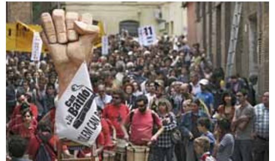
El veïnat va ocupar Can Batlló l'11 de juny de 2011

Anna Pujol Reig expressions@setmanaridirecta.info