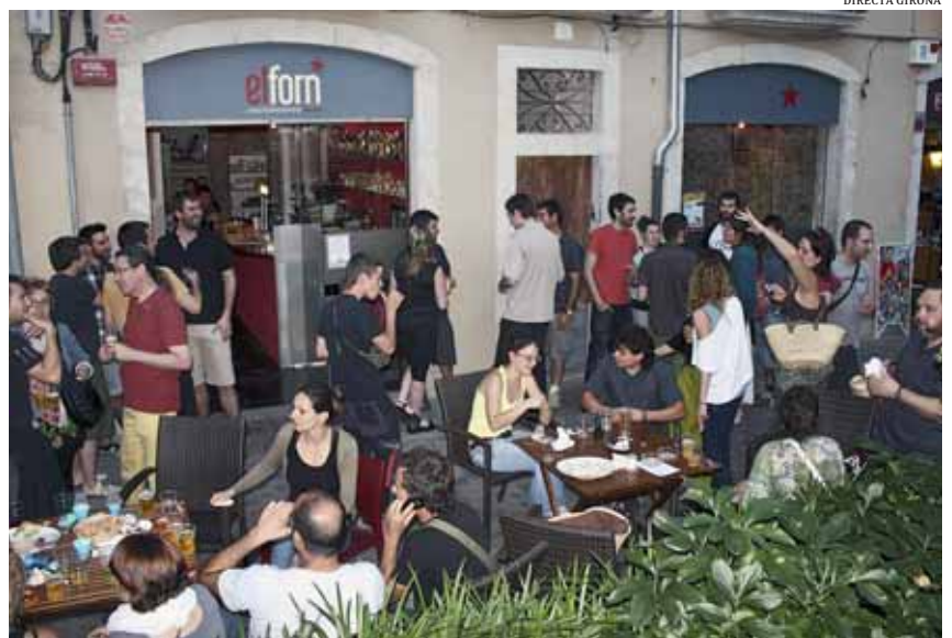
Inauguració de la nova seu del Casal Independentista El Forn

Plaça Sant Pere 5 (Girona) Horari: de dimarts a dissabte Dm-dc: 19h-00h Dj: 19h-01h Dv-Ds: 19h-02:30h www.casalelforn.cat