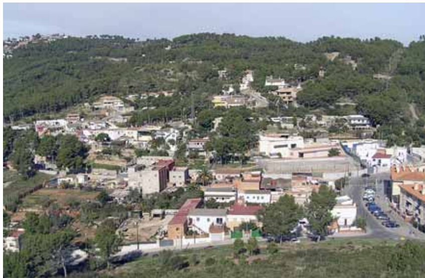
Panoràmica del barri de Ca n'Espinós de Gavà