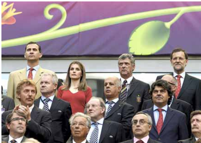
Mariano Rajoy va viatgar a Polònia a veure el partit de fútbol de la selecció espanyola l'endemà del rescat bancari

Per si quedava algun dubte per esvaïr, el president de la Comissió Europea, Duraó Barroso, va ser clarificador: el memoràndum, el signarà l'Estat espanyol, que “serà plenament responsable de l'assistència financera”, tal com recull el principi d'acord signat el 9 de juny. El què, doncs, ja està decidit. Només falta saber el com: Rajoy voldria que el rescat fos per la via de la recapitalització directa sobre els bancs, però, aquesta setmana, la UE ha advertit que la fórmula és impossible i que haurà de passar per l'Estat via FROB. L'opció que es triï queda dependent de la cimera del G20 -on Rajoy sí que ha reconegut que el rescat és “tremendament nociu” pel deute