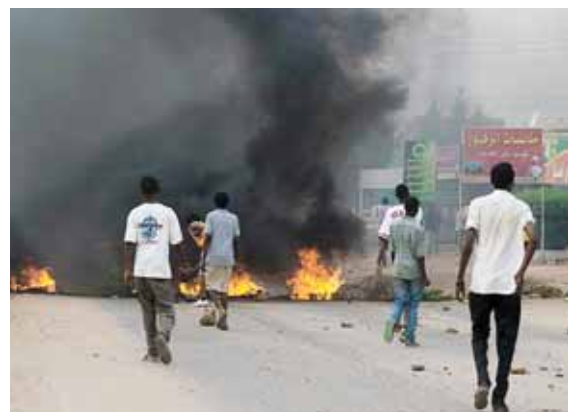
Les protestes de Khartoum s'han estès per tot el Sudan

Però les protestes no son aïllades ni noves. Seguint el rastre de les revoltes àrabs, Khartum va viure manifestacions contra el règim el 30 de gener de 2011. Convocades pel moviment Girifna ( la nostra repulsió ), les mobilitzacions van ser poc nombroses i reprimides mitjançant detencions policials, però van donar embranzida a l'augment de les protestes al llarg de tot l'any. Van ser especialment significatives les mobilitzacions estudiantils de Kassala l'octubre de 2011, la lluita contra els desallotjaments provocats per la construcció de la presa de Merowe o la insurrecció que va portar la població de Nyala a cremar la seu de l'oficialista PCN i les comissaries policials durant una setmana boja el mes de gener d'enguany.