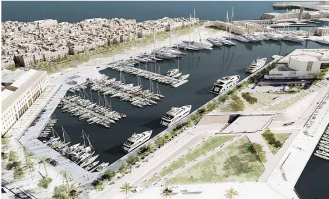
Plànol de la futura marina de luxe del Port Vell promoguda per Salamanca Group

Marc Iglesias redaccio@setmanaridirecta.info