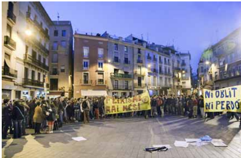
Concentració de rebuig a l'agressió feixista el 25 de març a Manresa

Segons algunes dades publicades, les detencions s'haurien practicat seguint el fil de la furgoneta Mercedes Vito blava, que va ser el vehicle amb el qual el grup atacant es va desplaçar de Capellades a Manresa. El testimoni d'un veí que va veure la furgoneta poc abans dels fets i després la va reconèixer arran de la descripció feta per un testimoni de l'atac va ser el primer dels indicis. Segons la investigació, s'hauria detingut una primera persona que hauria confessat i aportat un gran volum d'informació del cas. A més, les escoltes telefòniques ordenades pel jutjat, que han estat transcrits i afegides al sumari, haurien