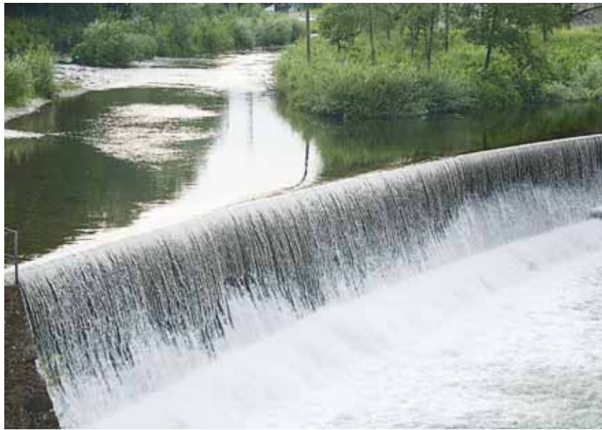
El riu Ter, una de les principals fonts d'abastament d'aigua de Catalunya, a l'alçada de l'aiguabarreig amb el riu Freser

Fa anys que el sector privat deleja l'últim tros del pastís. L'electricitat, el gas i les comunicacions ja són serveis domèstics bàsics totalment privatitzats, però l'aigua encara s'hi resisteix. Amb el subterfugi de la crisi econòmica, arriba la gran oportunitat. La comercialització d'un servei bàsic com l'aigua és seductora per les