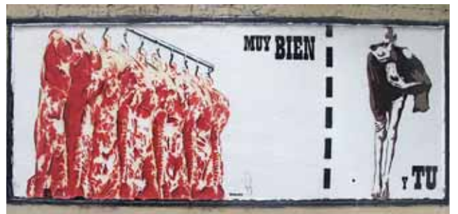
Grafit de Madre loe