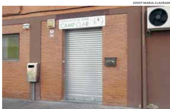
L'associació de veïns, eix del conflicte al barri tarragoní de Campclar

Campclar, un dels barris de Ponent, amb prop de dotze mil habitants, és el que acumula més rumors pel que fa a la seva suposada conflictivitat social. Des del seu naixement, és lloc de residència d'immigrants, tant de l'Estat com de fora. Fa poc, s'hi ha inaugurat la nova comissaria dels Mossos d'Esquadra, just al costat de les obres d'un centre cívic que van per llarg. El mes d'abril d'enguany, s'hi van celebrar les eleccions a la junta de l'associació que representa la voluntat veïnal davant del consistori i de la resta de la ciu-