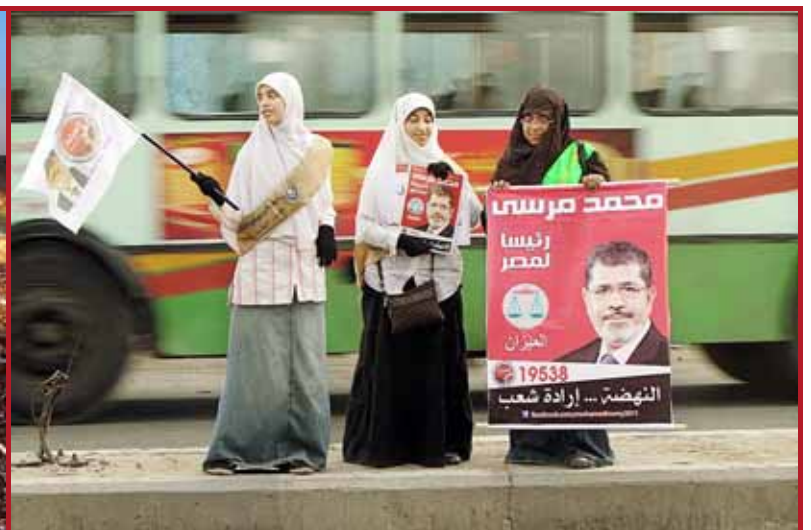
Les partidàries de Mursi van omplir el centre de la capital egípcia