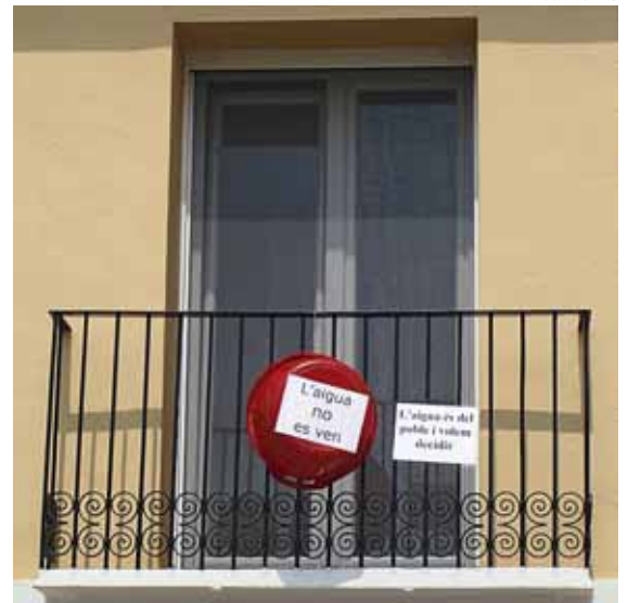
“Bétera per l'Aigua” ha fet servir els balcons del poble per visibilitzar la campanya

Però la gent del poble va decidir exercir el seu dret a opinar, a la democràcia. D'aquí va sorgir la Iniciativa ciutadana per la Gestió Pública de l'Aigua, Bétera per l'Aigua, un conjunt de ciutadans i ciutadanes de Bétera que es van posar a treballar de valent: van fer una assemblea oberta per organitzar-se; començà la recollida de signatures de suport al manifest Per un referèndum sobre el model de gestió de l'aigua. 10 motius per defensar la gestió pública de l'aigua de Bétera ; van convocar la gent a assistir al ple