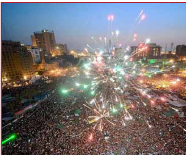
Celebració de la victòria de Mohamed Mursi a la plaça Tahrir

Mursi es converteix en el primer president civil de la història d'Egipte, després de les quatre presidències militars consecutives des del cop d'estat dels oficials lliures de 1952. El futur president ha dimitit com a membre dels Germans Musulmans i com a president del partit Llibertat i Justícia de la germandat a l'espera de ser coronat el proper dia 30. Al seu primer discurs televisiu, el nou president va llegir un text llarg de mitja hora fent malabarismes polítics per satisfer tothom. El parlament lloava la memòria dels màrtirs, però també "la noble policia", l'exèrcit i fins i tot -i sorprenentment- els serveis secrets. "No us decebreu", va afirmar Mursi, abans de corroborar, per provar de fer l'ullet a les forces populars: "La revolució continua".