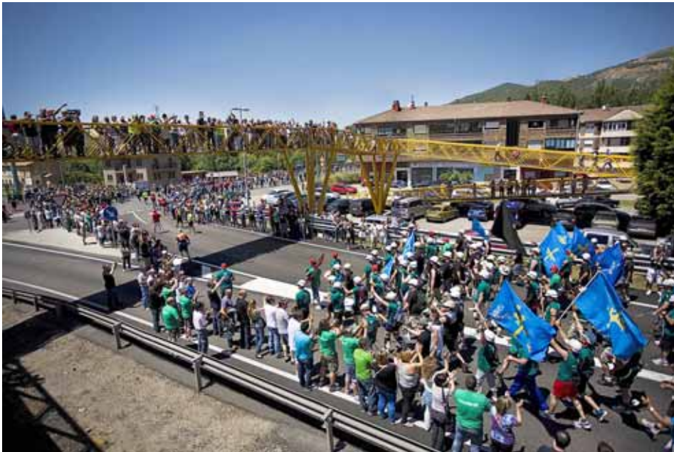
Arribada dels miners asturians al poble lleonès de Robla durant la marxa minera del 25 de juny