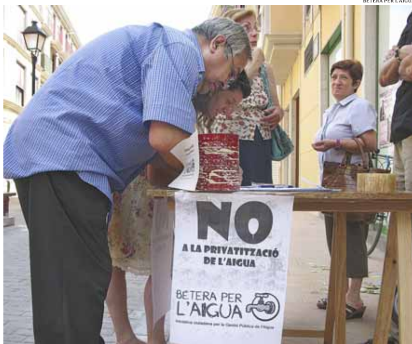
La plataforma opositora ha recollit 4.500 signatures contràries a la imposició d'un model privat de gestió de l'aigua

Les regadores, però, encara pensen dels balcons. Bétera no abaixa la guàrdia.