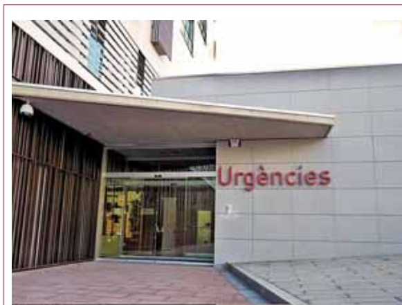
El centre sociosanitari Cotxeres de Borbó, ubicat al districte barceloní de Nou Barris