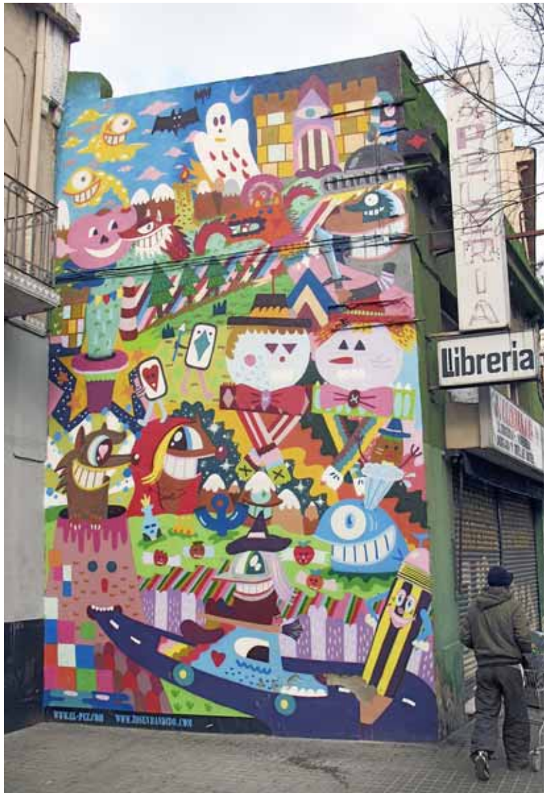
Mural de l'escriptor de grafit Zosen, amb la col·laboració de Pez, a Sant Adrià de Besòs

Valaz destaca l'experiència de Filadèlfia com a cas exemplar: "Per iniciativa d'una persona que treballava al departament contra les pintades, es va acabar organitzant un festival de grafit durant l'any 2000 i es va crear un tour per a turistes que va recaptar cinc milions d'euros". També comenta la iniciativa Beautiful city de Toronto, mitjançant la qual han aconseguit que hi hagi una taxa que gravi la publicitat a l'espai públic per compensar la ciutadania. "Les empreses compensen l'excés de publicitat i paguen un impost que serveix per finançar projectes d'art a l'espai públic. D'aquesta manera, destinen uns deu milions de dòlars en art".