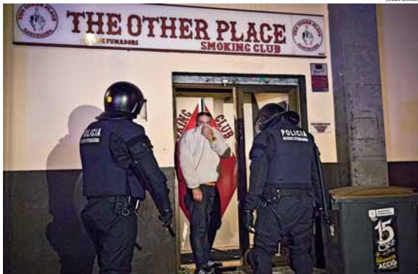
El 12 d'octubre un grup d'antifeixistes va llançar objectes contra el local on Democracia Nacional havia convocat un concert

Tot i que situacions com l'atac al concert antifeixista del 23 de març a Manresa han estat titllades de casos aïllats o són subestimades com a "baralles entre bàndols" o "revenges", el cert és que hi ha una estructura feixista al darrere. Diverses pistes vinculen aquestes agressions amb organitzacions d'ultradreta i neonazis, algunes d'elles legalitzades com a partits polítics. Cal recordar que alguns dels assistents al concert nazi del 12 d'octubre al Poblenou eren militants de Plataforma per Catalunya, del Movimiento Social Republicano o de Democracia Nacional. De fet, Plataforma Manresa Antifeixista ha alertat del perill d'aquestes organitzacions, ja que "conviden i emparen aquest tipus de violències".