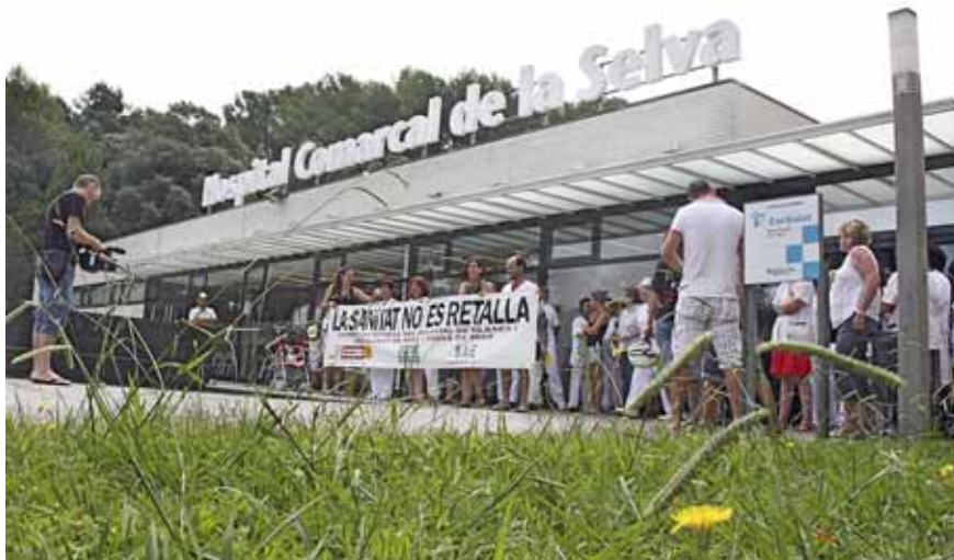
L'Hospital Comarcal de la Selva és un dels hospitals que gestiona la Corporació de Salut Selva i Maresme

Manu Simarro redaccio@setmanaridirecta.info