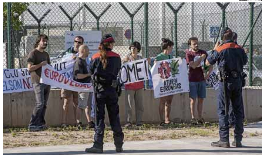
Els mossos van retenir a les manifestants per evitar que es trobessin amb la delegació de Las Vegas Sands el 25 de juny

La complexitat administrativa i contractual de qualsevol procés d'urbanització als terrenys del delta del Llobregat va fer sorgir la figura de les empreses intermediàries en la compra-venda de les parcel·les particulars. Segons ens explica un veí de Viladecans, en aquest municipi, fa anys que l'empresa E.P. Reformas y Servicios S.L. negocia porta a porta la signatura de documents davant de notari, on les propietàries es comprometen a vendre les seves finques a un preu acordat entre els 60 i 100 euros el metre quadrat en cas que un gran promotor vulgui urbanitzar la zona. Amb aquest treball previ, l'empresa intermediària es podria presentar davant la direcció d'Eurovegas o de qualsevol altra empresa i, a canvi d'unes comissions quantioses, entregar grans parcel·les del pastís en litigi sense necessitat que el promotor negociés amb les particulars.