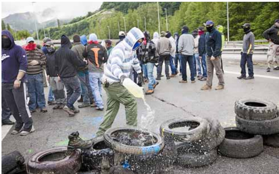
Miners del pozó Santiago tallan la A-66 en protesta per les retallades al sector

Durant l'època d'auge del 15-M, les seves integrants van pensar (amb raó) que tot el vigor adquirit per la protesta no podia ser desatès i, en conseqüència, que les formes clàssiques de protesta utilitzades s'havien esgotat, fins i tot la desobediència civil. Tothom sembla oblidar que, per comprar la pau social , abans va ser necessari posar en venda –i al preu més elevat possible– la guerra social . Caldria recordar a PP i a CiU que sempre som a temps de sortir a vendre al mercat.