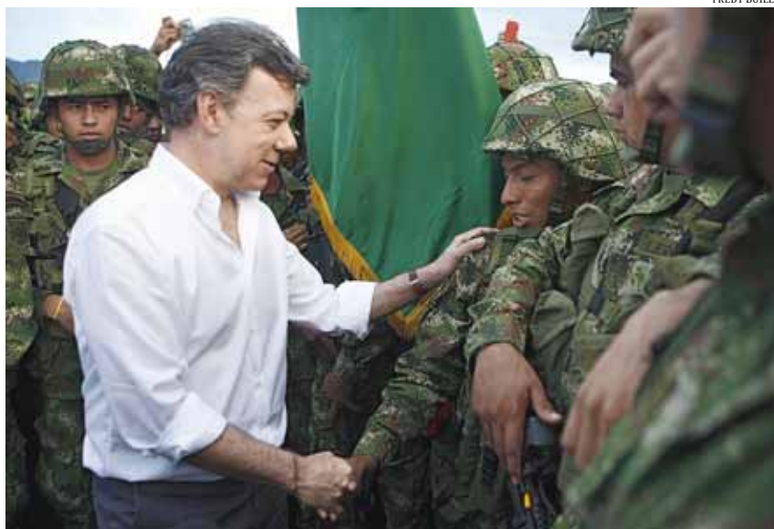
Juan Manuel Santos saluda els soldats després d'un acte militar el 13 de juny de 2012

El nou marc pretén centrar-se en la persecució dels màxims responsables (no únicament de l'aparell militar, sinó també financer i polític), però sobretot dels grups guerrillers, i oferir la reinserció social a les persones que no hagin comès crims greus -fet que suposa no jutjar una quantitat significativa d'agents implicats. En aquest sentit, la proposta ha aixecat crítiques per totes bandes. Tant l'ONG Human Rights Watch (HRW) com l'expresident conservador Álvaro Uribe coincideixen a advertir que