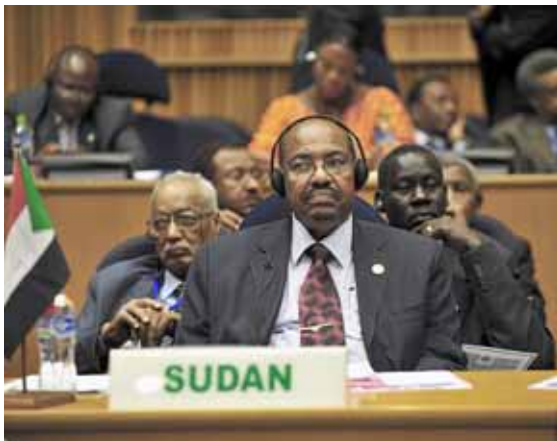
Al-Bashir és president del Sudan des de l'any 1989