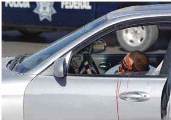
Les lluites internes successives sovint es tradueixen en assassinats