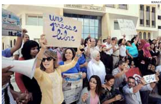
Periodistes tunisians del diari 'Assabah' durant la protesta del 12 de setembre