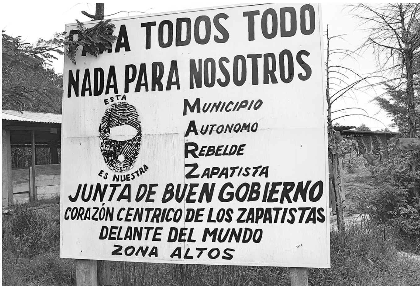
FOTOGRAFIA I TEXT: Marc Font