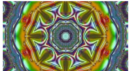
L'obra de David Vila és un calidoscopi de prejudicis, voluntats i convencions

Un recull de relats breus que ens acosten a la crítica i a la transformació social