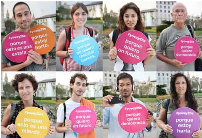
Algunes de les fotografies de la campanya del col·lectiu Enmedio

El col·lectiu Enmedio engega una campanya d'activisme creatiu per difondre el 25-S