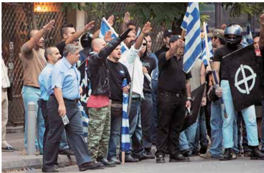
El líder Nikolaos Michaloliakos, a l'esquerra de la imatge, a una de les marxes del seu partit

La crisi econòmica i la nefasta gestió de la immigració situen el partit neonazi Alba Daurada al primer pla de l'escenari polític