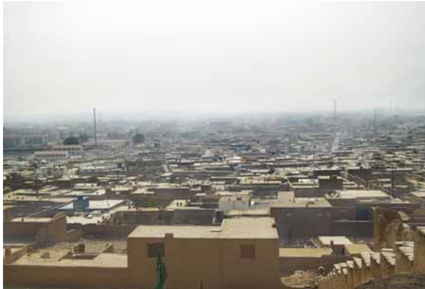
Panoràmica del barri d'Afshar, a Kabul, l'any 2008

A l'Afganistan, són les àvies les que diuen a les nêtes que no portin el burca, que no tinguin por de sortir al carrer a cara descoberta, que siguin valentes. I és que, a l'Afganistan, a diferència de Catalunya, les àvies són les úniques que han viscut èpoques de gran llibertat. L'any 1964 es va aprovar una Carta Magna on s'establí la igualtat de drets entre homes i dones i, l'any 1965, quatre dones van ser escollides diputades. Aleshores, les afganeses ocupaven més i més bons espais de l'esfera pública en comparació amb d'altres països que no eren musulmans. Què ha passat a l'Afganistan, per què ha canviat tant la situació?