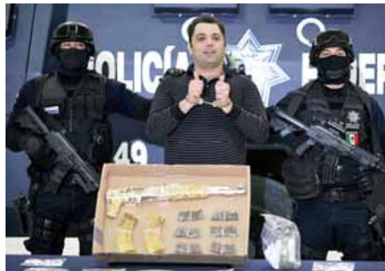
Un 'capo' es mostrat a la premsa després de la seva detenció el 9 de setembre

Però, el que podria semblar una estratègia contundent -amb el su-