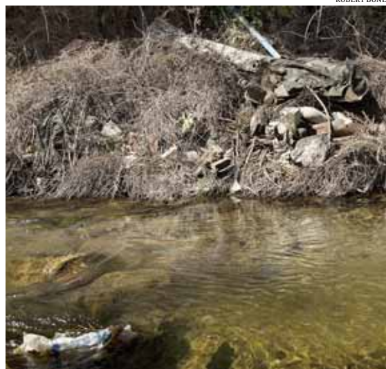
Durant el recorregut del rec, hi ha diverses zones amb runes i brutícia acumulada

aigües. Mentre passegem per la zona, ens trobem uns veïns que ens expliquen problemes similars: "Nosaltres som de Vallbona i agafem aquest camí molt sovint. És una via molt utilitzada, però no està il·luminada a la nit -amb el risc que su-