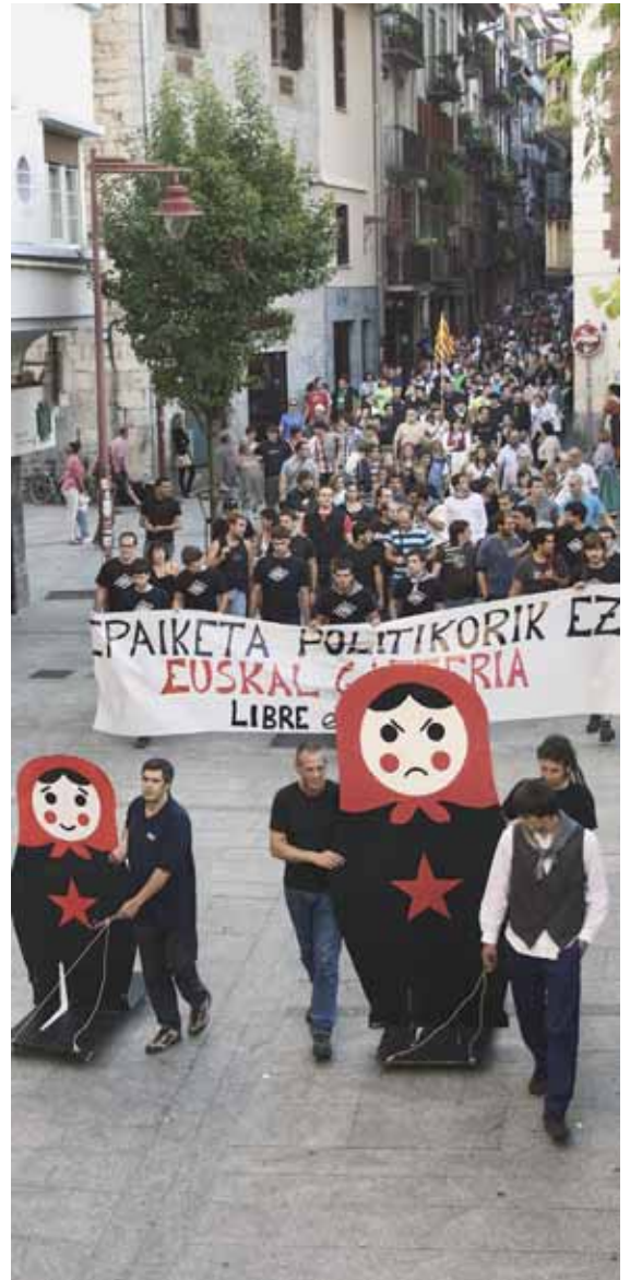
Manifestació a Hernani en suport dels joves processats i contra la persecució política de joves independentistes, 75 de les quals encara esperen judici a Euskal Herria