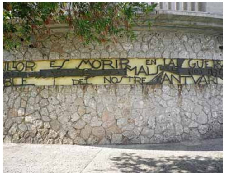
Cripta del Terç de Requetès de la Mare de Déu de Montserrat