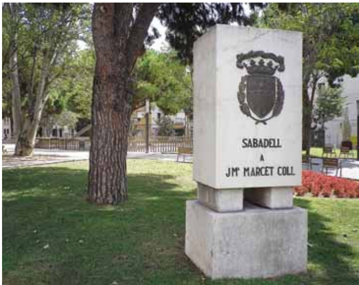
Plaça del batlle Marçet a Sabadell