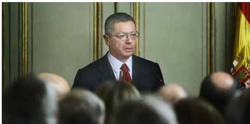
Alberto Ruiz-Gallardón va presentar l'informe sobre les modificacions que inclourà la reforma del Codi Penal el 14 de setembre

lloritat. La reforma crea una nova mesura privativa de llibertat postpenitenciària aplicable a qualsevol persona, responsable o no. Aquesta mesura, anomenada custòdia de seguretat, s'executarà just acabada la pena i pot arribar a allargar-se durant els deu anys posteriors al compliment de la condemna si el jutge considera que el subjecte és perillós. Al marge de la subjectivitat que implica un judici de perillositat -que podria encobrir fàcilment altres interessos-, la mesura podria castigar una manera de ser determinada i no un acte delictiu.