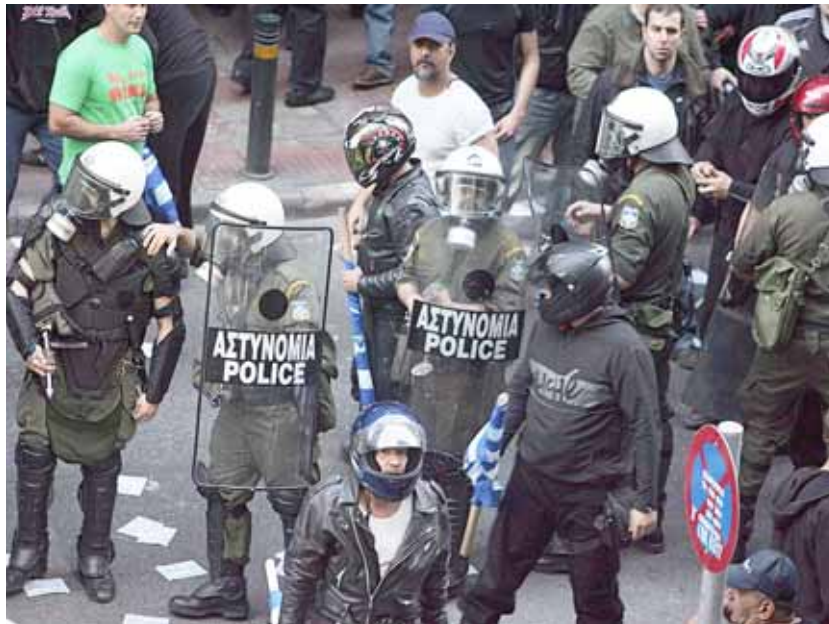
Els neonazis d'Alba Daurada han col·laborat amb la policia a l'hora de reprimir determinades manifestacions

Un estudi afirma que entre un 45 i un 59% dels efectius policials són votants d'Alba Daurada