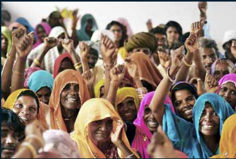
A les protagonistes de la marxa se les anomena satyagrahis , una paraula ben coneguda a l'Índia, que vol dir persones que actuen de forma no violenta, d'acord amb la filosofia i l'acció social de Gandhi. Per ser satyagrahi , cal una gran força interior i la determinació de canviar allò que ens sembla violent.

veu de les reivindicacions camperoles de les diferents comunitats. No obstant això, la xarxa internacional també es marca la fita d'intercanviar bones pràctiques al voltant de la no violència, la desobediència civil i el lideratge local. A més d'Ekta Parishad, el moviment l'integren organitzacions com Kenya Landa Alliance, que duu més de set anys de lluita per la política nacional de les terres de Kenya; Soned (Senegal), que defensa que les comunitats camperoles siguin les que administrin els seus recursos; Community Self-Reliance Centre (Nepal), que treballa amb gent sense terra i grups marginals, i Ekta Europa, una xarxa d'ONG i d'individus europeus que dona suport als moviments socials que ajuden les comunitats desposseïdes a recuperar el control sobre els seus mitjans de subsistència. Per localitzar tots els actes de solidaritat que es fan arreu del món, Ekta Europa ha elaborat un mapa amb les exposicions, fotografies i conferències que se celebren amb motiu de la marxa Jan Satyagraha. A Catalunya, l'acció promoguda per Ekta Parishad s'ha impulsat a través de la campanya de propostes de transformació social ACT! (Acció Comuna Transformadora) de 2012, organitzada pel Consens de Barcelona i impulsada per Nova, Innovació Social. L'acció camperola va resultar premiada, juntament amb Lorea, una plataforma virtual neutral, participativa i segura, que busca ser un nou mòdul de participació per les assemblees virtuals dels moviments socials.