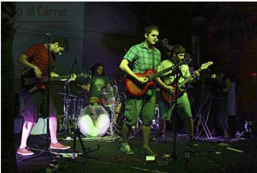
La banda de la Poble Llarga ha finançat el seu nou disc mitjançant el micromecenatge

'Projecte Escolopendra' és el primer disc del grup Mi Sostingut, amb temes que van de Ramon Llull als Teletubbies, passant per Burroughs.