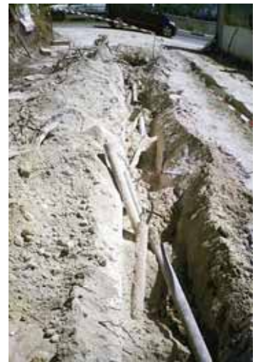
L'empresa Cobra va deixar les canonades d'amiant al carrer Miguel Hernández de la urbanització d'Edeta a Lliria

L'ús, la producció i la comercialització de l'amiant i dels productes que en continguin està prohibida des de 2002