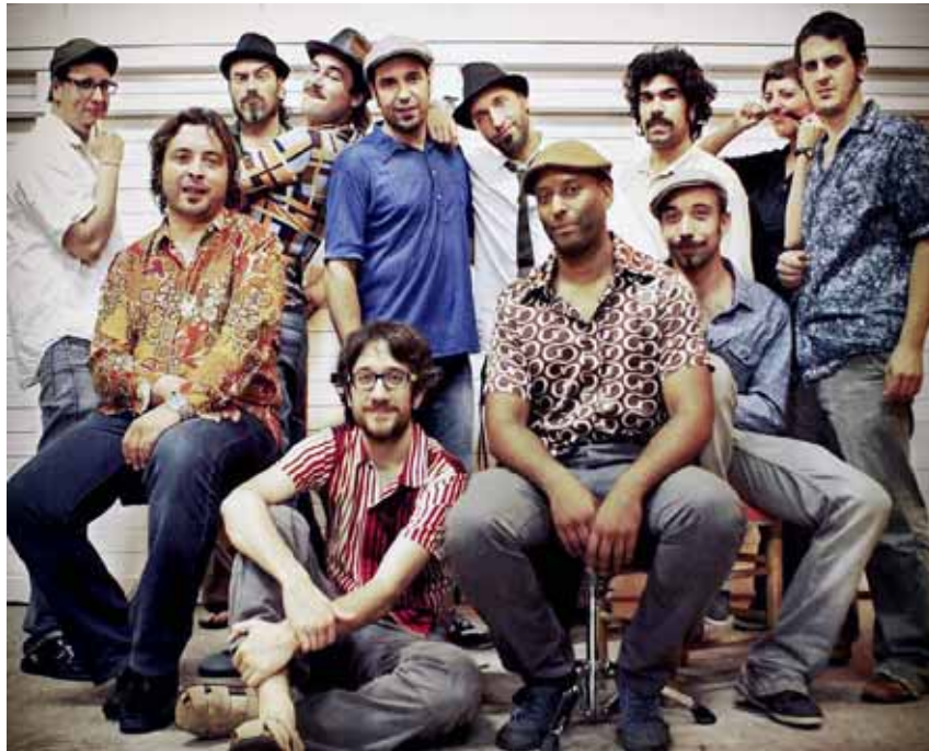
Els integrants d'Electric Gozarella mostraran el seu peculiar estil anomenat booga-punk al concert del dia 20

públic i programats només a festivals o espais més elitistes a tenir un espai únic a la ciutat. El festival no només mostra el vessant musical, sinó també tota la força de la cultura afroamericana i les seves reivindicacions. Enguany es podrà gaudir de la cinquena edició del Say it loud al llarg dels dies 19, 20, 26 i 27 d'octubre a la Farinera del Clot.