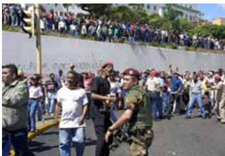
Gent partidària de Chávez als carrers de Caracas durant el cop d'Estat de 2002

L'onze d'abril de 2002, es va produir un cop d'Estat contra Hugo Chávez, orquestrat per militars, l'oposició al govern i una gran quantitat d'empresariats de la classe alta veneçolana. Els mass media privats veneçolans i estrangers van ser participants del complot contra el president. Abans de la insurrecció, els mitjans de comunicació ja estaven generant un ambient propici