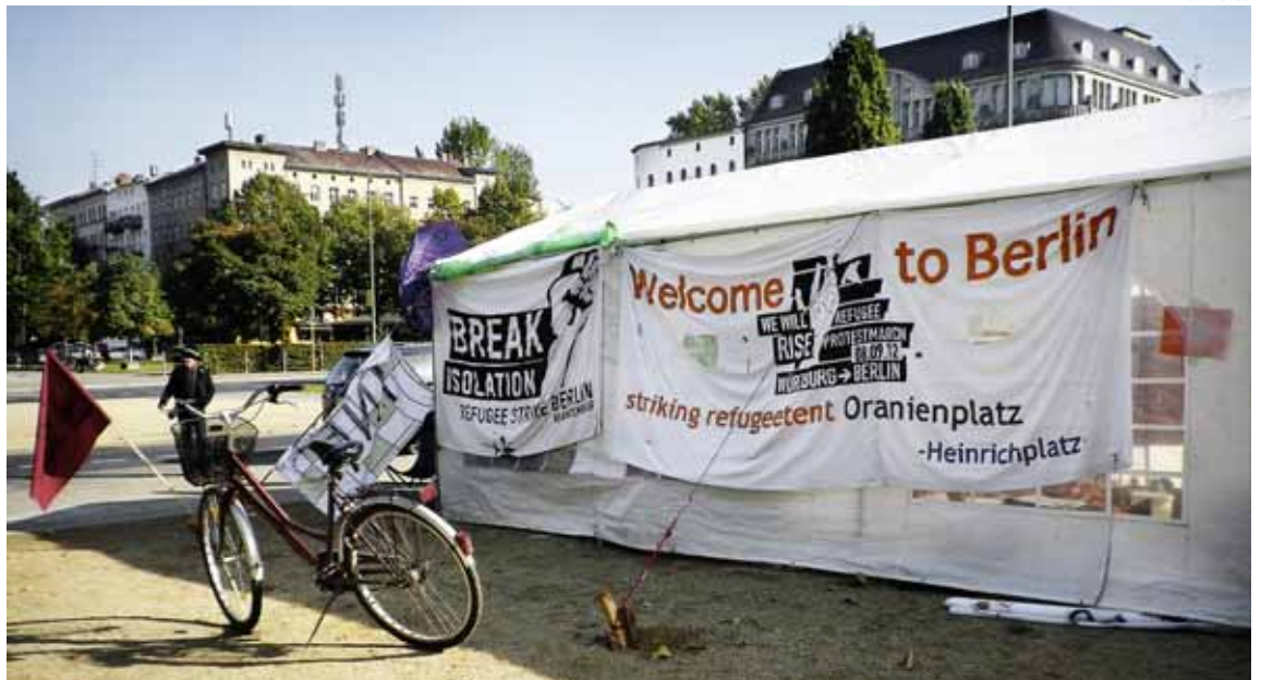
Més de 200 persones procedents de centres de tot Alemanya han acampat a Oranienplatz, al barri berlinès de Kreuzberg