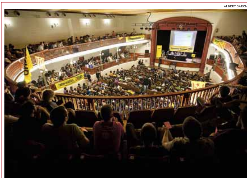
La CUP va decidir presentar-se a les eleccions del 25 de novembre a una assemblea celebrada a Molins de Rei

Però cal no oblidar d'on venim per mesurar amb més prudència aquesta possibilitat de creixement del nombre de votants de CiU. El 28 de novembre de 2010, Artur Mas va