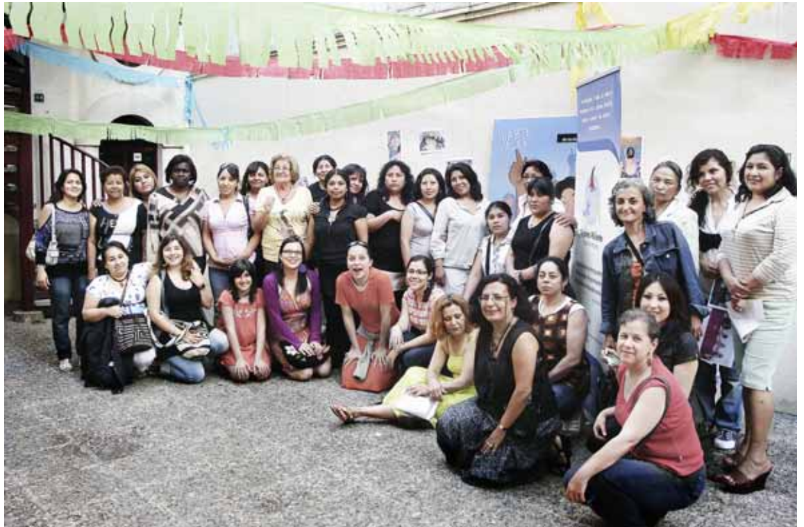
Mujeres Pa'lante ha ajudat moltes dones i ha col·laborat en projectes com la creació de Sindillar, un sindicat per a les treballadores de la llar