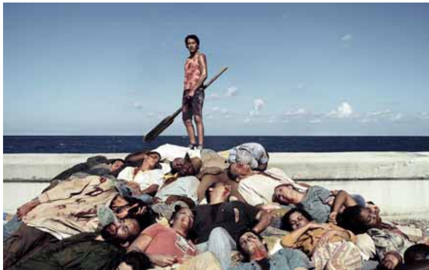
Fotograma de 'Juan de los muertos', una pel·lícula del realitzador Alejandro Brugués

Aquesta coproducció hispanocubana és una comèdia de terror i acció, plena de personatges pintorescos i esquitxada d'escenes paròdiques, que fa un ús abundant d'un humor sexualitzat per acabar d'evidenciar el seu tarannà popular. El realitzador