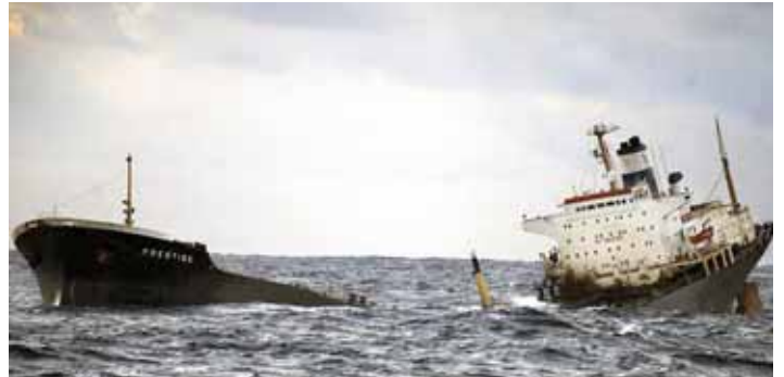
L'enfonsament va provocar una marea negra que va afectar la pràctica totalitat de les rieres gallegues