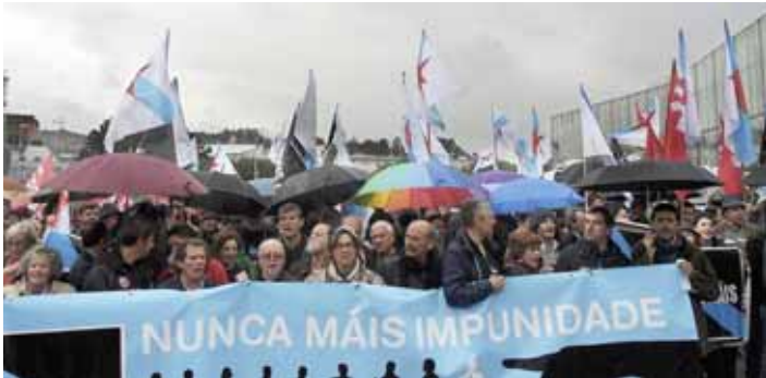
Manifestació de Nunca Más a les portes dels jutjats durant la primera vista oral del judici