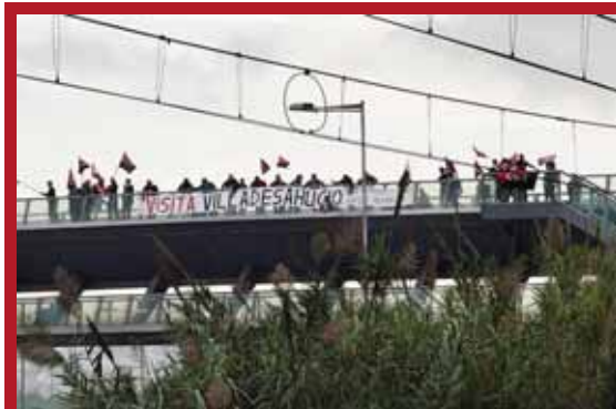
Ciutat Meridiana, el barri amb més desnonaments de l'estat espanyol, va ser una de les parades del recorregut del 'bus combatiu'

espanyoles, després que els populars tombessin les onze esmenes a la totalitat presentades pels diferents grups parlamentaris. El Partit Popular torna a fer gala, així, d'una majoria absoluta parlamentària aconseguida -cal recordar perquè el 31% de les persones amb dret a vot els van entregar el seu sufragi.