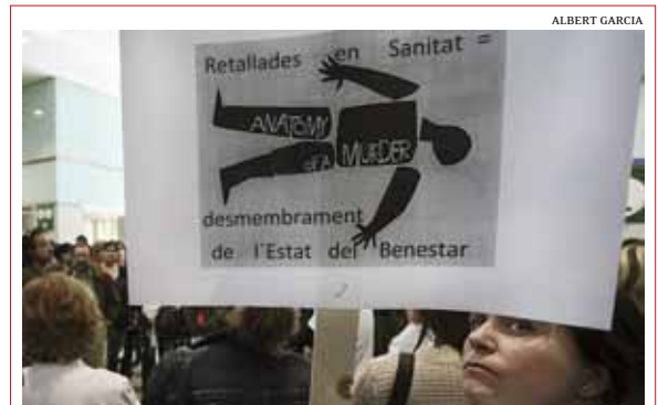
Concentració de treballadores de l'Hospital Clínic en contra de les retallades i a favor de la sanitat pública el 24 de març de 2011