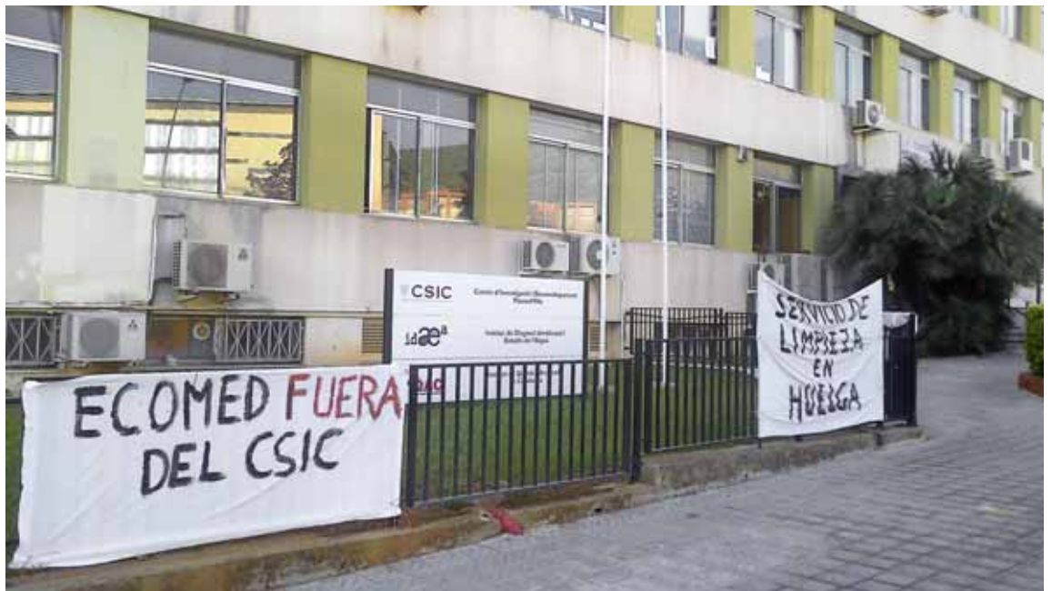
Abans d'iniciar la vaga indefinida, les treballadores ja havien secundat la vaga general del 29 de març i havien fet aturades durant el mes de juny

Després de quatre setmanes de vaga, les treballadores de la neteja de dotze centres del Consell Superior d'Investigacions Científiques (CSIC) han aconseguit que la direcció de l'ens es comprometi a pagar dues de les quatre mensualitats que els deu Ecomed, l'empresa de neteja subcontractada pel CSIC. La vaga, que han secundat prop d'una seixantena de treballadores, va començar l'1 d'octubre i era indefinida, ja que Ecomed encara no havia pagat les mensualitats dels mesos de juliol, agost i setembre, a més de la paga extraordinària d'estiu. Les vaguistes tornaran a la feina el 5 de novembre, després d'haver rebut el suport de la resta de la plantilla dels centres que, en el cas de l'Institut de Ciències del Mar, ha arribat a fer una caixa de resistència i ha donat 1.300 euros a les treballadores, que feia tres mesos que no cobraven.