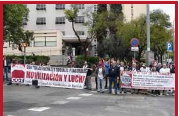
L'itinerari es va aturar al CAP Guineueta del districte de Nou Barris per donar suport a la lluita veïnal contra el tancament del servei d'urgències