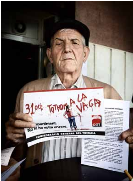
Més d'un centenar de persones de la comarca del Baix Llobregat es van manifestar a Esplugues per protestar contra la crisi i les polítiques d'austeritat el 27 d'octubre

Aquest lloc de trobada de col·lectius de la comarca té els seus orígens a la Xarxa Contra els Tancaments, que va ser força activa al Baix Llobregat entre els anys 2005-2007 i, més tard, es va implicar a la campanya contra la jornada de 65 hores. Des d'aleshores, s'ha anat activant intermitentment per donar resposta a les diferents convocatòries de vagues i lluites que s'han organitzat des de l'inici de la crisi econòmica, com les contrareformes laborals aprovades pels governs de