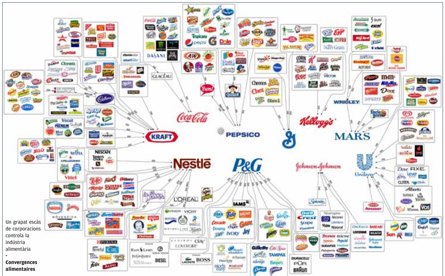
Un grapat escàs de corporacions controla la indústria alimentària - Convergences alimentàries