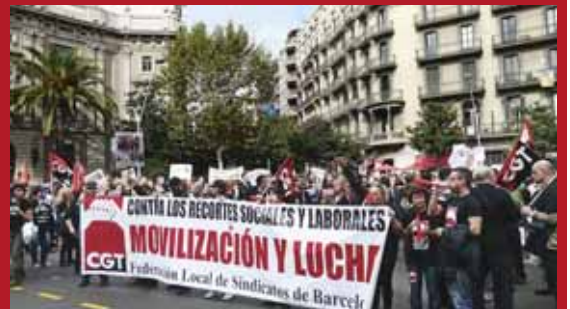
L'autobús es va acostar fins la seu de la delegació del govern a Barcelona per denunciar la responsabilitat de l'administració en la mala gestió de la crisi

Els sindicats CNT, CGT i la Comissió Laboral de Nou Barris van aplegar més d'una cinquantena de persones, el 26 d'octubre, dalt d'un 'bus combatiu' que va recórrer les seves diferents centres de treball -tant d'empreses privades com de l'administració pública- per denunciar conflictes laborals i problemàtiques socials, una acció que va servir per cridar la gent a participar a la jornada de lluita del 31 d'octubre. Alguns dels objectius de les sindicalistes van ser empreses com la farmacèutica Novartis o la informàtica HP, amb litigis oberts amb les seves plantilles, i hospitals com el Clínic o Sant Pau, afectats per les retallades en sanitat. Durant el trajecte, la comitiva també es va aturar a la delegació del govern del carrer Mallorca per protestar contra la gestió de la crisi econòmica i "assenyalar els seus veritables culpables".