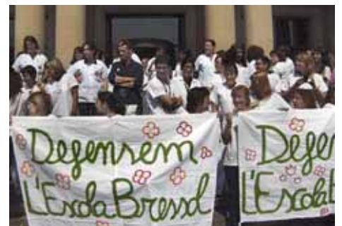
Les afectades s'han agrupat al voltant de la Plataforma Salvem l'Escola Bressol Vall d'Hebron i han dut a terme protestes i concentracions a la seu de la Conselleria de Salut i a la gerència de l'hospital