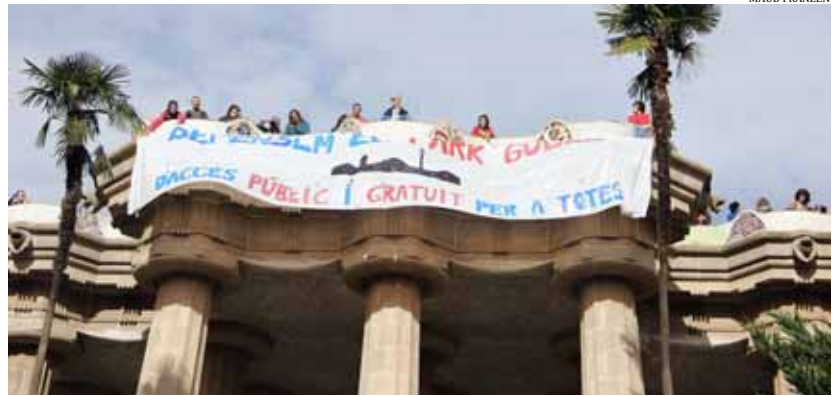
La Plataforma Defensem el Parc Güell es va presentar el 27 d'octubre

I.E. i H.M. redaccio@setmanaridirecta.info