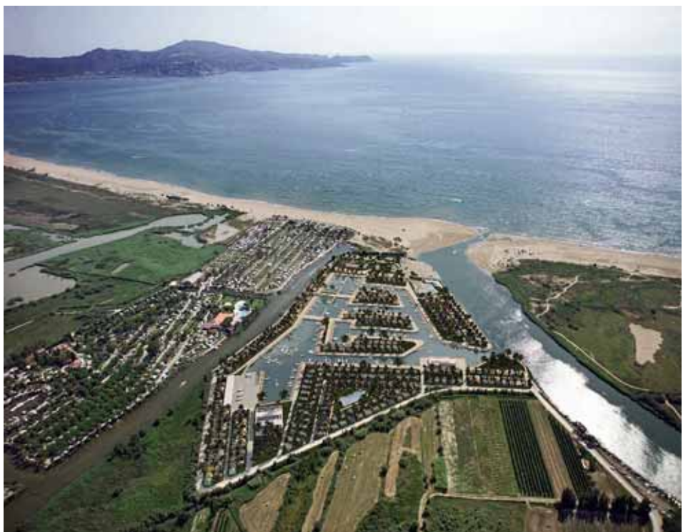
Maqueta del projecte Illa del Fluvià

Contràriament a aquest tipus d'iniciatives, que malmeten ecològicament i socialment el territori, malgrat el maquillatge de l'Aula de Natura que promet el nou port nàutic de l'Illa del Fluvià, caldria potenciar un model turístic diferent, basat en la integració ambiental i social dels agents locals que viuen i treballen al territori i amb més repartiment dels beneficis generats. Espais naturals com els que pretén ocupar l'Illa del Fluvià són molt més adients per promoure un turisme sostenible i de proximitat que ajudi a potenciar les relacions entre la pagesia, les guies, les restauradores i les iniciatives de turisme rural o agroturisme, en què les visitants puguin gaudir del paisatge, dels valors naturals i del contacte amb la gent que hi viu.