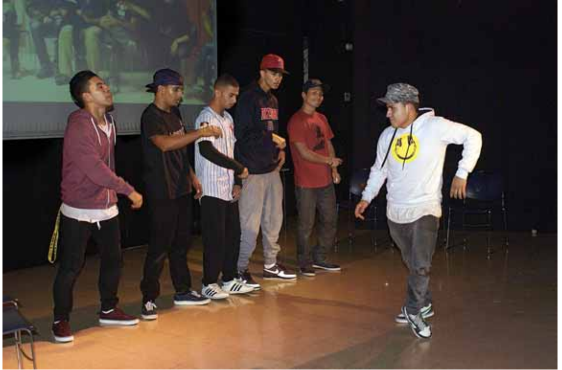
Jornades per a joves del Laboratori Antiracista 2012, a l'Espai Jove Boca Nord d'Horta