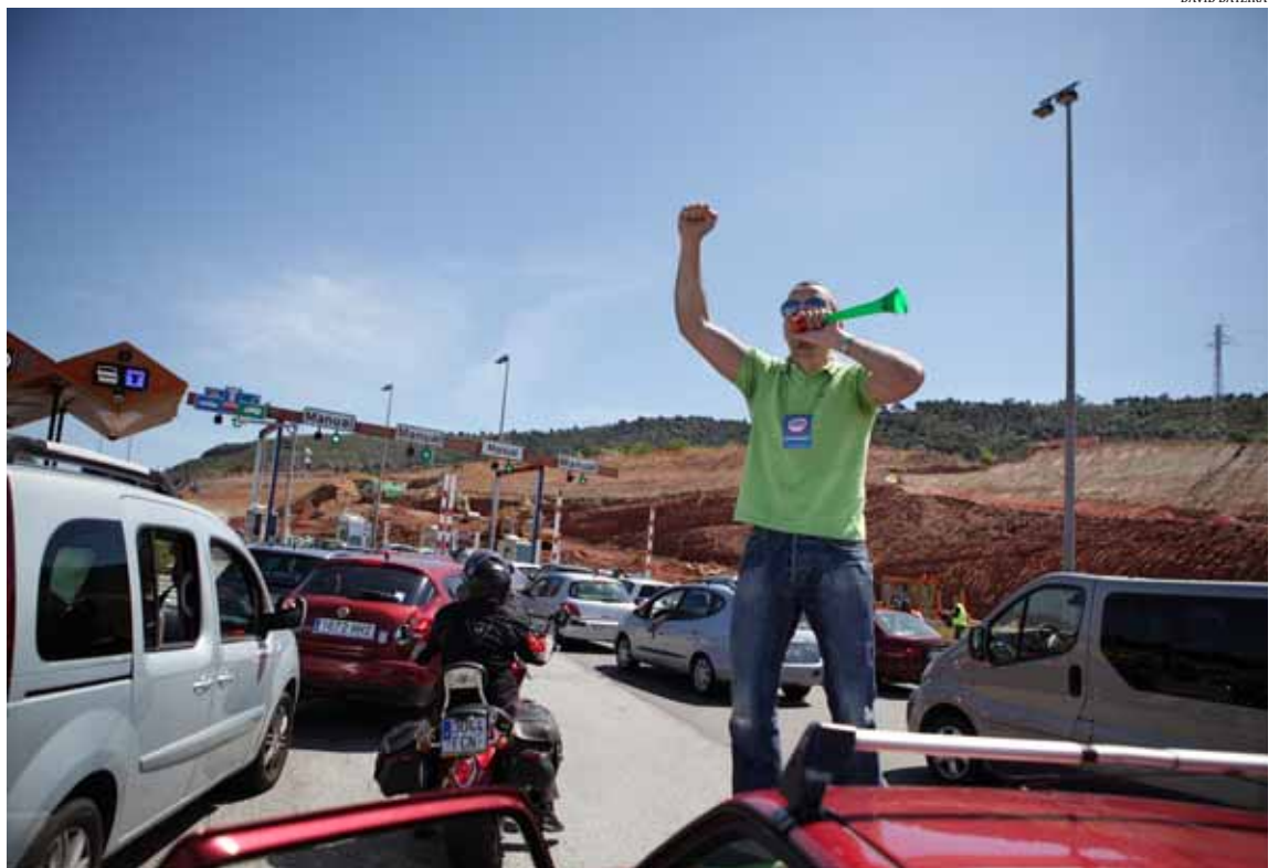
Acció de No vull pagar al peatge de Martorell l'1 de maig d'enguany