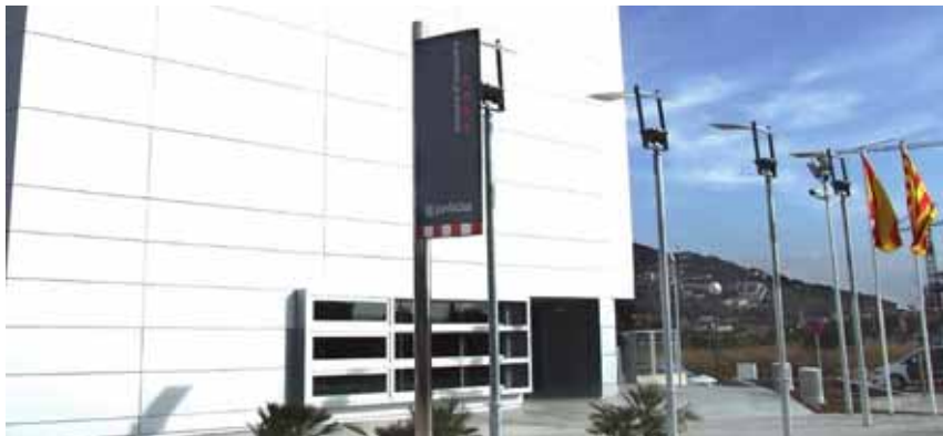
La comissaria dels Mossos d'Esquadra de Sitges

Manu Simarro redaccio@setmanaridirecta.info