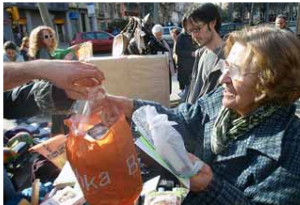
Xarxantoni impulsa el Trocantoni, una xarxa d'intercanvi de coneixements, béns i serveis del barri de Sant Antoni - SDA.cat

L'any 2001, fruit d'un procés participatiu per potenciar la xarxa social i la solidaritat al barri de Sant Antoni de Barcelona, va néixer Xarxantoni, una xarxa que genera espais de participació i cooperació entre l'administració