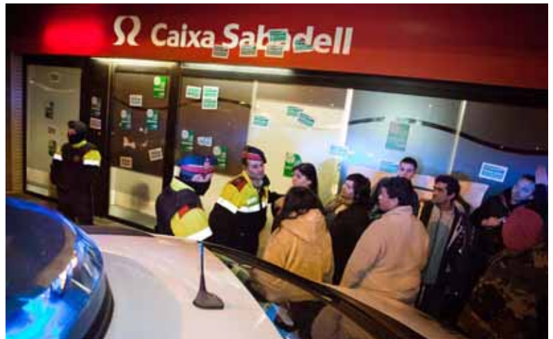
El veïnat de Torre Romeu es va aplegar davant de l'oficina ocupada i va cridar consignes contra la presència de la policia

Aquest barri, situat a l'altra banda del riu Ripoll, va ser construït, en gran part, durant la dècada dels cinquanta per les mateixes persones que hi residien, arribades de diversos indrets de la península Ibèrica. La primera línia d'autobús amb Sabadell no es va inaugurar fins l'any 1964 i el clavegueram no es va construir fins el 1969. L'oblit institucional va portar