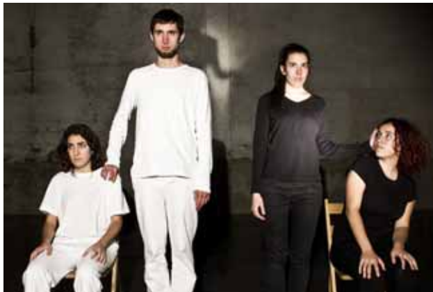
'Fisura' posa el focus d'atenció en l'educació i en com s'utilitza per fomentar la segregació i el conflicte / MIRIAM CERZO

l'educació i sobre el seu ús indegut per anul·lar la identitat, fomentar la segregació i estimular el conflicte". I com es trasllada aquesta idea a l'acció creativa? En aquest cas, dues nenes apareixen a l'escenari i es posen a dibuixar alegrement a terra amb un guix blanc i un carbonet. En un determinat moment, s'intercanvien els trossos i continuen amb la seva activitat. Però això que per a elles és un joc innocent fa enfurismar els educadors dels seus bàndols respectius, que entren en escena i les separen. Les nenes, espantades, s'amaguen el regal de la companyia a la butxaca dels pantalons abans de començar un dur procés d'educació. L'objectiu és clar: que assumeixin les ideologies respectives i rebutgin les de l'enemiga. El blanc i el negre no es poden entendre, s'han d'enfrontar. ◀