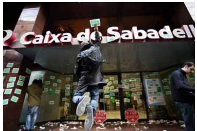
L'endemà del desallotjament de Sabadell es va fer una concentració de suport a la central d'Unnim de Barcelona

el veïnat a dotar-se d'eines per a la integració i la millora de les seves condicions de vida. Amb la fi de la dictadura franquista, les reivindicacions polítiques i socials d'aquest barri obrer van aconseguir arrencar a les institucions alguns serveis socials i mesures assistencials, sobretot en matèria d'habitatge social, que van esdevenir claus en l'assoliment de certes quotes de benestar. Aquesta història ha fet que el teixit social i l'organització veïnal esdevinguessin clau en la convivència i l'evolució d'un barri que, en moltes ocasions, ha vist com se l'estigmatitzava negativament associant-lo amb la delinqüència i la inseguretat.