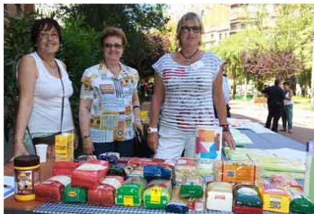
Recapte d'aliments al barri de Sant Antoni organitzat per De veí a veí, el juny de 2012 - Rafael Martínez

Durant els darrers anys, el desenvolupament d'iniciatives com els bancs del temps, les xarxes d'intercanvi o les cooperatives de consum agroecològic han catalitzat unes noves dinàmiques