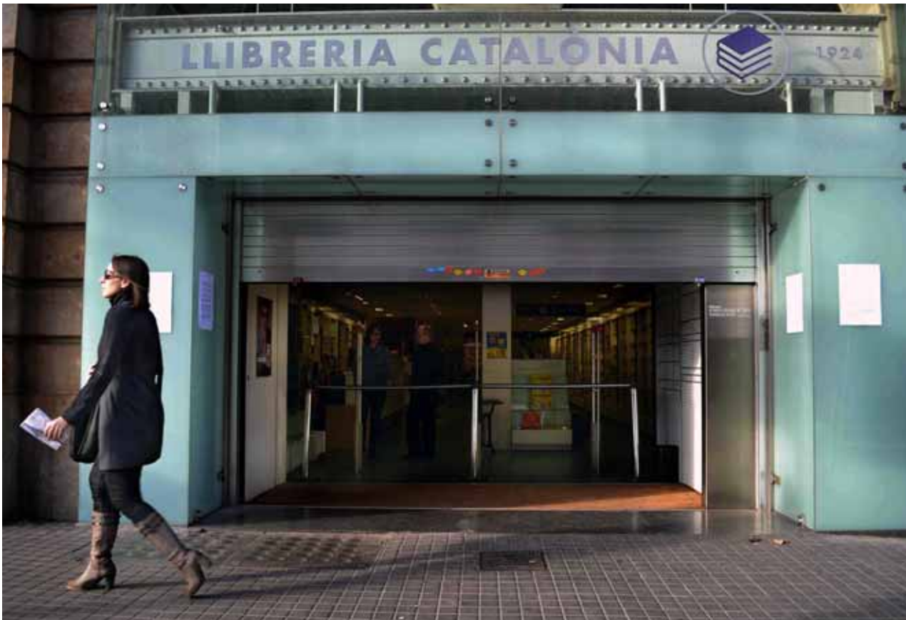
La davallada de les vendes ha provocat el tancament de la llibreria Catalònia

Amb la clausura recent de les llibreries Catalònia, Proa Espais i Robafaves, s'accelera el degoteig d'establiments compromesos amb la llengua i la cultura catalanes que han abaixat la persiana els últims anys. La pressió immobiliària i la crisi en el sector del llibre agreugen un fenomen que, a més de perjudicar el petit comerç, afebleix la difusió de la producció editorial en català als Països Catalans.