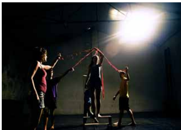
L'obra 'Eco' s'endinsa en els conceptes de lideratge, tirania i poder i en com afecten la vida en comunitat