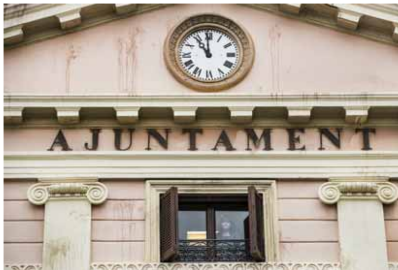
Façana de l'ajuntament de Sabadell