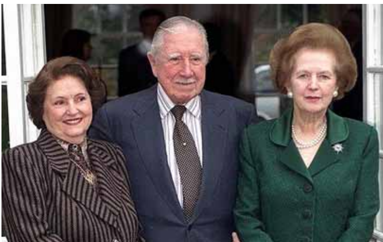
Margaret Thatcher va voler deixar clar el seu suport a Pinochet mentre estava detingut a Londres

Per mantenir la confidencialitat de les relacions comercials entre ambdós estats, es van fer reunions secretes entre membres i diplomàtics de les dues administracions. El general Fernando Matthei (membre de la Junta Militar xilena i enca-