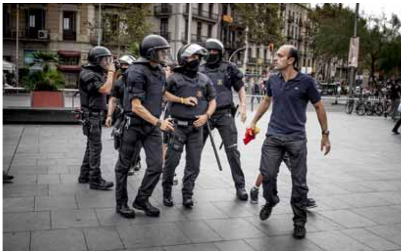
La Unitat 4 va actuar a la plaça Universitat de Barcelona contra una concentració d'antifeixistes el 12 d'octubre d'enguany

El 25 de febrer es va fer un pas més per tancar el cercle al voltant de l'autor material i els encobridors o cooperadors necessaris. Tres antidisturbis -dos homes i una dona- de la furgoneta E-40 van declarar com a testimonis i, per tant, amb l'obligació de dir la veritat, però van reiterar que no s'havien llançat bales de goma. Diverses preguntes van quedar sense resposta: com es controlen les bales de goma que pugen a una furgoneta de la Brigada Mòbil a l'inici d'un operatiu? Qui i com es fa el recompte de projectils quan es torna a la base? El so d'una salva i d'un tret amb bala de goma són idèntics? ◀