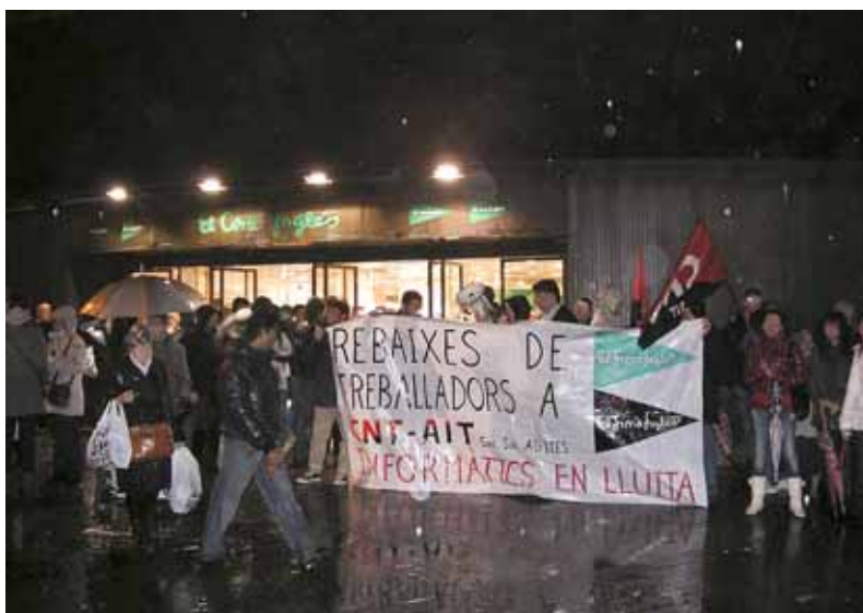
Concentració contra els acomiadaments de treballadores a El Corte Inglés l'any 2011

Les retallades a les condicions de les empleades d'El Corte Inglés van començar l'any 2007, tot i que l'empresa continua guanyant diners a cabassos. Les treballadores també són víctimes de la inoperància dels dos sindicats majoritaris a la cadena, que actuen al servei de la direcció d'una empresa que acumula condemnes per discriminació sindical i de gènere