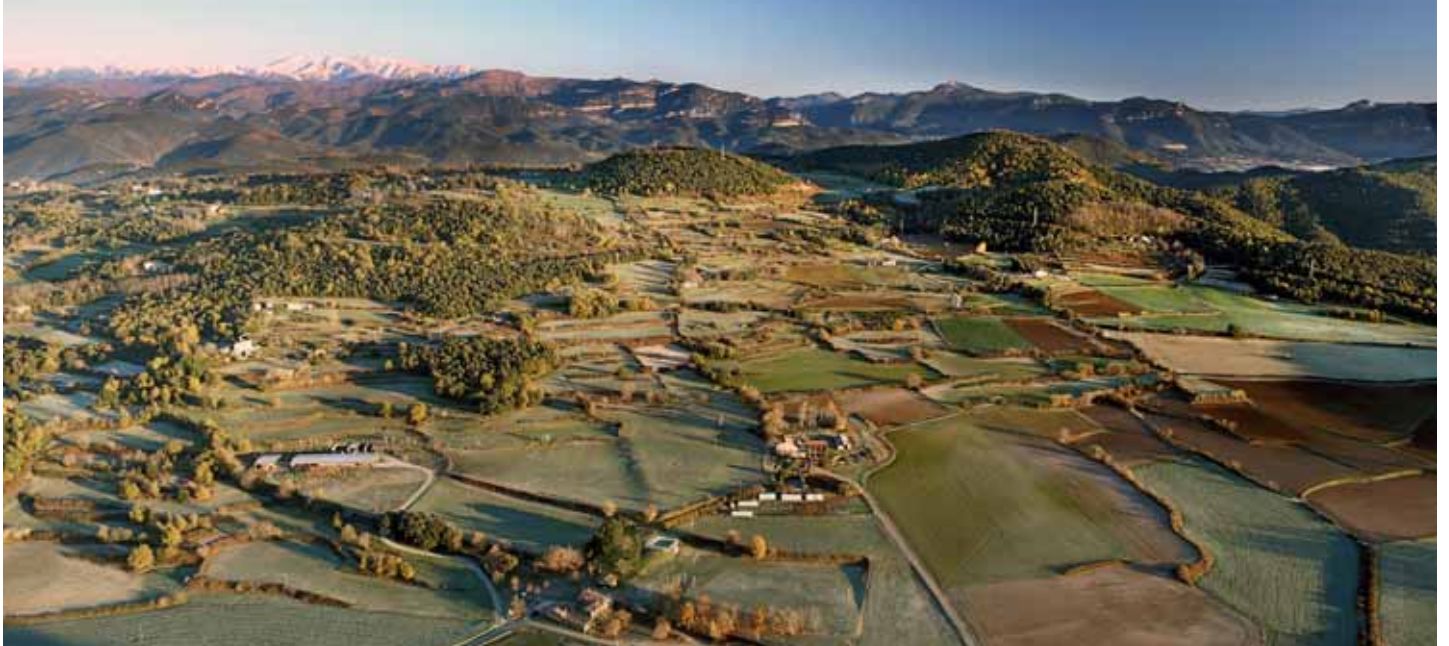
Vistes de Batet de la Serra, Pirineus i camps propers a la reserva natural del volcà Croscat - Marc Planagumà

- natura més o menys intacta de la qual poder gaudir. Un espai d'aquest tipus té un valor incalculable. No és, o no hauria de ser, un recurs per fer diners. No oblidem que és un bé públic, el seu valor total va molt més enllà de l'econòmic, té un valor natural extraordinari per si sol, però també té un valor social i cultural i, fins i tot, emocional o sentimental. És una font de salut física i mental per als seus visitants i residents. Tot això és el que es volia