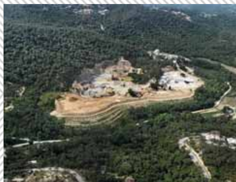
Vista aèria de la pedrera de Vilanova del Vallès

La principal irregularitat i cavall de batalla del veïnat afectat, però, té relació amb l'estat d'il·legalitat en què es troba l'enclavament, ubicat en plena serralada Litoral. L'article 224 de la normativa municipal, aprovada l'any 1994, prohibeix explícitament l'activitat extractiva en qualsevol tipus de sòl en un radi inferior a un quilòmetre de població i d'edificació. Avui, hi ha fins a vuit indrets situats a menys d'un quilòmetre de la pedrera: Les Roquetes, Can Bosc, Can Ruscalleda, el barri Rodes, Ca l'Alegre, les granges de Sèlles, Can Galvany i Can Patxito. L'assumpte ja va ser objecte de polèmica el 1998, quan la Generalitat va emetre un informe desfavorable per a la legalització de la pedrera, i el novembre de 2008, deu anys després, quan la Comissió d'Urbanisme de Barcelona es va pronunciar en els mateixos termes. Unitat per Vilanova, el partit d'Oriol Safont que té majoria al consistori, ja ha aconseguit fer les