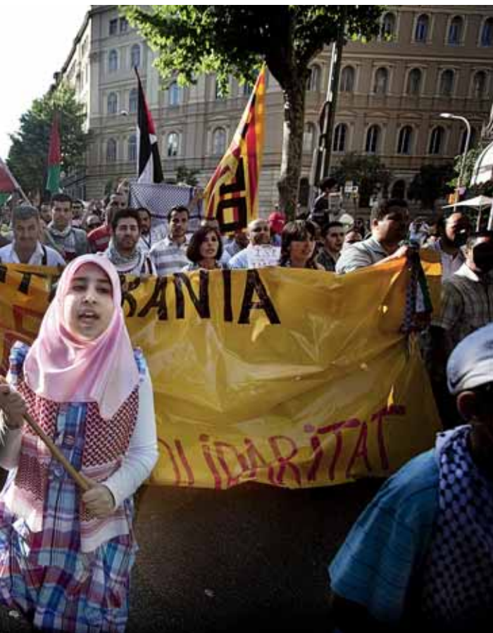
Manifestació en protesta per l'atac israelià a la Flotilla de la Llibertat i contra el bloqueig de Gaza a Barcelona l'any 2010