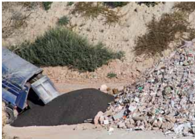
Una excavadora cobreix de terra un abocament irregular d'escòria procedent de la incineradora de Mataró