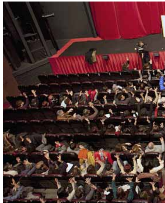
Assemblea de la Marea Roja al Teatre Victòria de Barcelona l'11 de febrer

En aquest sentit, com que un dels punts que uneixen la Marea Roja és la lluita contra l'augment de l'IVA, durant la primera assemblea, una gent del Teatre de Bescanó va exposar la iniciativa per fer front a aquest 21% d'IVA, una proposta que ha fet la volta al món i que, a part de Bescanó, ja s'ha fet a altres llocs com Saragossa i es preveu que es faci a Figueres. El director del Teatre de Bescanó, Quim Marcé, assegura que, davant d'aquest augment de l'IVA, van tenir clar que calia fer algun tipus de reivindicació. D'aquí, la idea de vendre quelcom amb