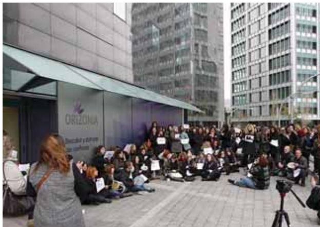
La plantilla d'Orizonia de Barcelona es va concentrar davant la seu de l'empresa i va tallar la Gran Via a l'alçada de la plaça Europa el 18 de febrer

Amb l'arribada de la crisi l'any 2008, la facturació va començar a caure i Carlyle va començar a posar en dubte la visió expansionista de Subies. L'executiu va abandonar l'empresa l'any 2010, després