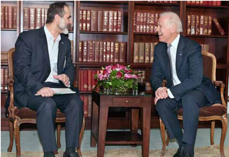
Reunió entre el vicepresident dels Estats Units Joe Biden i el líder del Consell Nacional Siríà Moaz al-Khatib el 5 de febrer

que inclogui exigències. “No és acceptable dir que vols dialogar i, alhora, imposar condicions”, explica Alain Gresh en una conversa telefònica. L'única manera d'aturar la violència és fer els passos per establir “una transició política que condueixi a unes eleccions lliures i democràtiques”. Gresh, periodista nascut a Egipte i resident a París, diu que ambdues parts hauran de cedir si realment volen aturar una violència que ja ha arribat al cor de Damasc.