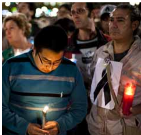
Concentració a la plaça Catalunya de Barcelona pel suïcidí d'un home desnonat a Granada l'octubre de 2012 / LINO DE VALIER