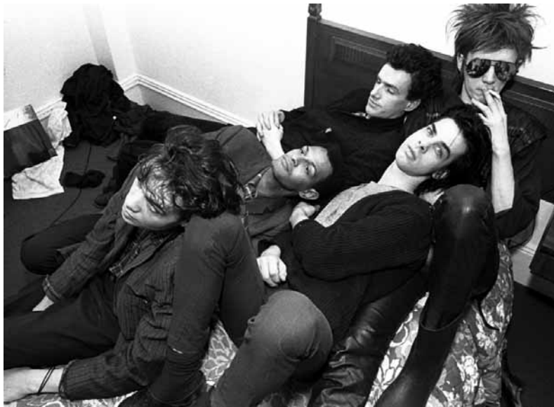
Mick Harvey, Blixa Bargeld, Barry Adamson, Hugo Race i Nick Cave en els seus inicis

A l'esmentada, la segueixen cançons com "Papa Won't Leave You, Henry", "The Mercy Seat" o "The Weeping Song", retrats de personatges turmentats i erràtics, víctimes i botxins; però també arriba el torn de "The Ship Song" o "Into My Arms", celebracions a l'amor redemptor, tot plegat vestit amb guitarres elèctriques i acústiques, percussions de tota mena, violins, orgues i pianos, del crit agònic al xiuxiueig més íntim.