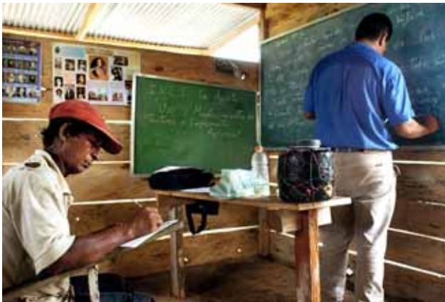
Classes a la cooperativa camperola berberé a l'Estat de Mèrida

del PIB veneçolà prové dels impostos, per sobre dels ingressos obtinguts del petroli, que representen el 18%