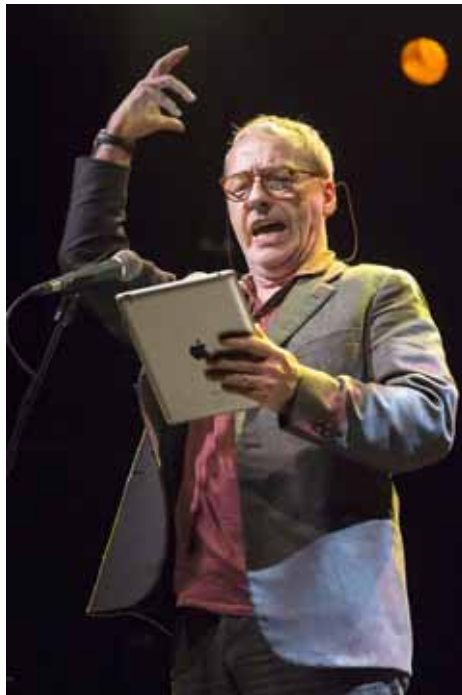
Actuació de David Riondino a la sala Luz de gas el 7 de març

Artista polièdric incansable, David Riondino va ser a Barcelona, el 7 de març, per oferir un concert en l'àmbit del festival de cançó d'autor Cose Di Amilcare i del Festival BarnaSants. Nascut a Florència el 1952, Riondino ha gravat una desena d'àlbums com a cantautor i ha treballat al cinema com a actor (amb directors com els germans Taviani, Marco Tullio Giordana i Gabriele Salvatores), com a director ( Cuba Libre - Velocipedi ai Tropicci i el documental Shakespeare in Havana ) i com a guionista. En l'àmbit del teatre, ha interpretat una dotzena d'obres i ha compartit escenari amb Paolo Rossi, Sabina Guzzanti i Dario Vergassola, per exemple. És un autor molt brillant d'improvisacions poètiques –sobretot en vuitena rima i en dècimes–, també signa a revistes satíriques històriques com Tango i Cuore i ha publicat set llibres. Precisament, l'últim es va presentar el 6 de març a la llibreria italiana Le Nuvole, a la vil·la de Gràcia (Barcelona). Es tracta de Il trombettiere , la història de Giovanni Martini –trompetista i aventurer d'altres temps– amb Garibaldi i Custer, entre Itàlia, l'Havana i Nova York. Una obra en dècimes acompanyades de les il·lustracions d'un mestre del còmic com Milo Manara. Riondino és un observador atent de la realitat italiana, per això, a part de parlar de la seva obra, hem volgut parlar de la situació peculiar que viu el país transalpi després de les darreres eleccions polítiques i del fenomen Grillo.