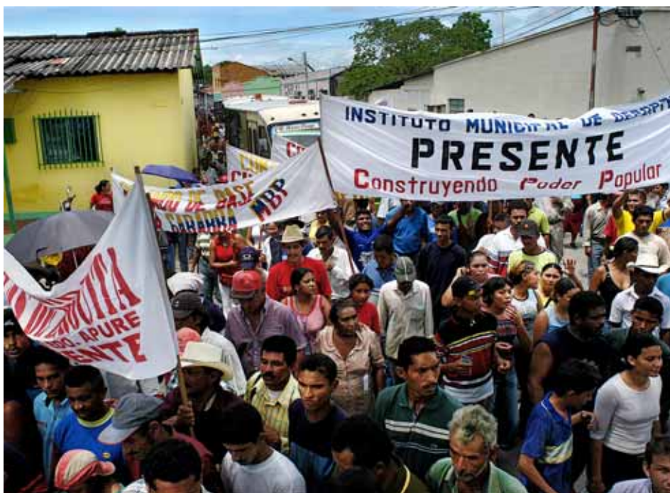
La participació política s'ha articulada a través dels 'consejos comunales', una forma d'organització emparada per la Constitució / ORIOL CLAVERA

repetidores ha passat d'un 9,88% a un 3,52% i l'absentisme escolar s'ha reduït un 60%. Pel que fa a l'educació secundària, la inscripció escolar ha passat del 48% al 73% i les repetidores s'han reduït d'un 10% a un 3%. Cal destacar que el 98% de l'alumnat que ha acabat els estudis primaris ha passat a estudiar a l'educació secundària i no ha abandonat els estudis. Finalment, en l'educació terciària, s'ha passat d'un 28% d'alumnes esco-