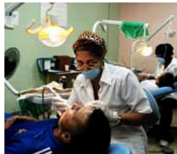
*Misió* sanitària al barri 23 de Enero de Caracas

Les relacions entre Veneçuela i el món han canviat des que Hugo Chávez va arribar a la presidència. De ser un país aliat de les potències occidentals, ha passat a ser un dels representats de "l'eix antiimperialista" contrari a la política dels Estats Units. En clau regional, això ha servit per teixir aliances entre diversos països llatinoamericans. En l'àmbit mundial, Veneçuela s'ha obert al comerç amb potències com la Xina o Rússia i ha mantingut relacions amb països com l'Iran, l'Aràbia Saudita, Síria o Líbia basant la seva política més en la realpolitik que en la semblança ideològica. Això ha provocat alguns conflictes en relació amb la primavera àrab i el suport estratègic que ha donat a algunes dictadures. Com un dels membres líders de l'Organització de Països Exportadors de Petroli (OPEP), Veneçuela ha ampliat els tractats de comerç entre estats, inclosos els EUA, malgrat la retòrica de confrontació entre ambdós governs. Els afers i el comerç exteriors han estat un dels apartats on el govern veneçolà s'ha comportat de manera més pragmàtica.