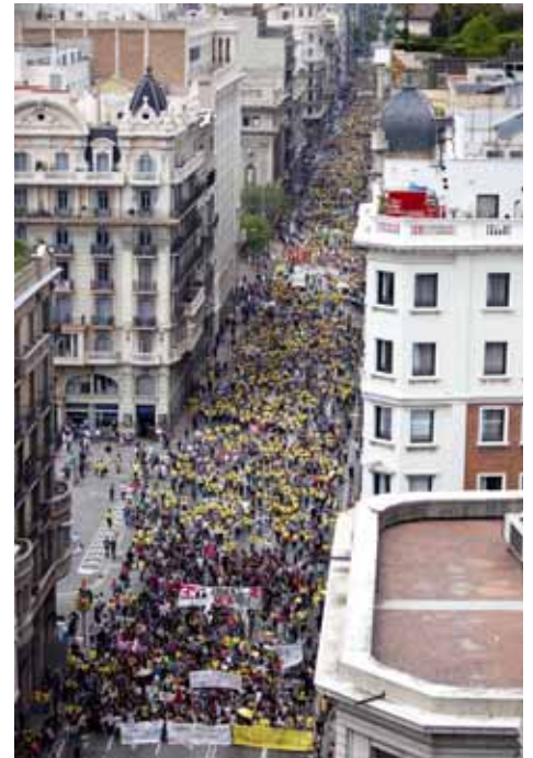
Les crítiques a la llei Wert van sovintejar durant la jornada de vaga del 9 de juny