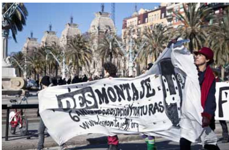
Les campanyes de suport als encausats s'han succeït durant els darrers set anys

La majoria de preguntes clau que tothom s'ha fet en relació al cas 4F que-