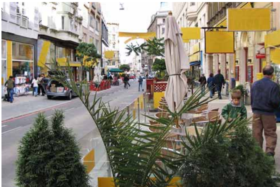
El projecte Delete! Delettering the Public Space, l'any 2005 a Viena

L'ús d'elements publicitaris provoca estrès a l'individu, genera mals de cap i causa distraccions i accidents de trànsit