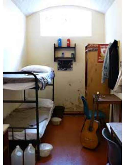
Una cel·la de la presó de Crumlin Road Gaol

persones ferides, a més de lluitar greument l'economia de la zona. Als murals de Falls Road o Shankill, els homes armats amb passamuntanyes són substituïts, lentament, per imatges en record de les víctimes o missatges de reconciliació. Però Irlanda del Nord (o el Nord d'Irlanda) s'enfronta a nous reptes: la negativa dels grups dissidents a reconèixer els acords, la integració de les persones preses o la possibilitat d'un referèndum que posi fi a la partició política de l'illa. ◀