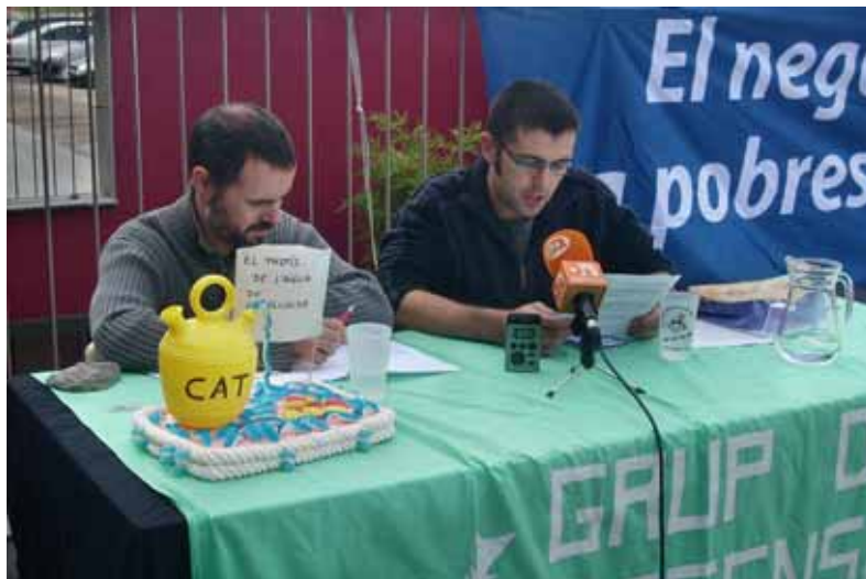
Membres de la plataforma Aigua és Vida denuncien els processos de mercantilització de l'aigua en un acte a Vic el mes d'octubre de 2012

D'altra banda i no menys important, una empresa pública –l'Agència Catalana de l'Aigua– sembla que vol posar seny i acabar amb la situació irregular d'Agbar. Ha iniciat un procés per recuperar unes antigues concessions d'aigua que ja no són d'Agbar pels canvis substancials que hi ha hagut al llarg de més de cinquanta anys. Unes concessions caduques que la Generalitat ha de recuperar perquè suposen una pèrdua de béns de la Generalitat. Algú entendria que, allunyats de la cerca de l'interès general, la Generalitat regalés els seus béns, impossibilités la recuperació del riu Ter des d'Ulldeter a Torroella de Montgrí i subministrés aigua per beure de més mala qualitat a gairebé cinc milions de persones? Estic segur que no ho permetran. L'aigua, la necessitem per viure. Com l'aire que respirem, és de tots i de ningú. ◀