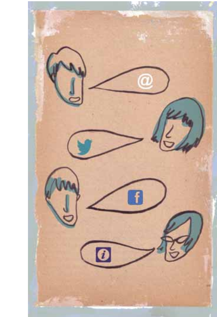
IL·LUSTRACIÓ: Zulema Galeano

Ho saben molt bé a Contrapunt, pioners del cooperativisme actual a la premsa catalana. "Vam començar creant un diari, però, al darrer, hi hem hagut de fer una empresa", narra un dels cinc socis que, el 2001, van fundar aquest mitjà a Mollet del Vallès. Actualment, després de retallar-ne dos, la cooperativa sosté vuit llocs de treball. Distribueix 10.500 exemplars del setmanari Contra-