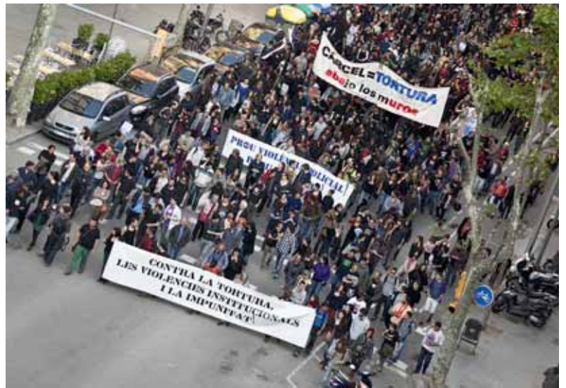
Manifestació contra les tortures i les presons a Barcelona el 4 de maig - Robert Bonet

La metodologia de la UTE de Villabona, que va començar amb quinze persones i avui n'acull més de 500, radica en la transformació dels dos col·lectius més importants de la presó: les internes i el funcionari de vigilància. En aquests mòduls terapèutics, les vigilants tenen un paper educatiu i són corresponsables, juntament amb les persones internes, de la gestió de les tasques. Les recluses, que inicien la jornada a les set del matí, participen en tallers d'activitats manuals, musicals o esportives i també en la gestió de la neteja i del dia a dia. "L'objectiu prioritari de les UTE és crear un espai lliure de drogues i sense violència, on els interns assumeixin una sèrie de respon-