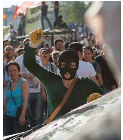
Les manifestants van trencar un cotxe de la policia de trànsit