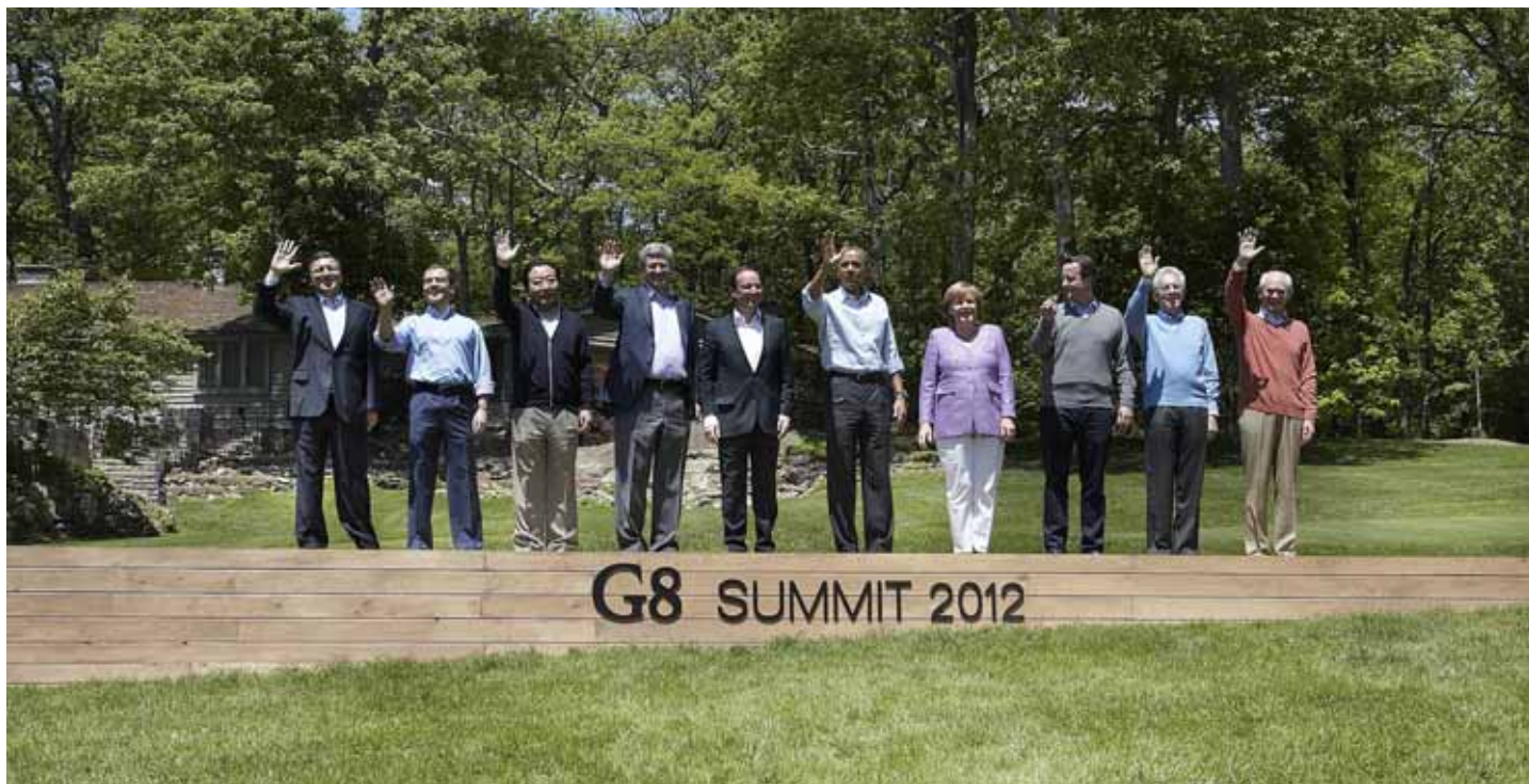
Foto de família de la cimera del G-8 de l'any 2012

Un complex de luxe aïllat i de difícil accés situat al nord d'Irlanda acull, el 17 i 18 de juny, la cimera anual del G-8, amb l'objectiu d'aprofundir la globalització econòmica neoliberal. La trobada va acompanyada d'un desplegament policial immens, que suposa un enorme cost per a les arques públiques en un moment en què les ajudes estatals a les classes desfavorides pateixen retallades. Com en edicions anteriors, nombrosos col·lectius preparen mobilitzacions de rebuig contra un certamen que, anualment, acumula casos de repressió.