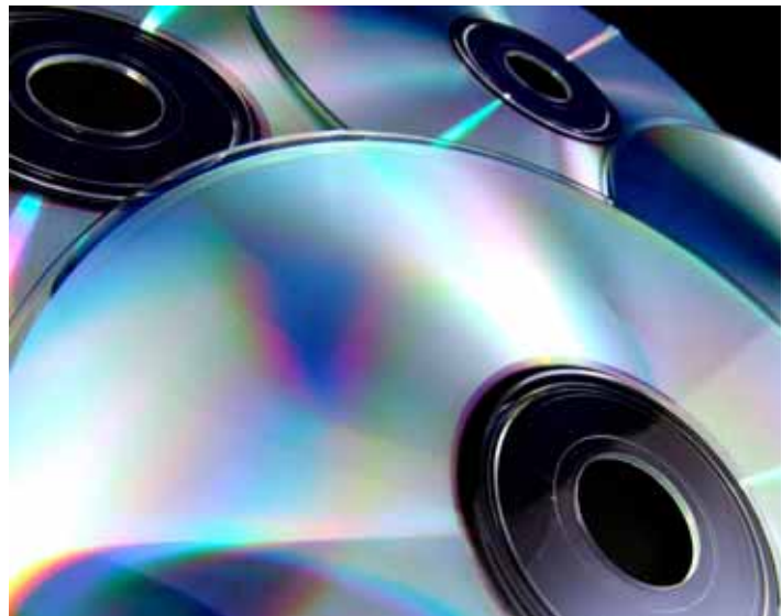
El bisfenol és una substància química present en el plàstic policarbonat / HST

les pintures també en contenen. Un gran nombre d'estudis han mostrat que part del BPA passa a les begudes i els aliments que està aïllant i que la proporció és molt més gran quan el recipient s'escalfa. Entre les altres vies d'accés al nostre or-