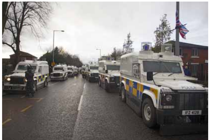
La policia nord-irlandesa dirigirà l'operatiu que es desplegarà durant la cimera