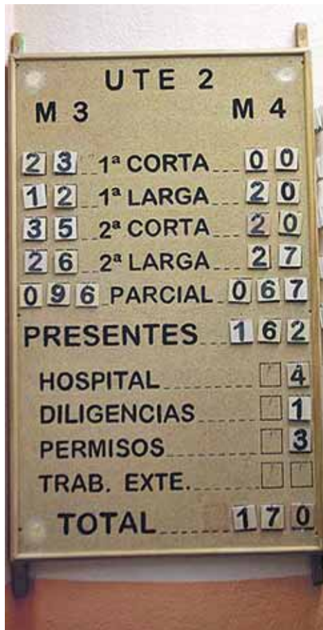
Les preses de les UTE han de seguir unes normes de conducta estrictes