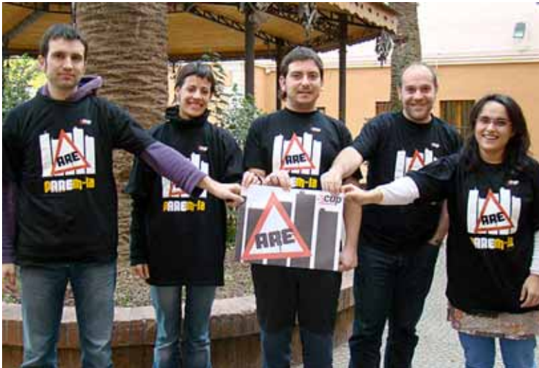
Roda de premsa de la CUP per presentar la campanya de recursos contra tots els plans directors de les ARE a Valls el 2009

La mobilització contra les ARE va arribar amb força a municipis com Vilanova i la Geltrú o, també, Sant Celoni, on el 2009 la CUP va aconseguir aprovar i guanyar un referèndum municipal vinculant. Un altre cas especial ha estat la lluita de la Plataforma Valls Viu i l'oposició al Pla Director Urbanístic del Camp, que articulat al voltant del contenciós administratiu que hi va interposar la CUP, va aplegar catorze entitats: l'Associació de Veïns de Sant Salvador i Sant Ramon; la Campanya Reus Viu; les organitzacions juvenils, col·lectius i casals de l'Esquerra Independentista del Camp; les CUP de Reus, Tarragona, Valls i el Vendrell; la candidatura Gent del Poble de Montblanc; el col·lectiu ecologista La Canonja; la Plataforma en defensa del Patrimoni Natural del Priorat; la Plataforma Valls Viu i el sindicat Unió de Pagesos.