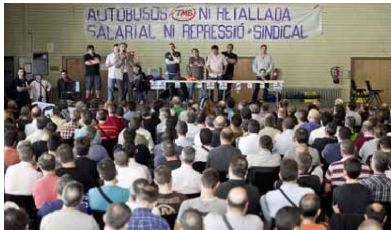
Assemblea de treballadores de busos de TMB a les Cotxeres de Sants l'1 d'octubre de 2012

D'altra banda, el mes de maig, TMB ha posat en circulació tres autobusos híbrids i biarticulats que s'han adquirit per 800.000 euros cadascun, tot i que la flota d'autobusos ja comptava amb 1.072 vehicles que cobreixen amb escreix el servei ofert a l'Àrea Metropolitana. ◀