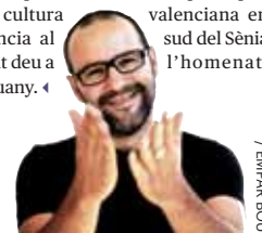
/ EMPAR BOU

Escoltar Bertomeu és copsar la vitalitat i la vigència d'un parlar i d'una manera de veure el món que, lluny de morir amb aquells que ja musicaren l'Estellés, continua i continuarà ben viva entre la quitxalla que corria per un auditori petit però fidel als seus principis, com la cultura valenciana en resistència al sud del Sènia que tant deu a l'homenatge enguany. ◀