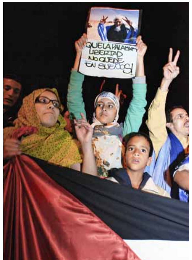
Protestes davant el consolat del Marroc de Barcelona després de l'assalt al campament sahrauí d'Al-Aaiun el novembre de 2010

El 1976, el govern marroquí va entrar al Sàhara amb sang, napalm i foc. Desenes de milers de refugiades van fugir a Algèria. Una guerra de més de quinze anys va enfrontar el Polisario (que tenia el suport d'Algèria) i el Marroc (amb el suport dels Estats Units). El 1991, al final de la guerra freda, el