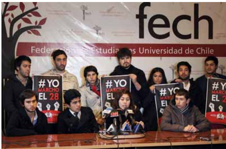
Roda de premsa per convocar la vaga del 28 de maig d'enguany