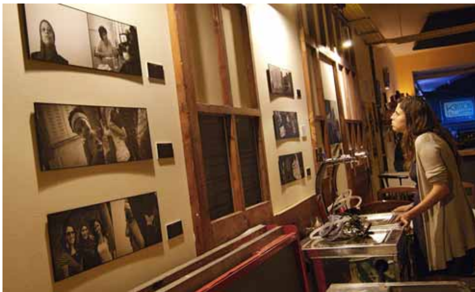
L'exposició es pot veure al Koitton Club fins el 7 de juliol