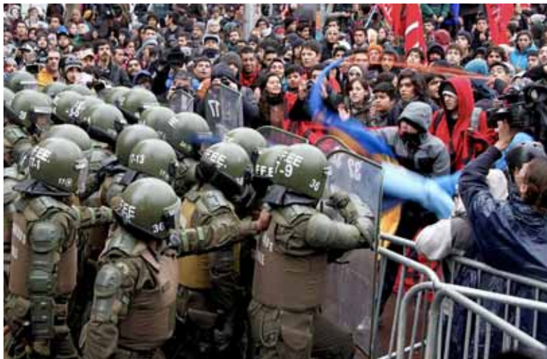
Manifestació de l'estudiantat de secundària a Santiago el 28 de maig

és l'any que "les universitats privades esclaten a causa d'un sistema basat en el lucre", assegura Moreau.