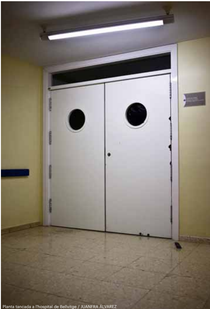
Planta tancada a l'hospital de Bellvitge

L'empresa Capio va facturar 127 milions d'euros al CatSalut, el doble que el 2010