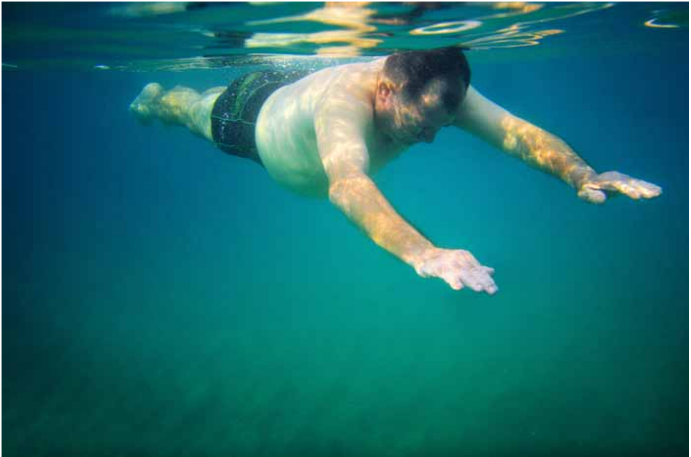
FOTOGRAFIA: Eva Parey

E ntrar lentament al mar. No tenir fred. No tenir calor. No tenir ni fred ni calor. Pensar. Pensar en tot allò que no voldries pensar. En tot allò que no hauries de pensar però penses. Constantment. Pensar que no hauries de pensar tant, que no hauries de pensar més. Obrir els ulls. Obrir els ulls i tancarlos. Autòmat. Barcassa de somnis infantils, una taronja, l'horitzó blanc... Fer-te el mort. Estar mort. No saber si estàs viu ni mort. Si et fas el viu o el mort. Si vius en una terra morta o la mort és el contrast que et manté viu en aquesta terra heretada. En aquesta terra que és tan terra teva com qualsevol altra. Mirar com la bellesa i la malura juguen a daus. Deixar-te endur. Cercar l'equilibri entre l'instint i la voluntat. Trobar a faltar l'aire. Adonar-te que trobes a faltar tantes coses que són absolutament necessàries com l'aire. Creure que pots prescindir de tot, de totes les coses, de tu. Creure que pots prescindir de tu. Dubtar si això et faria