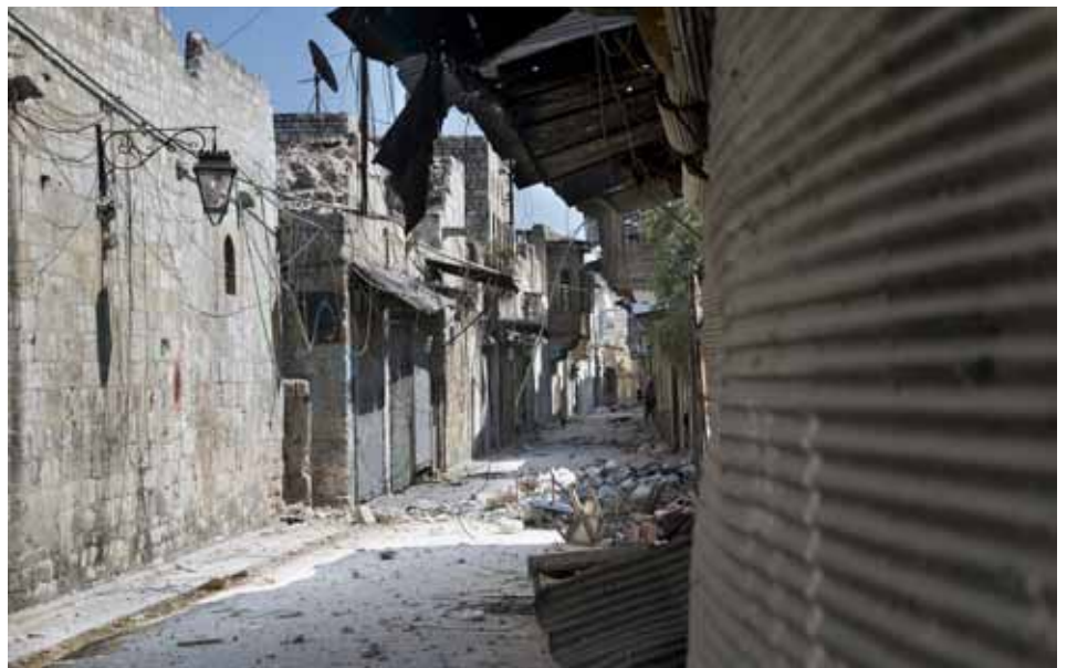
Els francotiradors que amenacen des de les teulades i les bombes han buidat els carrers de la milenària ciutat vella d'Alep