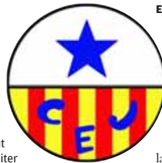
Escut del Júpter

per fer contactes o comprar armes. El grup d'acció de Durruti, Ascaso i Garcia Oliver, Los Solidarios, va utilitzar freqüentment les instal·lacions del club i, durant els anys trenta, hi van tenir un arsenal clandestí. El juliol de 1936, van robar dos camions, hi van instal·lar metralladores i els van aparcar al camp de futbol, que van fer servir de quarter general per aturar l'alçament feixista. La militància sindical armada del barri es va anar reunint als voltants del camp, des