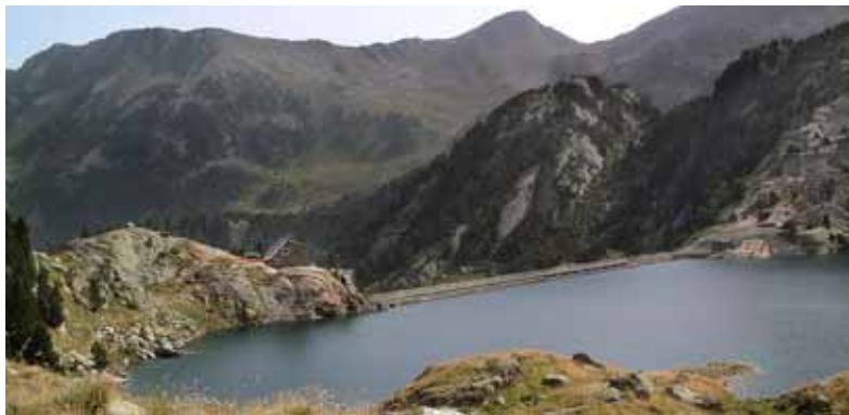
Vista de la presa Major de Colomers, amb una capacitat de 2,3 Hm 3 i una alçada de 25 metres