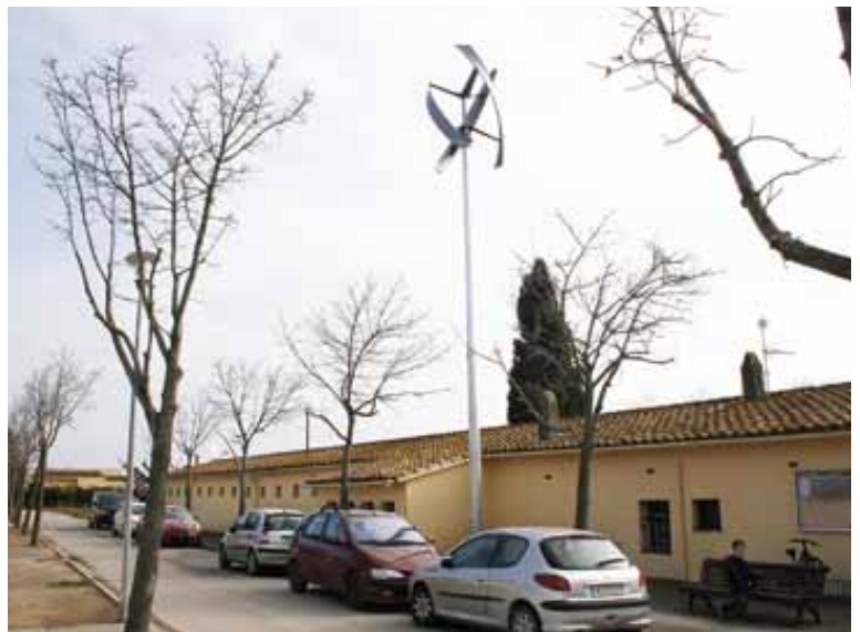
p2_Microaerogenerador del poble empordanès d'Ordis.tif

Japó, Austràlia, els Estats Units, el Canadà o Mèxic ha fet viables econòmicament les energies renovables sense necessitat de subvencions ni impostos especials. Tot i que fa més d'un any que els col·legis d'enginyeria i les entitats ambientalistes demanen la seva incorporació, la proposta de Reial Decret no en fa cap esment.