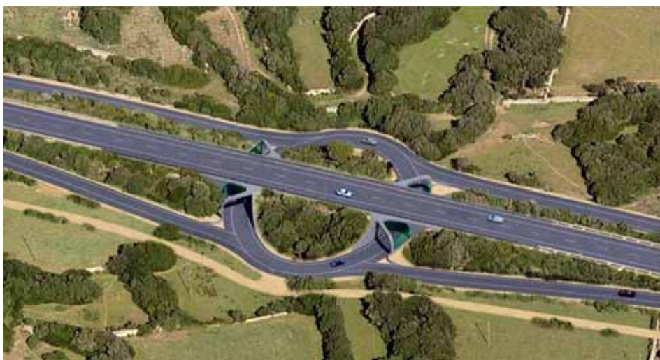
Disseny de la macrorotonda prevista a Biniai / CIME

Tot i que la Guàrdia Civil no té detectat cap punt negre a la carretera general de Menorca (la Me-1), el Consell pretén "reduir els accidents" mitjançant les rotondes soterrades. A més, el projecte guanyador del concurs que es va fer per la millora del traçat de la carretera entre Maó i Alaior no incorporava cap gran rotonda inferior. Ara, però, el projecte n'incorpora quatre, a