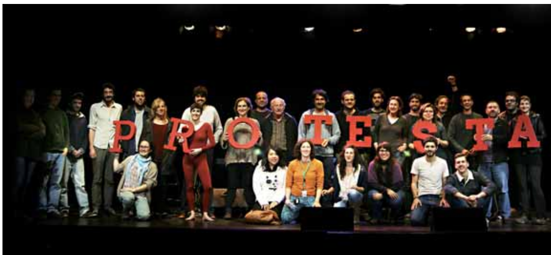
Foto de família del Protesta 2013

És per això que combina el concurs de curtmetratges amb activitats que s'allargaran durant tota una setmana: projecció de documentals, música en directe, exposicions, xerrades, taules rodones i activitats infantils. El termini per pre-