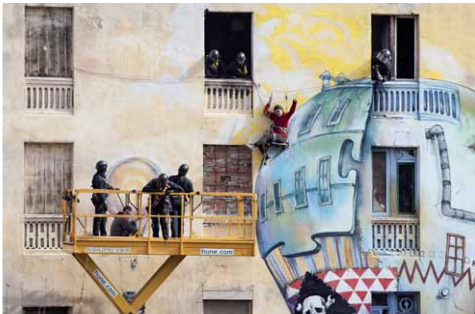
Els Mossos van utilitzar dues grues durant el desallotjament de La Carboneria el 19 de febrer