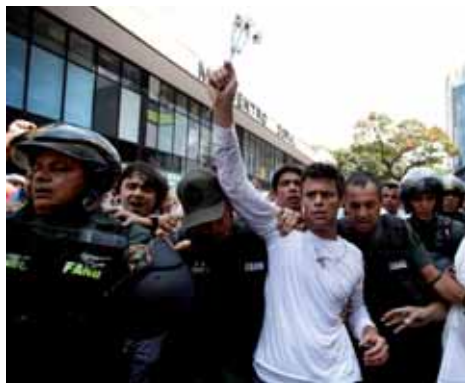
Leopoldo López s'entrega a la Guàrdia Nacional a Caracas el 18 de febrer