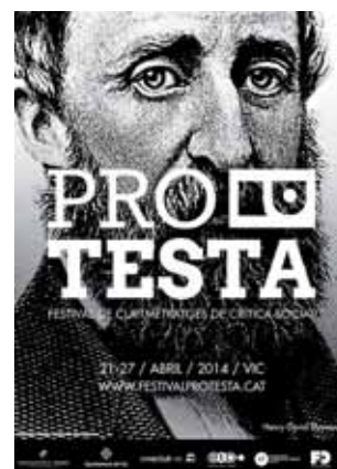
Roda de premsa de l'edició de 2013

Protagonista del cartell d'aquesta segona edició del festival, Henry David Thoreau (1817-1862) serà present a Vic durant tota la setmana, virtualment i també físicament. L'escriptor, anarquista i filòsof nord-americà és considerat la primera persona que va practicar la desobediència civil. Precisament a l'obra La Desobediència civil , argumenta la idea d'una resistència individual vers un govern massa sovint injust. Va fer contribucions importants a la història natural i a la filosofia i va plantar les bases de l'ecologisme i de la teoria del decreixement d'avui dia. La seva filosofia de resistència no violenta va influenciar el pensament i les accions de Tolstoi, Gandhi o Luther King.