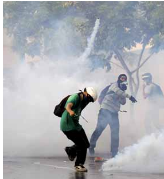
Protestes estudiantils a Caracas el 19 de febrer

López s'ha buscat una sòcia ben relacionada internacionalment, Maria Corina. Filla d'un important empresari veneçolà de l'acer, està graduada en enginyeria industrial per la Universitat Catòlica Andrés Bello i es va graduar en el Programa de líders mundials en polítiques públiques de la Universitat de Yale dels Estats Units. És cofundadora de l'associació civil Súmate i diputada de la Mesa de la Unidad Democràtica (MUD) a l'Assemblea Nacional de Veneçuela des de 2011. Corina manté una relació molt