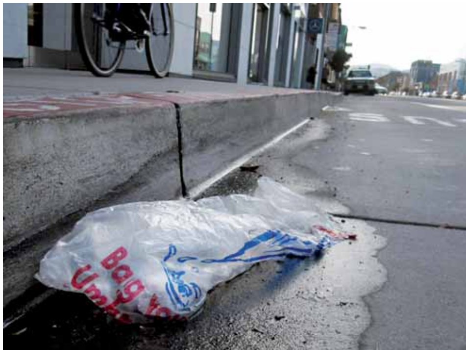
La substitució de materials no aborda el problema principal: la cultura d'usar i llençar