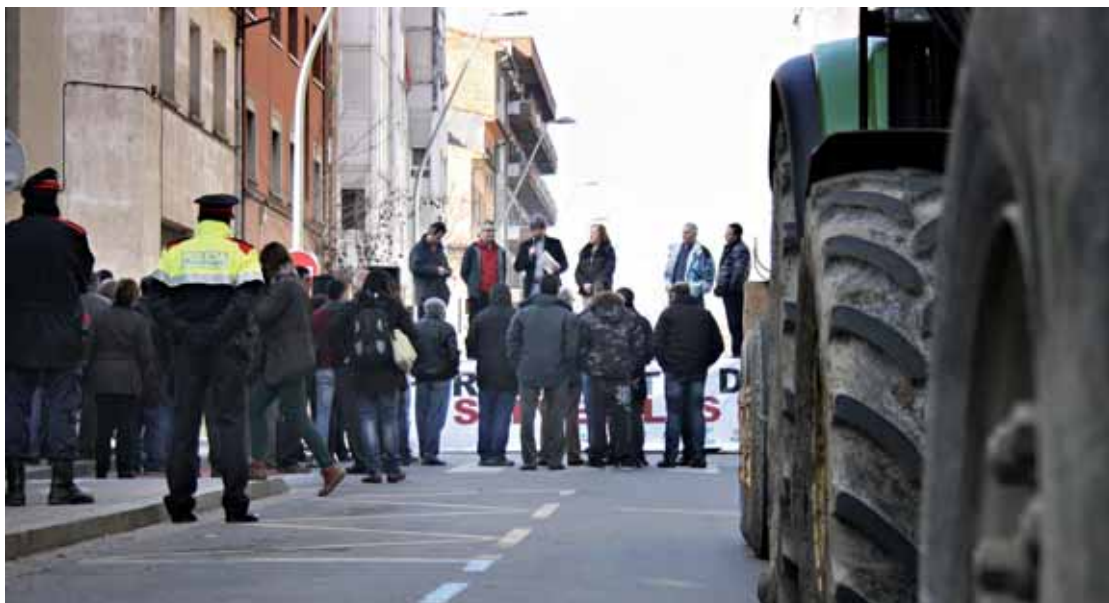
Protesta ramadera a Vic el 20 de febrer de 2014

El 20 de febrer, representants de diferents organitzacions agràries van fer costat a l'Associació d'Empreses per al Desimpacte Ambiental dels Purins (ADAP) amb els seus tractadors i cisternes de transport durant