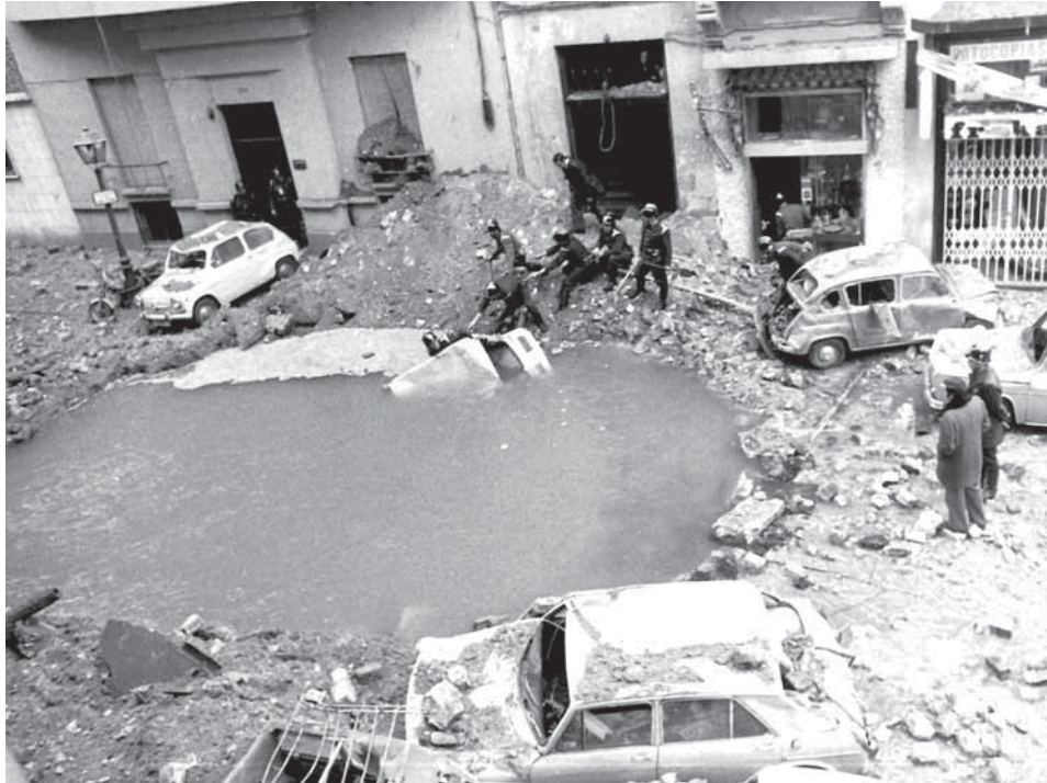
ETA va atemptar contra el president del govern Luis Carrero Blanco el 20 de desembre de 1973

Precisament l'organització armada basca va ser la següent a prendre el camí de les armes. La campanya d'activisme armat protagonitzada per ETA des de 1967—que va culminar el 1968 amb la mort del militant de l'organització Txabi Etxebarrieta i de dos policies— va inaugurar un període en què l'ús de la violència es va generalitzar entre sectors minoritaris, però cada cop més estesos, de l'antifranquisme. El següent que va fer el pas cap a la lluita armada va ser el FRAP, sigla creada pel PCE(m-l) que va adquirir protagonisme a partir de la mort d'un agent policial durant una manifestació convocada l'1 de maig de 1973 a Madrid. Ja el 1975, després dels afusellaments del mes de setembre i en un context d'increment de la violència