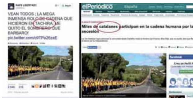
Sota l'etiqueta #SOS-Venezuela, s'han difós per les xarxes socials nombroses fotografies d'incidents ocorreguts arreu del món fent-les passar per imatges de Veneçuela. De dalt a baix: imatges de protestes al Brasil, rostre del jove basc torturat per la Guàrdia Civil Unai Romano i una imatge de la Via Catalana

en què posava els incidents de Veneçuela al mateix nivell que els d'Ucraïna i Tailàndia. D'altra banda, a través de les xarxes socials, s'ha disparat una gran campanya de manipulació per denunciar la suposada repressió que patia el moviment estudiantil per part dels cossos i les forces de seguretat de l'Estat. Des del dia que van començar els incidents, s'han difós imatges d'incidents ocorreguts arreu del món fent-les passar per imatges de Veneçuela