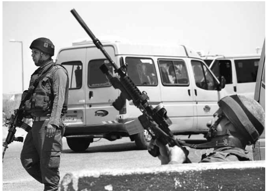
Militars israelians a Neue Yaaqov

Entre els anys 2000 i 2007, mentre la violència a la regió augmentava, el govern espanyol va