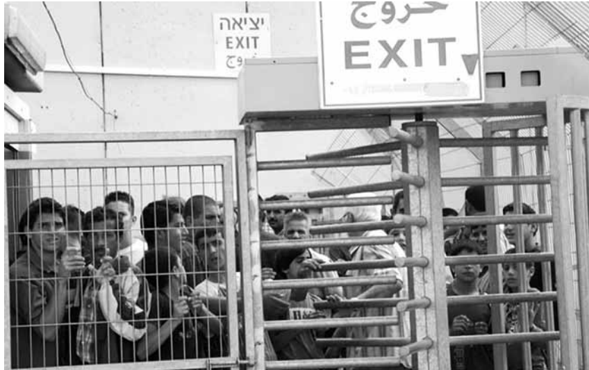
Milers de musulmans intenten arribar a Jerusalem pel 'checkpoint' de Betlem

Entre les lleis que citen com a exemple, hi ha la llei de retorn de 1950, que estableix que tots els jueus del món sencer són considerats nacionals de l'Estat i poden adquirir la nacionalitat israeliana. En canvi, els palestins no jueus estan sotmesos a la llei sobre la ciutadania i l'entrada a Israel de 1952, que limita l'obtenció de la ciutadania israeliana als no jueus presents en territori d'Israel entre 1948 i 1952 i als seus descendents. Per altra banda, als territoris palestins ocupats, hi ha dos sistemes jurídics en vigor, segons el Comitè