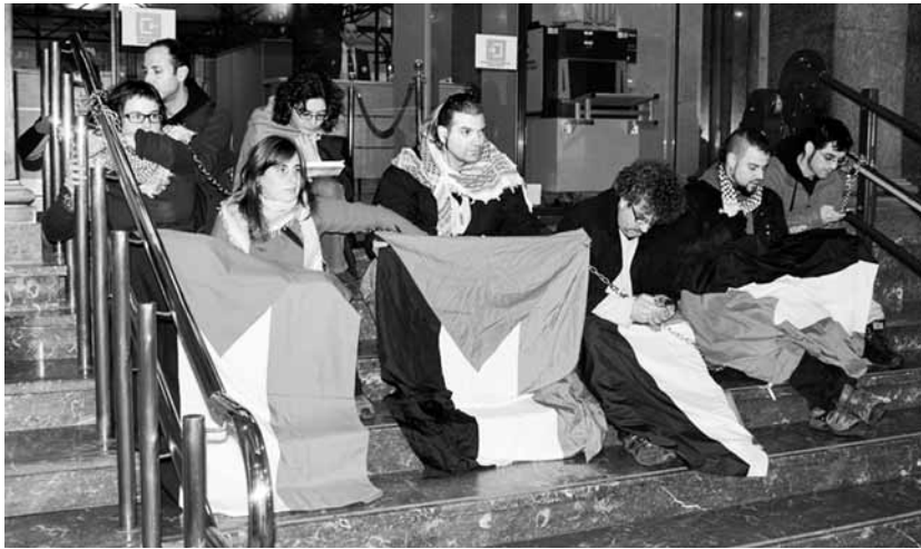
Encadenades a la seu del Departament d'Innovació Universitats i Empresa per demanar el trencament dels acords comercials

Així mateix, el vicepresident Carod-Rovira i el conseller d'Innovació, Universitats i Empresa, Josep Huguet, van viatjar a Tel Aviv el mes de novembre passat. Hi van anar acompanyats d'una àmplia delega-