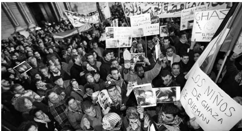
Concentració a la plaça de Sant Jaume de Barcelona el 4 de gener

ció d'empresaris amb l'objectiu de lligar negocis amb l'empresariat jueu. Els dos polítics catalans van agrair personalment a Peres la seva mediació, fruit de la qual Barcelona serà el lloc de trobada política de 43 països de la riba mediterrània.