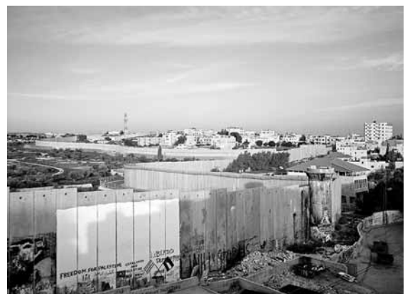
Vista general de Betlem

El dictamen del TIJ també feia referència a les obligacions de la comunitat internacional. Establí que tots els estats tenen l'obligació de no prestar ajuda o assistència per al manteniment de la situació creada arran de la construcció del mur i l'obligació de fer que Israel respecti el dret internacional humanitari incorporat al quart conveni de Ginebra.