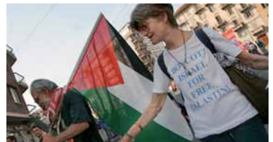
Boicot esportiu a Anglaterra i protestes a Irlanda, Suècia i Turín (Itàlia).