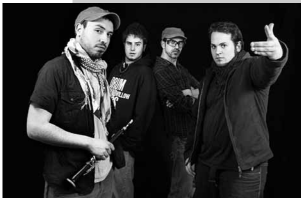
Concert amb La Bundu Band.

Jaleo Real, La Bundu Band i FdeFunk a les Festes de Primavera de Sant Andreu