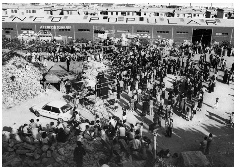
Foto antiga de l'Ateneu Popular 9barris

És necessari vincular les accions culturals transformadores, els espais on es produeixen i la manera com les volem gestionar