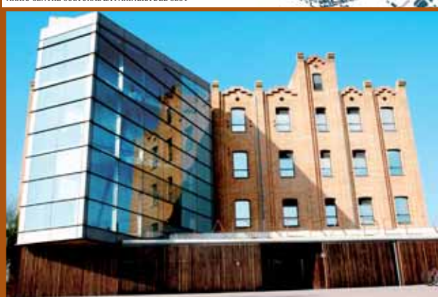
ARXIU CENTRE CULTURAL LA FARINERA DEL CLOT

La Farinera és un equipament que funciona econòmicament gràcies al conveni amb l'Ajuntament i, també, tot i que en menor mesura, als ingressos propis que genera. ÀLEX VILA