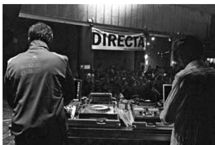
Concert del 5è aniversari de la Directa.

21 d'abril, 19h. Ateneu Popular de 9 Barris Preu: 6 euros.