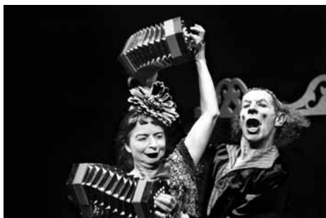
Los Excéntricos al seu espectacle 'Rococo bananas'. ALBA BARBÉ I SERRA