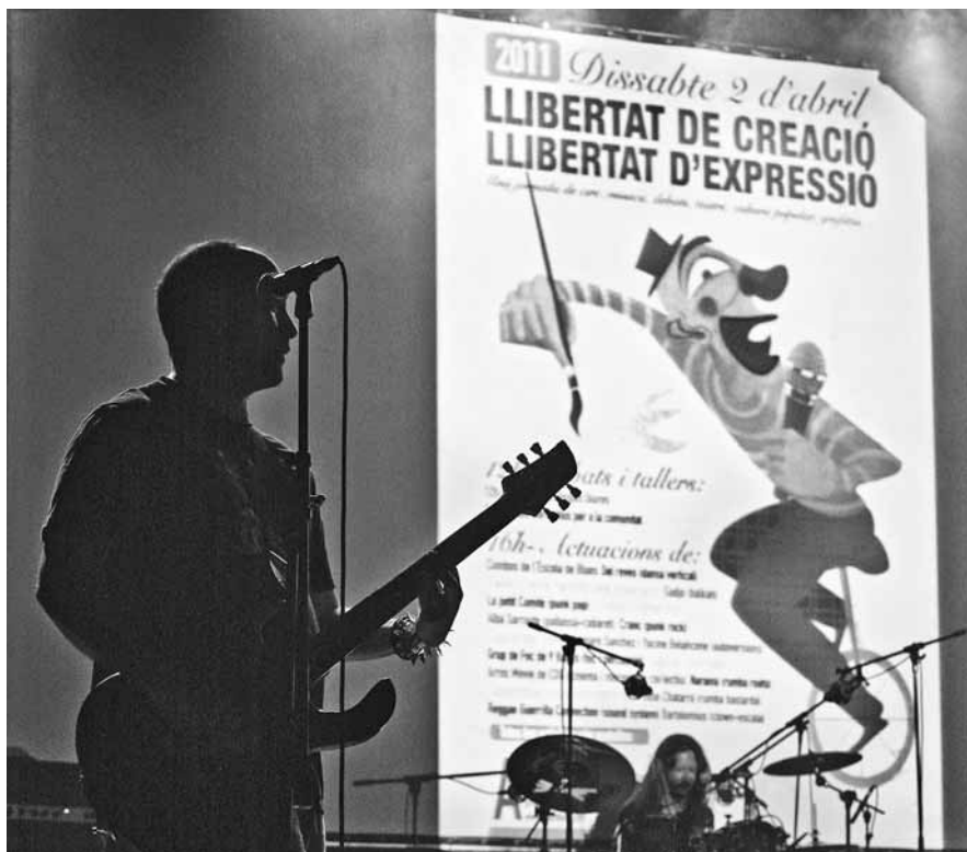
'Llibertat de creació, llibertat d'expressió' dins l'Expressió Directa 2011

En el moment de tancar aquest especial, el projecte havia arribat als 75 euros. Una quantitat gens despreciable, però encara insuficient. Fins al 20 de març, hi ha temps per aportar un granet de sorra per la consolidació del cycle.