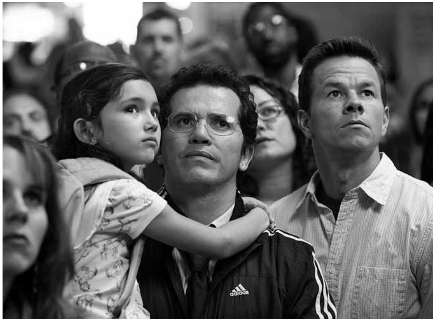
Fotograma de 'El incidente'

El rebuig a la política de la por i la sensibilitat ecologista dominen les noves ficcions apocalíptiques en la cultura de masses nord-americana