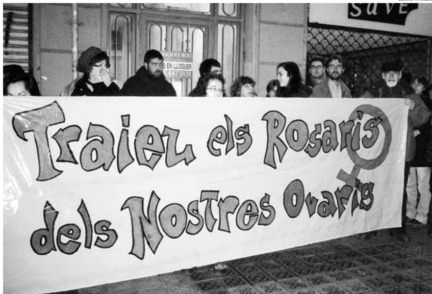
Pancarta que les manifestants proavortament van desplegar el 25 de gener

A mesura que passaven els minuts s'anaven aplegant més persones a ambdues voreres del carrer. La foscor d'aquella hora del vespre fins i tot va provocar situacions d'una certa confusió, ja que nombroses persones es dirigien a la concentració contrària per error i, quan se n'adonaven,