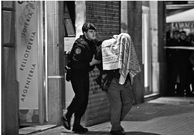
Una de les detencions a la Ronda Sant Pere de Barcelona

ro 5 de l'Audiència Nacional espanyola. El jutge Baltasar Garzón va ordenar la seva posada en llibertat, sense cap càrrec relacionat amb finançament d'activitats terroristes. El redactat del jutge només feia referència a un frau fiscal que s'havia d'aclarir per la via ordinària al jutjat d'instrucció 18 de Barcelona. Una infracció com tantes altres que s'acumulen en relació a l'impaga-