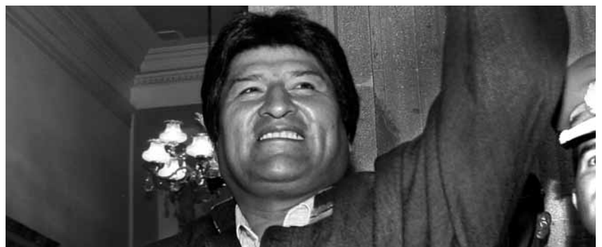
Instantànies del referèndum