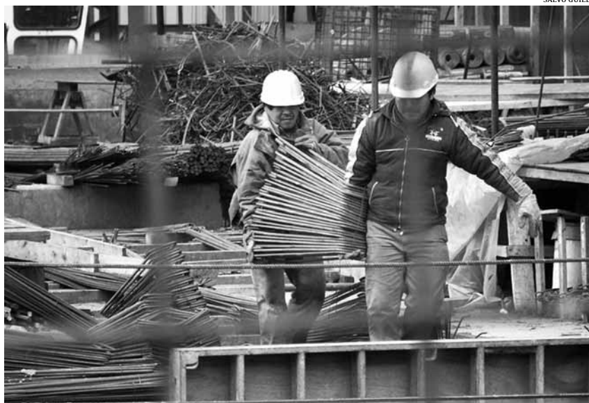
Treballadors immigrants de la construcció

El mes d'octubre hi havia 464.983 persones estrangeres afiliades a la Seguretat Social, quantitat que significava el 13,9% de l'afiliació total. El percentatge de les defuncions dels treballadors forans sobre la totalitat de les lesions mortals arriba a un 24,7%. És a dir, la proporció d'accidentats és gairebé el doble que la dels afiliats.