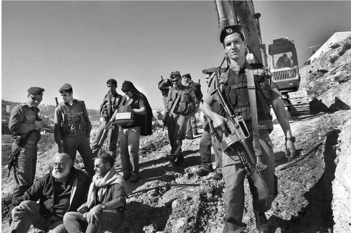
Activistes israelians del Israeli Committee Against House Demolitions intenten aturar a un bulldozer quan intentava demolir una casa palestina a Jerusalem Est.

La darrera gran manifestació de caire pacifista a Israel va ser l'homenatge a l'expressident israelià Isaac