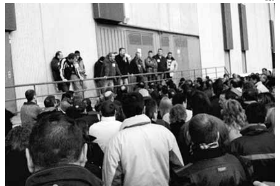
Assemblea de treballadors d'Esteban Ikeda

La secció sindical de la Confederació General del Treball (CGT) a Esteban Ikeda creu que aquesta decisió els deixa en una situació d'indefensió jurídica i demostra que a l'empresa "li importa molt poc seguir els passos que marca la legislació". És per això que el sindicat exigeix a la Conselleria de Treball que obligui a obrir la fàbrica amb la plantilla actual, ja que "durant molts anys ha obtingut beneficis suculents". Així mateix, diuen que tenen motius per pensar que les pretensions de l'empresa són continuar produint seients per a Nissan a través de l'eliminació de la plantilla actual i la contractació d'altres persones amb salaris i condicions de treball més precàries. Aquesta sospita es basa en una actuació similar a la practicada per l'empresa SAS a Abrera (Baix Llobregat), que continua pro-