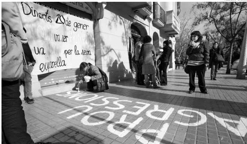
Una de les activistes pinta 'Prou agressions' en una vorera de l'Eixample barceloní

El 20 de gener un home de 34 anys va intentar assassinar la seva exparella propinant-li sis punyalades. L'escena es va produir a la confluència entre els carrers Provença i Sicília i, gràcies a la intervenció de tres vianants, la dona va poder salvar la vida, tot i les greus ferides sofertes. El grup de dones de l'Ateneu Popular de l'Eixample, barri on van tenir lloc els fets, va voler donar una resposta simbòlica davant el fet. El dissabte 24 de gener al matí, una desena de persones van dibuixar un mural al terra on deia: Prou agressions i van romandre allà de manera testimonial durant prop d'una hora. Amb aquesta acció, volien mostrar "la ràbia i la indignació i compartir públicament les emocions que es generen després d'uns fets com aquests".