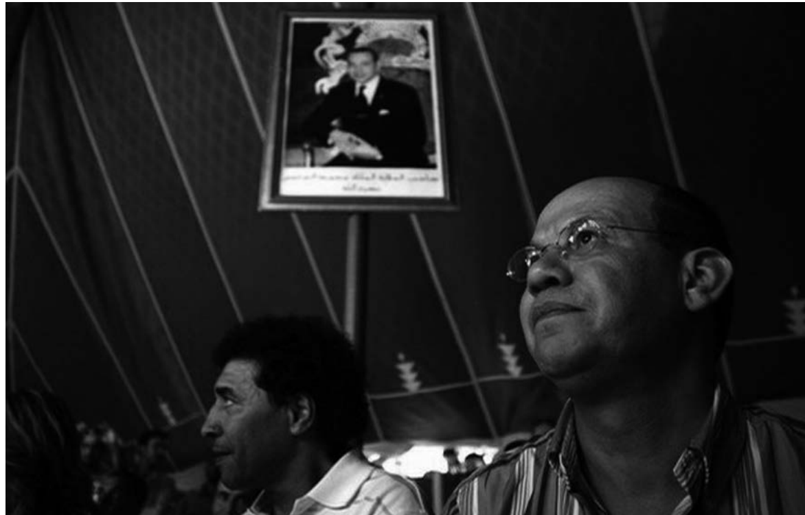
Fouad Ali Elhimma, fundador del PAM El amigo del Rey

Estas elecciones, las segundas durante el reinado de Mohammed VI, transcurrieron en un ambiente de