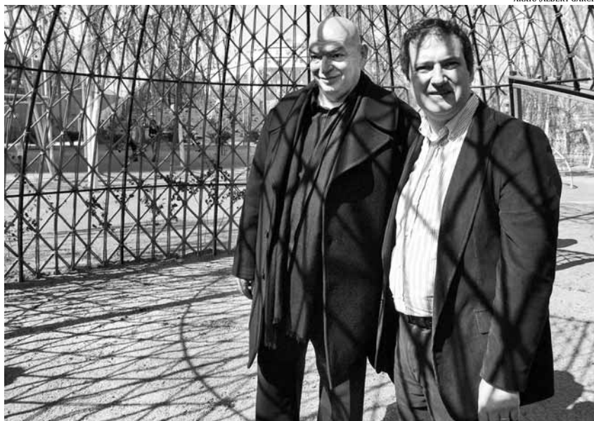
Jean Nouvel i Jordi Hereu inauguren el Parc Central del Poblenou el 8 d'abril de l'any 2008

Espai públic i relacions socials Aquesta decisió municipal, aparentment basada en criteris econòmics, exemplifica el model de ciutat que impulsa l'Ajuntament encapçalat per l'alcalde Jordi Hereu. Històricament, l'espai públic ha tingut un lloc destacat en l'organització de l'urbs