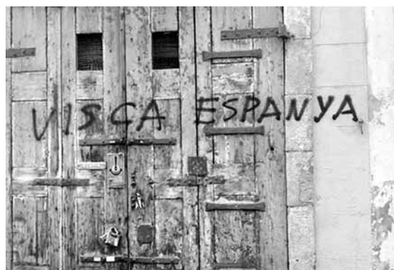
El Terra d'Escudella presentava aquest aspecte el matí següent de la celebració

Una vegada més, l'espanyolisme ha demostrat els seus tics feixistes i intolerants vers tot allò que no està d'acord amb la seva idea d'Espanya; ha demostrat que es tracta d'un nacionalisme que no existiria sense l'obligació d'agredir tot allò que és diferent.