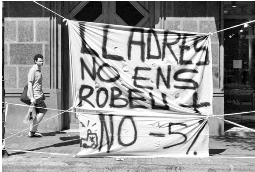
Pancarta col·locada per les treballadores davant del Tribunal Laboral de Catalunya, al carrer Roger de Llúria de la ciutat de Girona

Les treballadores dels transport sanitari de Catalunya van arribar in extremis a un preacord amb la patronal després d'una setmana intensa de mobilitzacions. La plantilla va ratificar aquest preacord la nit del 19 de juliol i, per tant, van desconvocar les altres tres jornades de vaga que tenien programades pel mes de juliol. La setmana del 12 al 18 de juliol va començar amb una manifestació pel centre de Girona, on mig centenar de persones van protestar contra la retallada salarial del 5%. La protesta va transcórrer des de la plaça Independència fins a la nova seu de la Generalitat a la ciutat, on van voler solidaritzar-se amb les treballadores de la neteja, acampades des de fa mes d'un mes a les portes d'aquest edifici. Aquesta mesura, que va ser implementada de forma unilateral per la patronal del sector ACEA a les nòmi-