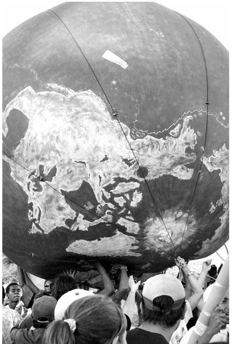
Manifestació del Fòrum Social Mundial de Porto Alegre (Brasil), 2003

Però més enllà, el dret d'autodeterminació dels pobles a l'era de la globalització haurà de ser, finalment, aquell factor que volia Frantz Fanon: que serveixi per qüestionar les estructures jurídiques imposades pel món dels estats-nació i porti els pobles a plantejar realitats comunitàries i projectes col·lectius d'acord amb la pròpia naturalesa dels pobles i amb lectures apropiades i diferents de la llibertat, la igualtat i la fraternitat.