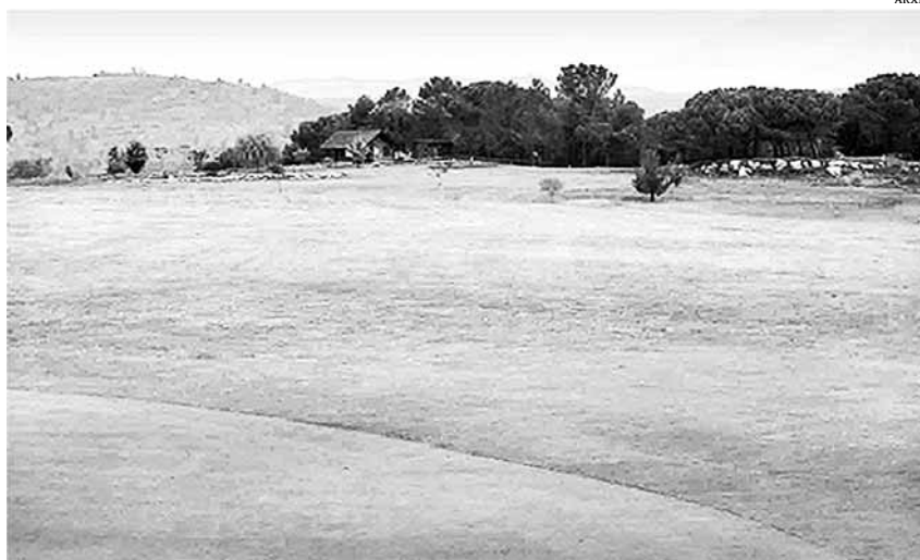
El camp de golf de Montbrú (Moia) s'ha construït en terrenys agrícoles i també en sòl de protecció forestal

En relació a les grans ciutats, el pla territorial permet un increment de més del 60% del sòl urbà consolidat. Són els casos de Manresa, Igualada, Vic, Berga, Calaf o Solsona. En algunes ciutats, els nous POUM ja estan aprovats i, en d'altres, resten a l'espera per la gran complexitat que suposen. Un cas que cal esmentar és el d'Igualada, on a principis d'any es va retirar el nou POUM (plantejat a finals de 2009) per les al·legacions i crítiques plantejades per plataformes veïnals, associacions i partits polítics de l'oposició. Els grans punts crítics van ser la reconversió del