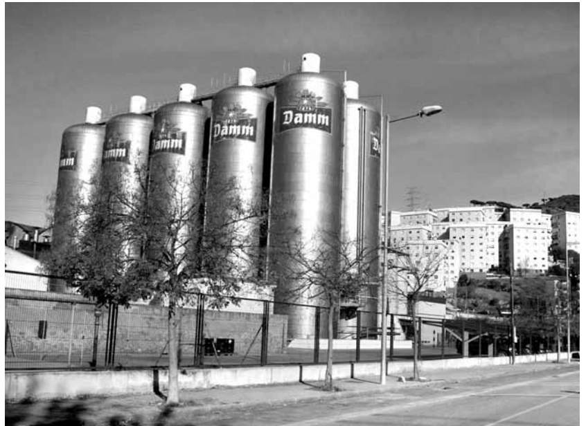
Fàbrica de l'empresa Damm situada a Santa Coloma de Gramenet

El patriarca de la dinastia va ser Demetrio Carceller Segura, que va ocupar la cartera de ministre d'Indústria i Comerç entre el 1940 i el 1945, en plena postguerra civil a l'Estat espanyol i durant tot el període en què va transcórrer la Segona Guerra Mundial. Havia emigrat durant els anys 20 a Catalunya i es va establir a Terrassa. Va aconseguir el títol d'enginyer tèxtil i es va afiliar a la Falange Española de José Antonio Primo de Rivera l'any 1933. L'aixecament popular revolucionari que es va oposar a l'alçament