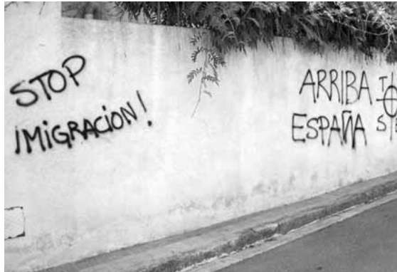
Pintades aparegudes la matinada del 12 de juliol a Argenton (Maresme)

A la ciutat de Tarragona, el 12 de juliol, els atacs i els intents d'agressió es van allargar fins passades les 3 de la matinada. Tres neonazis que portaven una bandera espanyola amb l'àliga franquista van amenaçar quatre persones que cantaven l'himne del Barça dins el bar Pachito, que van haver de marxar escortades pels Mossos per no ser agredides. A la plaça de la Font, l'afició de la Roja va intentar cremar una estelada. Un home ho va veure, la va agafar i va començar a córrer, però un centenar d'espanyolistes el van apallissar. Davant la impossibilitat de banyar-