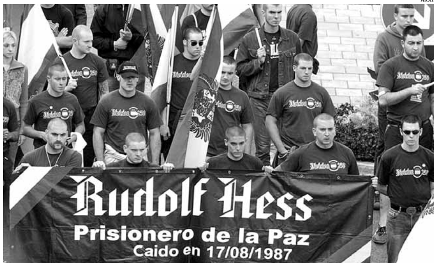
Un grup de neonazis espanyols fan un homenatge a Rudolf Hess (comandant d'Auschwitz) a Alemanya l'any 2004