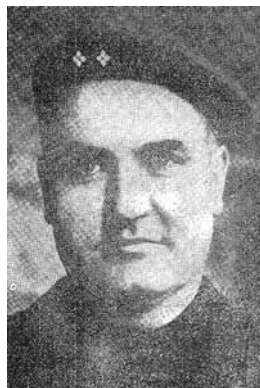
Demetrio Carceller Segura, ministre franquista d'Indústria i comerç

militar franquista de 1936 va forçar que ell i la seva família fugissin fins a Burgos, ciutat que es va convertir en el feu dels colpistes.