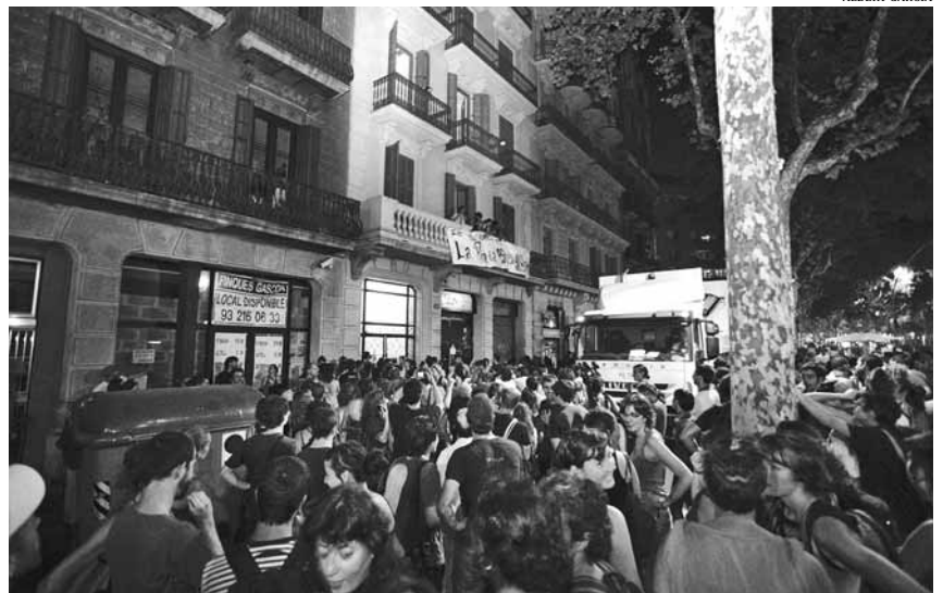
Durant els darrers moments (vespre) de la manifestació del 14 de juliol, les activistes okupen un altre edifici a la Gran Via