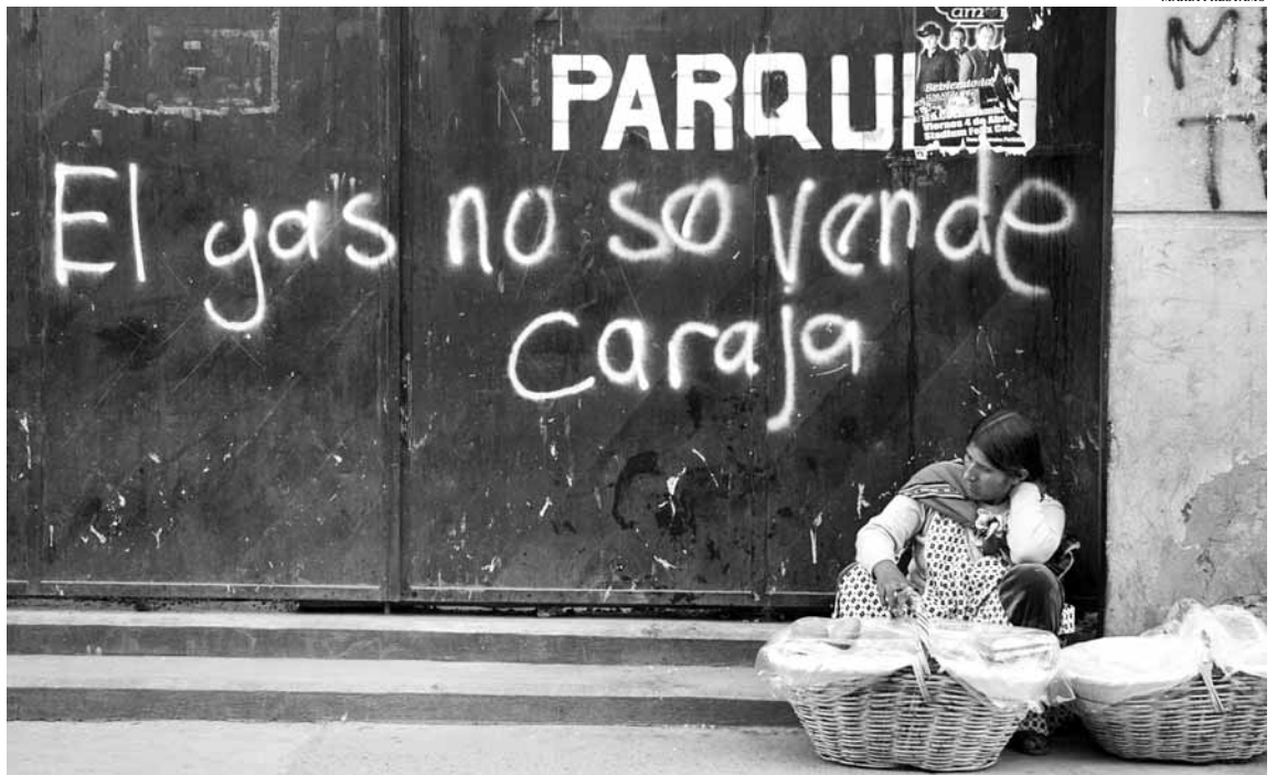
El rendiments que teòricament hauria de generar la publicitada nacionalització del gas no han beneficiat els pobles indígenes de Bolívia

Els pobles indígenes amazònics exigeixen el compliment de la promesa feta pel govern d'Evo Morales: drets democràtics i col·lectius, accés real al territori, possessió del territori al marge de la delimitació departamental, administració dels recursos naturals, elecció de les pròpies autoritats mitjançant els seus costums. En resum, les demandes interpel·len el suposat Estat dels indígenes i qüestionen l'anomenat president indígena .