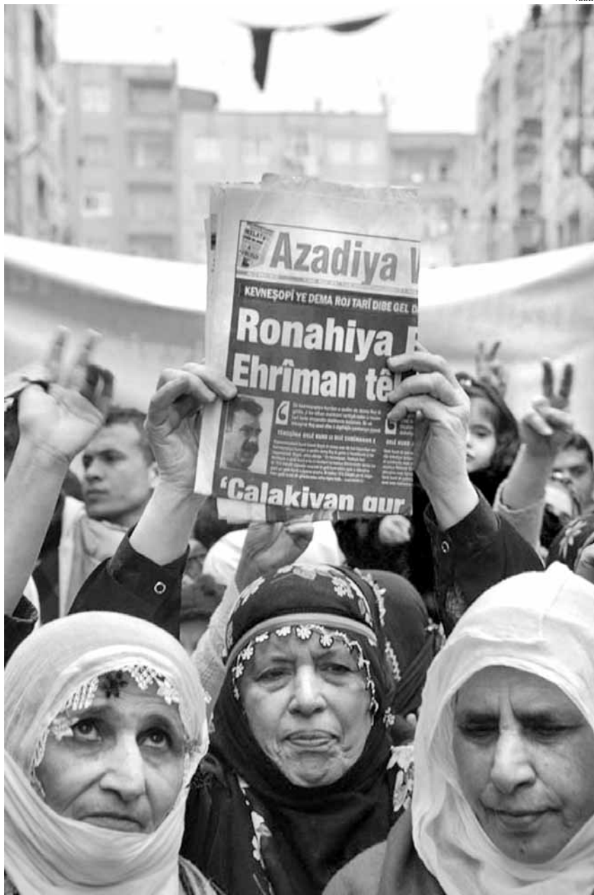
Un moment de les protestes que es fan cada any el dia 15 de febrer per protestar per la detenció del líder kurd Öcalan

Però, un cop retirada la pressió de la guerrilla, la Unió Europea es va centrar de nou en allò en què s'acostuma a centrar: unificar criteris econòmics i liberalitzar el proteccionista Estat turc. I la població kurda van haver de