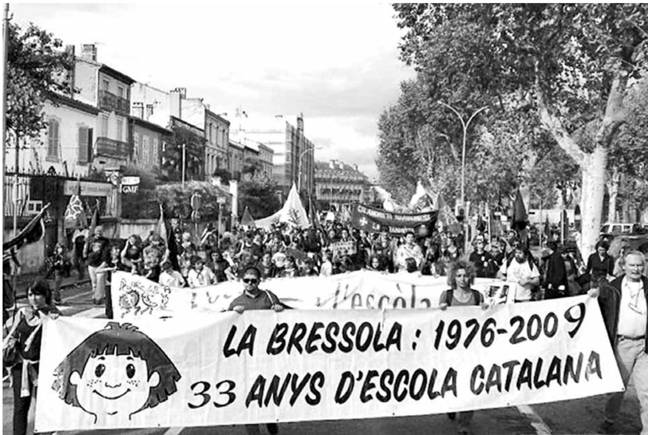
Pares i alumnes en la marxa anual que commemora el Tractat dels Pirineus

La presència del català a la Catalunya Nord continua essent testimonial. No obstant això, l'esforç d'entitats i de persones compromeses amb la identitat garanteix un itinerari educatiu on la llengua catalana esdevé el vehicle de comunicació de centenars de nens i nenes. Una llavor imprescindible per la represa nacional en aquesta part de la geografia catalana.