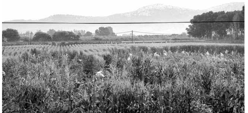
Camp de blat de moro plantat amb llavors de l'empresa Syngenta sabotejat el 12 de juliol

Es dona la circumstància que el govern espanyol va autoritzar els experiments durant la tardor de