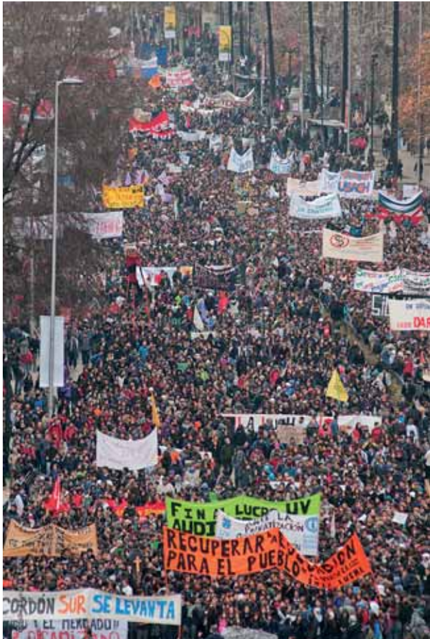
Marxa per l'educació a Santiago de Xile el 30 de juny de 2011