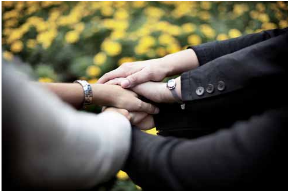
Més de 150 entitats del sector de la salut mental d'arreu de l'Estat subscriuen el manifest contrari a la reforma legislativa