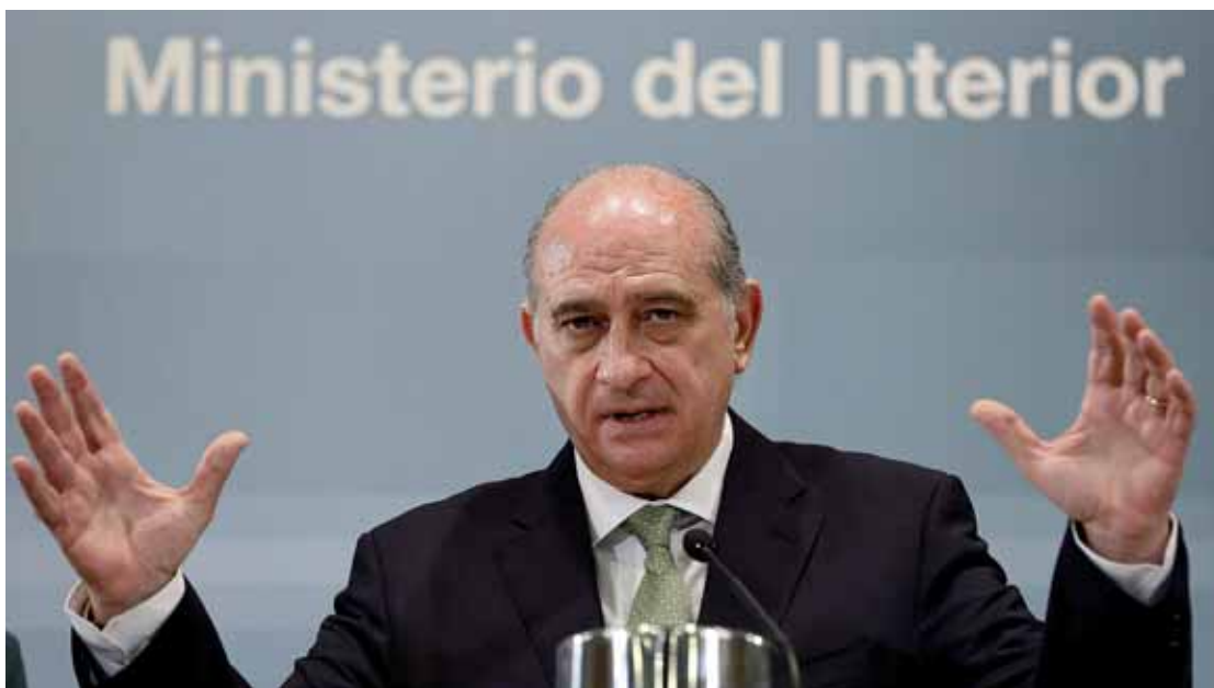
Jorge Fernández Díaz, ministre d'Interior, va afirmar que les detencions del 8 de gener van servir per desarticular "el tentacle" d'ETA que "controla" a les preses

Aquestes declaracions no haurien de sorprendre ningú, ja que el PNB ha demostrat, per activa i per passiva, la seva comoditat amb la situació actual, que li permet situar-se en l'equidistància, com un agent neutre entre els dos extrems que, segons la seva visió, conformen l'esquerra abertzale i el PP. Només es mou quan veu que hi pot perdre més amb l'immobilisme, com va passar l'11 de gener. De fet, en aquest sentit, no és gaire diferent del que ha viscut Convergència amb l'independentisme català. Per tant, per molt que els nous passos del PNB en defensa d'un veritable procés de pau i reconciliació siguin d'agrair, no es produiran si no es veu obligat a fer-ho. La clau per obligar-lo i aconseguir que la unió no sigui flor d'un dia, com es va fer palès a la manifestació de Bilbao, la té la ciutadania. ◀