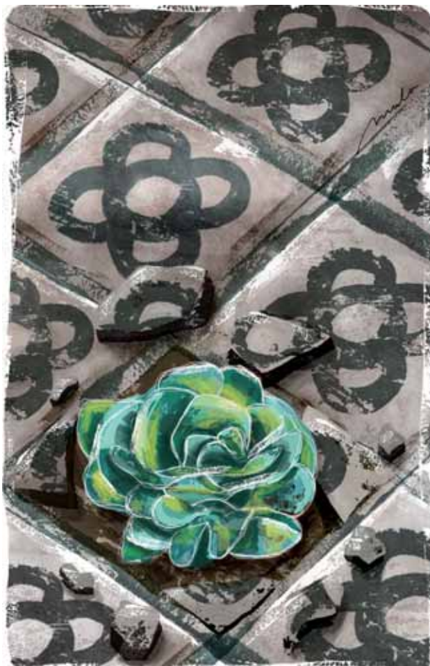
/ XAVIER MULA

Es a dir, s'okupen espais oblidats i abandonats per denunciar les pràctiques especulatives que caracteritzen un determinat tipus d'urbanisme, però també per donar vida a espais que es consideren morts a través de la seva transformació en llocs per a la comunitat, per recuperar una forma de viure la ciutat que històricament s'ha demostrat possible. Als horts comunitaris, l'espai deixa de ser concebut com una mercaderia estàtica atrapada en la seva forma arquitectònica i comença a ser viscut com un procés