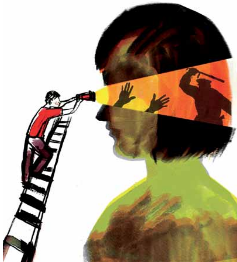
IL·LUSTRACIÓ: Núria Frago

Al començament dels anys 80, amb l'esclat de l'onada de protestes contra la dictadura a causa de la crisi econòmica, va semblar que el model neoliberal entrava en declivi, però l'oposició va subestimar la capacitat de reacció de Pinochet i els seus partidaris, que van aconseguir aguantar