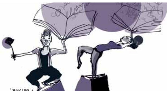
/ NÚRIA FRAGO