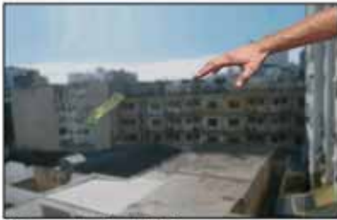
Vei enxampat en ple acte incívic

Avui dia, un bon diari no és el que corre rere la notícia, sinó el que fa córrer la notícia rere la seva tonteria banal. És un sistema més econòmic que el de transcriure els teletips que t'envia la policia o El Corte Inglés. Des del nostre continental diari, avui volem obrir una croada contra l'incivisme que impera al barri de Pedralbes de Barcelona, una campanya que recalarà durant uns quants mesos a les nostres pàgines salmó, fins que tingueu tant el cap com un timbal que creixi que, en realitat,