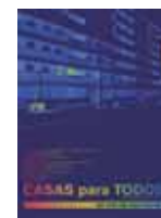
Casas para todos Dir. Gereon Wetzel (Alemanya 2013) 52 minuts Per horaris dels propers passis: www.eldocumentaldelmes.com

això que forma part de la bombolla immobiliària i l'especulació. Això és el que més m'ha interessat. Potser, les persones que vegin el documental es prendran aquest tema d'una manera una mica més emocional, veuran que ha estat una bestiesa, obriran una mica els ulls. Ja pots explicar milers de vegades que hi ha 3,6 milions de pisos buits, que aquest nombre poden explicar molt i, alhora, no expliquen res. De fet, el documental és una mica això, pot explicar molt o no pot explicar res, depèn de com omplis els forats que he deixat per les teves idees, les teves fantasies o les teves projeccions. És una pel·lícula per gent que mira de manera activa.