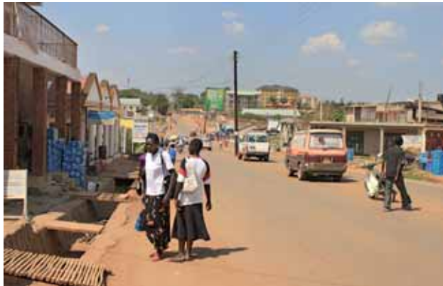
Gulu és la principal ciutat del nord d'Uganda