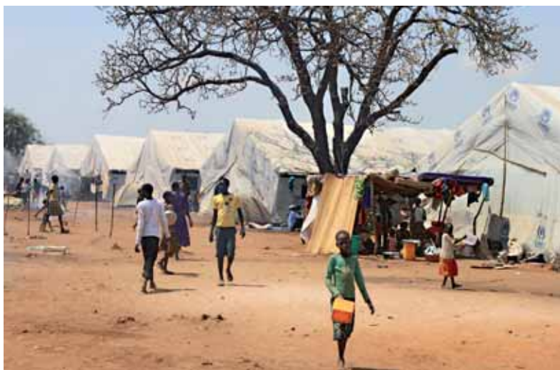
Camp de refugiades de Nyumanzi

Les diferències no són únicament paisatgístiques. Només cal parar l'orella i obrir els ulls per adonar-se que Adjumani i la resta del nord d'Uganda és un món completament diferent de Kampala. El luganda, l'idioma bantu que es parla a la gran ciutat, ha estat substituït pel ma'di, una llengua nilòtica. La desconfiança vers la capital és la norma entre la població local, víctima d'una guerra irresolta durant més de dues dècades. Les cicatrius del conflicte són visibles i