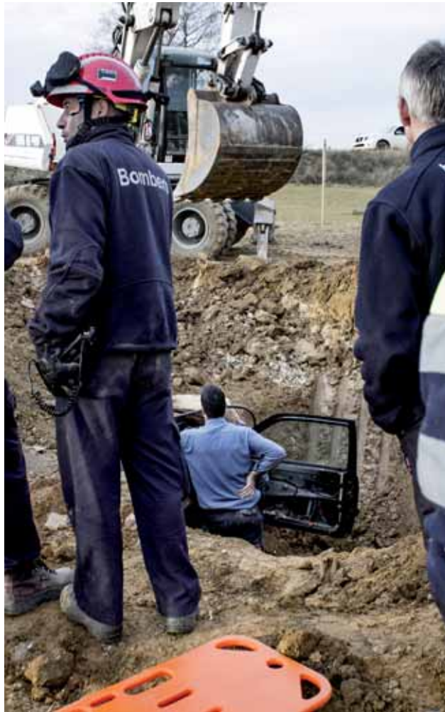
Acció contra la MAT a Fellines el 8 de gener d'enguany

L'acció de desobediència de Fellines, en què una persona es va encadenar dins un cotxe soterrat, o la consulta de Santa Coloma han donat embranzida al moviment d'oposició i han ajudat a articular-lo. Està previst que, el 12 de febrer, la Plataforma No a la MAT, l'Assemblea No a la MAT, la Xarxa per la Sobirania Energètica, Som Energia, la CUP, l'Associació de Naturalistes de Girona i IAEDEN-Salvem l'Empordà es trobin amb l'objectiu de definir i plantejar estratègies contra el projecte.