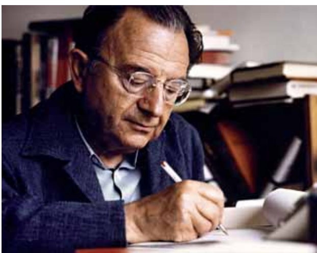
Erich Fromm (1900-1980)

Per Erich Fromm, la llibertat i la vida humana són inseparables. Si Freud considera que la societat és un element repressiu, Erich Fromm defensa que la societat també posseeix una funció creadora. Per tant, la relació de l'ésser humà amb el món no és estàtica, sinó dinàmica. Així, Fromm assenyalava tant la importància del factor psicològic en tot procés social com la interdependència que mantenen ambdós. Però, aquesta actitud menys rígida (per entendre'ns) que la de Freud no el cohibeix a l'hora d'expressar una preocupació relle-