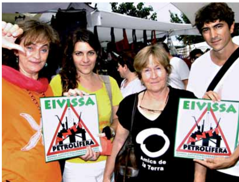
Una imatge de la campanya de denúncia Eivissa anti-petrolífera