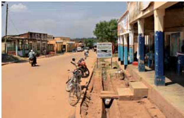
Al municipi de Kitgum, hi ha la seu del Centre de Documentació de Memòria Nacional i Pau