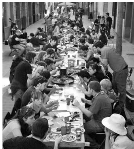
Paella popular organitzada per la Colla la Masovera de Castelló

–nosaltres som la Colla la Masovera– i, a través d'ella, tots els tràmits burocràtics són més senzills. No és com la