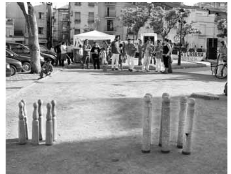
Competició de bitlles catalanes a la capital del Segrià

El primer any vam tenir un gran problema amb l'Ajuntament pel tema del permís. Al barri hi ha una associació de veïns formada per allò que podríem anomenar “els veïns de tota la vida”, que adopten el discurs clàssic de la inseguretat i critiquen la marginalitat en què viu el barri, però des d'un punt de vista totalment classista. El president d'aquesta