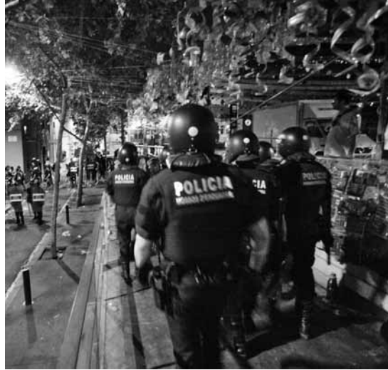
Les alternatives de Gràcia han patit una forta criminalització mediàtica

Per altra banda, una pràctica recurrent de les administracions locals des de fa uns anys és la de silenciar i criminalitzar algunes festes majors alternatives. Així doncs, algunes revistes i diaris locals, sovint depenents en major o menor mesura de l'ajuntament de torn, acostumen a tractar les festes autogestionades