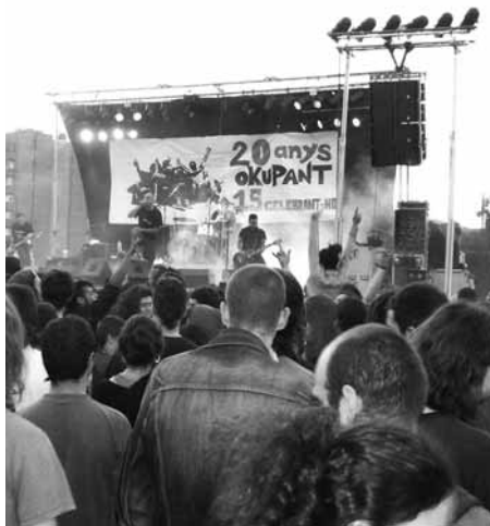
Habeas Corpus a les alternatives de Korneyà, el juny de 2007

Fins ara, hem estat parlant de costos, obstacles i contractes, però sempre dins l'àmbit de grups afins i de projectes que tenen la paraula cooperació com a premissa de funcionament. Com destaquen totes les entitats organitzadores de festes majors amb qui hem parlat (vegeu entrevistes adjuntes), el potencial de la nova organització és la possibilitat de compartir contactes amb grups musicals, infraestructura diversa i també experiència. La seva base de dades permet establir contactes directament amb algunes bandes i un dels objectius de la CFMA és arranjar gires comunes, que serveixin tant per la difusió de determinats grups musicals com per poder elaborar amb més facilitat el cartell de cada festa major.