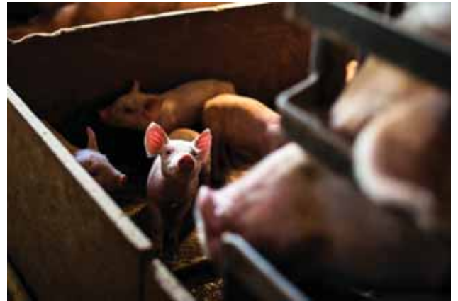
/ B. G. R.