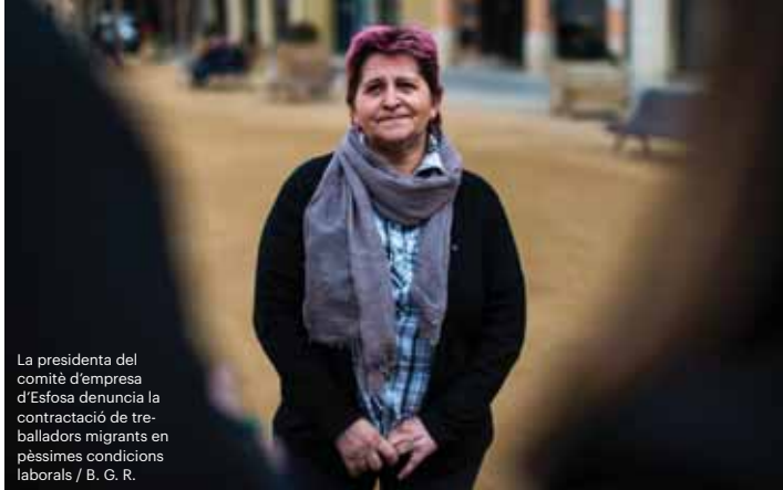
La presidenta del comitè d'empresa d'Esfofa denuncia la contractació de treballadors migrants en pèssimes condicions laborals / B. G. R.