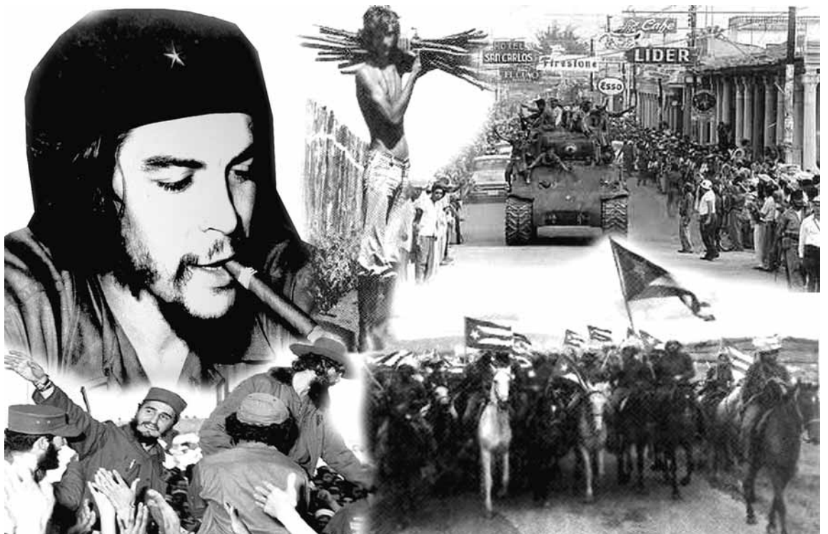
D'esquerra a dreta i de dalt a baix: el Che Guevara, un estudiant semblant tomàquets, l'exèrcit revolucionari entrant a l'Havana, Fidel Castro i Camilo Cienfuegos, i Camilo Cienfuegos amb l'exèrcit durant la nacionalització de la United Company.

Segurament, qui pretengui fer una anàlisi seriosa de la transcendència d'aquest fet hauria de tenir en compte necessàriament els diferents indicadors socials, econòmics i polítics existents a Cuba abans de 1959 i el seu comportament durant els diferents etapes esdevingudes després del triomf revolucionari. I, com a contrast addicional, comparar de manera íntegra la situació de Cuba en relació a la