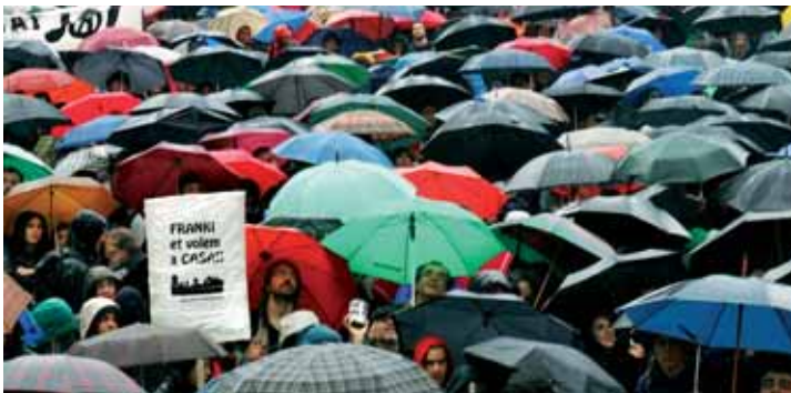
Dues mil persones van exigir la llibertat de Franki. Ja ha complert la condemna.