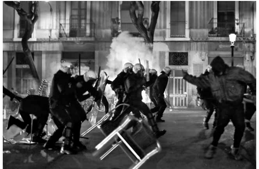
Enfrontaments entre manifestants antifeixistes i Guàrdia Urbana a la plaça Rius i Taulet

A Catalunya, en canvi, les institucions polítiques i judicials no van posar cap impediment a la realització de l'acte, tot i que SOS Racisme havia de-