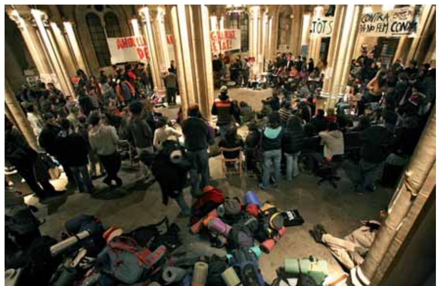
Ocupació del rectorat de la UB en contra del procés de Bolonya. Les tancades continuen.