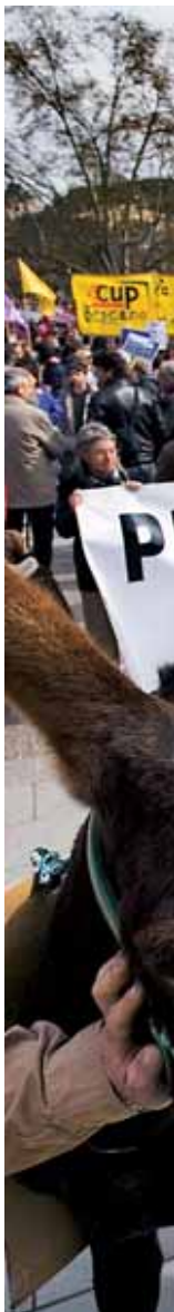
Marxa contra la lí