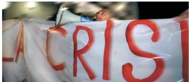
Les marxes contra el capitalisme han proliferat. I el que ens queda!