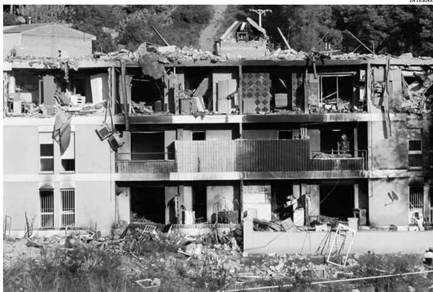
L'última planta es va ensorrar i la façana del tercer pis va quedar totalment destruïda

El fet que els detonants d'aquests accidents mortals hagin estat fugues d'aigua i de gas ha desencadenat en els darrers temps una alerta al voltant de l'estat de les xarxes d'abastiment de serveis públics que majoritàriament són gestionades per empreses privades. Unes companyies que, molta gent es pregunta si inverteixen prou en el manteniment o la renovació de les canonades. I si prioritzen els criteris socials