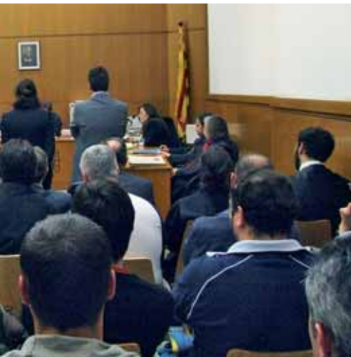
...n a la banqueta, acusats de tortura. Han estat absolts.