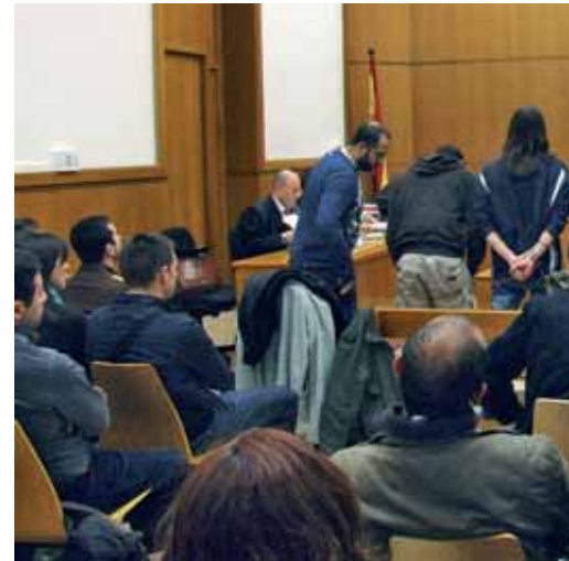
Els policies del grup VI de la brigada d'informació s'asseuen