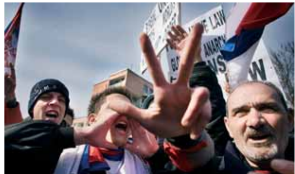
Kosovo va declarar la independència, però viu en una calma tensa,