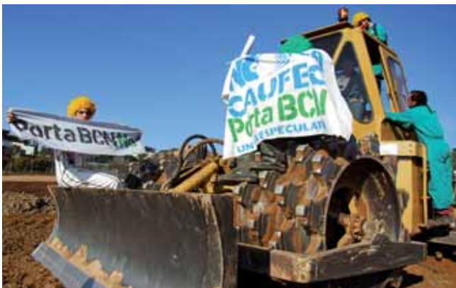
Encadenades contra el pla Caufec. Ara, la crisi ha aturat les obres.