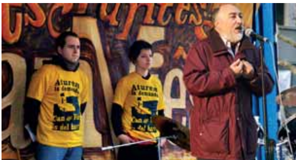
Can Vies va guanyar el judici de desnonament. La vida continua.