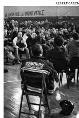
Assemblea al Parc de l'Eixample

Els sindicats CCOO i UGT i la Plataforma de Bombers van defensar la necessitat d'acceptar el precord perquè suposava un pas endavant i no es traduïa en una signatura del conveni, sinó en una fase més de la negociació. També van considerar que la predisposició municipal a intentar resoldre favorablement les sancions era una proposta en ferm.