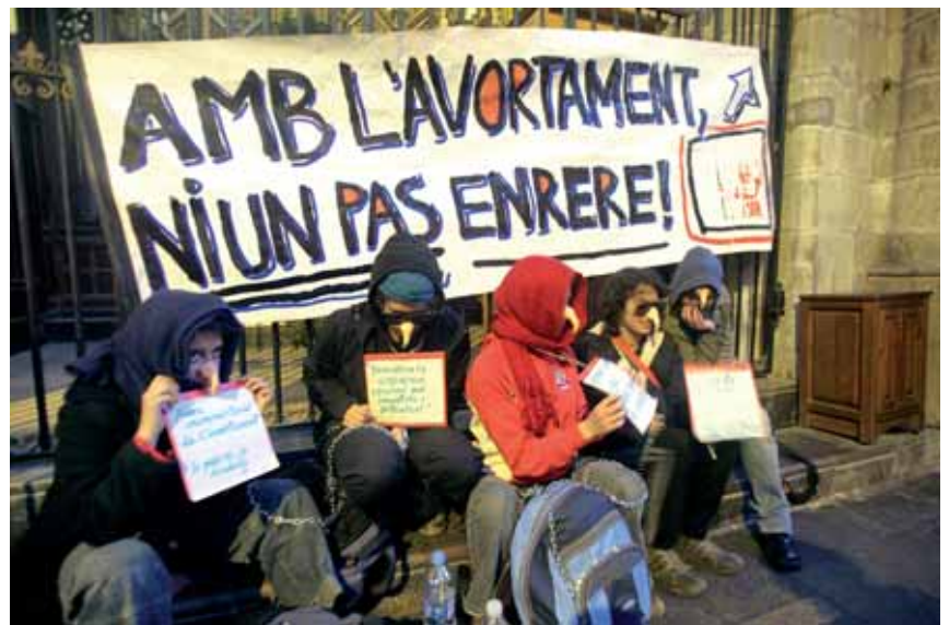
Acció per l'avortament lliure i gratuït dins de la Catedral. El govern prepara una modificació de la llei.