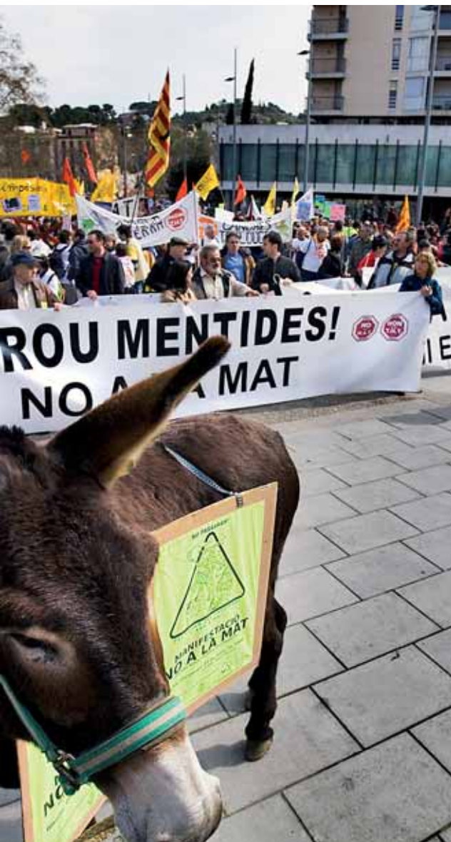
...nia de Molt Alta Tensió. L'oposició ha aturat trams de la instal·lació.