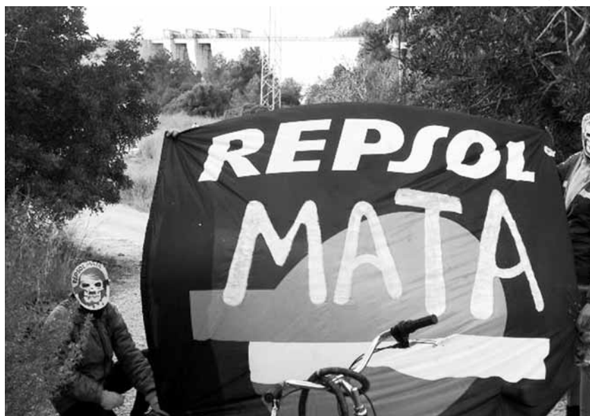
DIRECTA EL CAMP

Malgrat el fred, la bicicletada va recórrer vint quilòmetres seguint el curs del riu