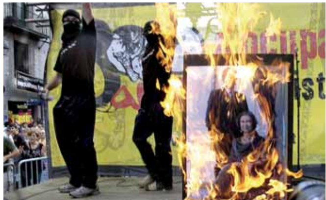
Crema de fotos monàrquiques al Fossar. Encara hi ha judicis pendents.