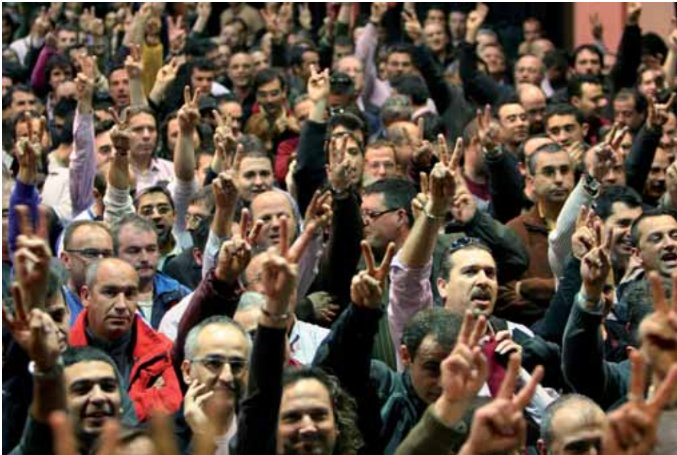
Assemblea de conductors d'autobusos de TMB al Casinet d'Hostafrancs. Han guanyat la lluita pels dos dies.