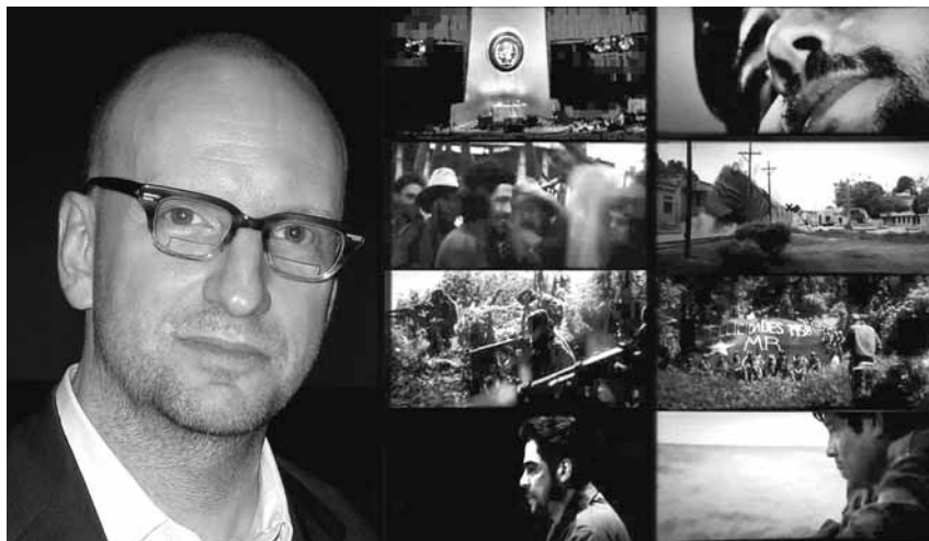
Fotogrames de la pel·lícula 'Che El Argentino' i el seu director Steven Soderbergh

Va resultar esgarriós i curiós que les paraules del Che Guevara enjudicant els EUA davant l'ONU o de Fidel Castro denunciant els governs nord-americans fossin ateses amb un silenci impecable i retrunyissin a l'àudio d'una sala de cinema nord-americana plena de gom a gom. Al cor de la mateixa Nova York on el Che havia estat els anys 1962 i 1964, el públic va ser receptiu a la versió de Soderbergh i a la història de la revolució cubana i de la guerrilla a Bolívia que s'explica a la pel·lícula. Les batesses del Che amb les altes esferes del govern nord-americà durant la seva estada a Nova York i la seva crítica aguda per la invasió de Bahía de Cochinos, dites pel Che al rostre dels seus amfitrions nord-americans, van ser congratulades emoti-