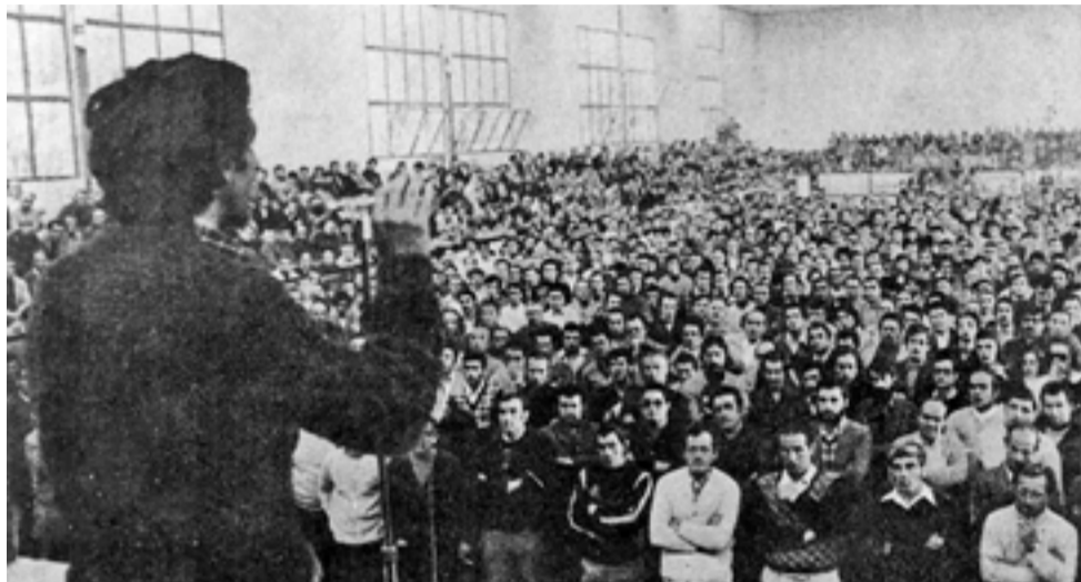
Assemblea celebrada per la plantilla de Roca durant la vaga

El 1976 no fou un any qualsevol: en un país que sempre ha avançat a cop de vagues, aquell any, es van registrar els nivells més alts de conflictivitat obrera. 40.175 conflictes oberts i gairebé tres milions de vaguistes arreu de l'Estat. Es venia de la vaga general de Sabadell, dels assassinats del 3 de març a Vitòria, de les manifestacions per l'amnistia i d'un nou model d'implicació sindical –lluny del verticalisme del règim, lluny de les noves jerarquitzacions polítiques que s'anunciaven– de base assembleària, gens delegatiu i amb una demanda