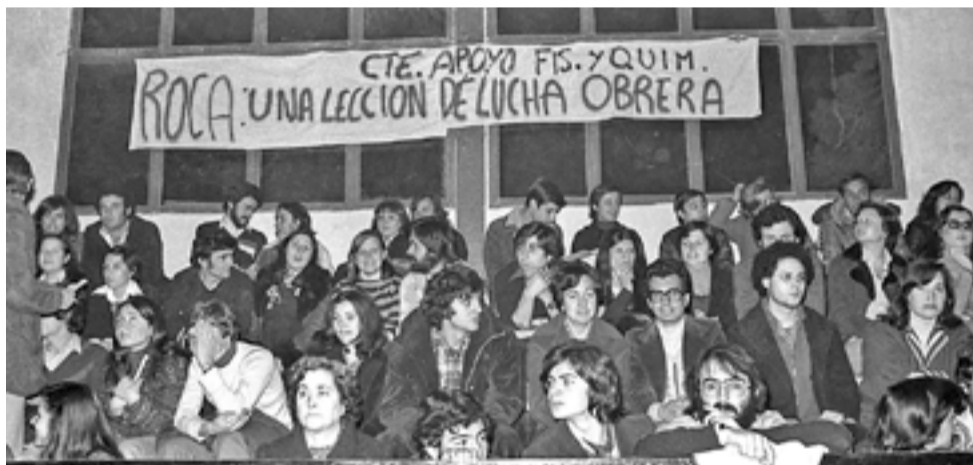
Concert de solidaritat amb la vaga ofert per Lluís Llach el 1977 a Viladecans

poc economicista i d'arrel antirepressiva, política i democratitzadora: readmissió dels acomiadats i reconeixement del nou funcionament assembleari. Una vaga, doncs, contra el poder empresarial de Roca Radiadores, que en aquell temps era la segona empresa del país després de la SEAT. Aleshores tenia 4.700 treballadores. Avui, a penes 500.