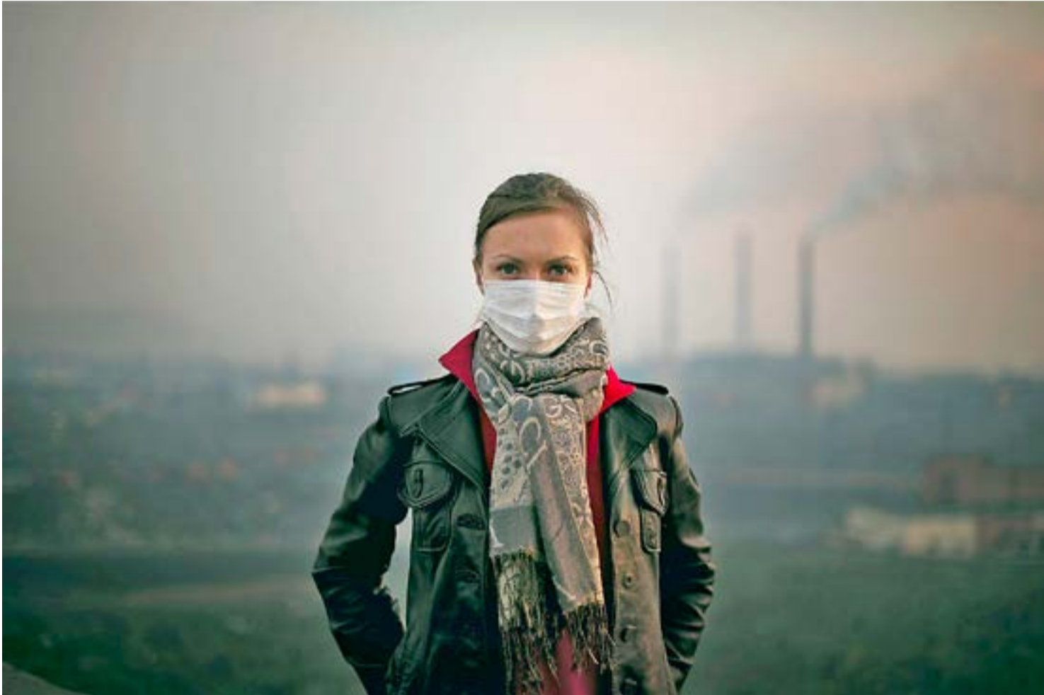
Substàncies tòxiques cancerígenes afecten les treballadores que hi estan exposades