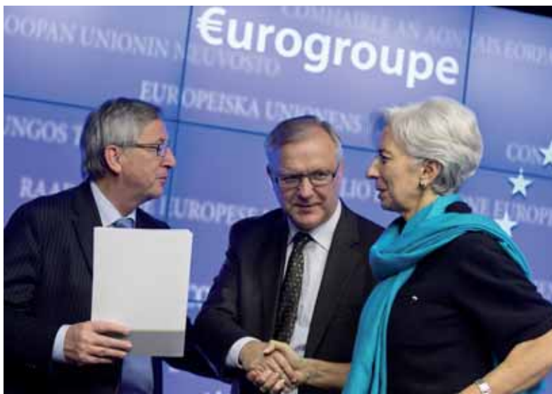
Jean-Claude Juncker, primer ministre i ministre d'Economia de Luxemburg, Ollie Rehn, vice president de la CE, i Christine Lagarde, directora gerent de l'FMI, durant una reunió de l'Ecofin el 5 març de 2013

L'alcalde Xavier Trias assistirà a Davos per promocionar la 'marca Barcelona'.