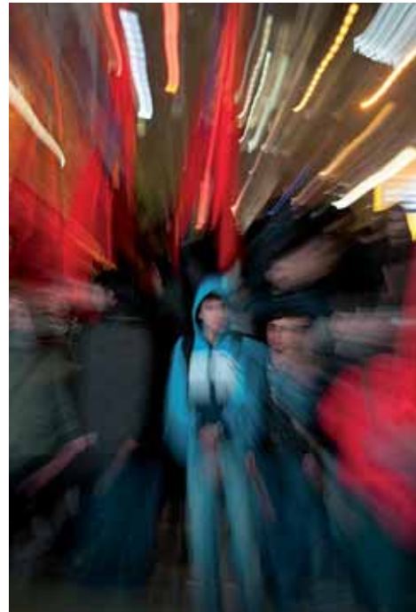
Manifestació contra la proposta de llei que pretén controlar els continguts a la xarxa el 18 de gener a Istanbul