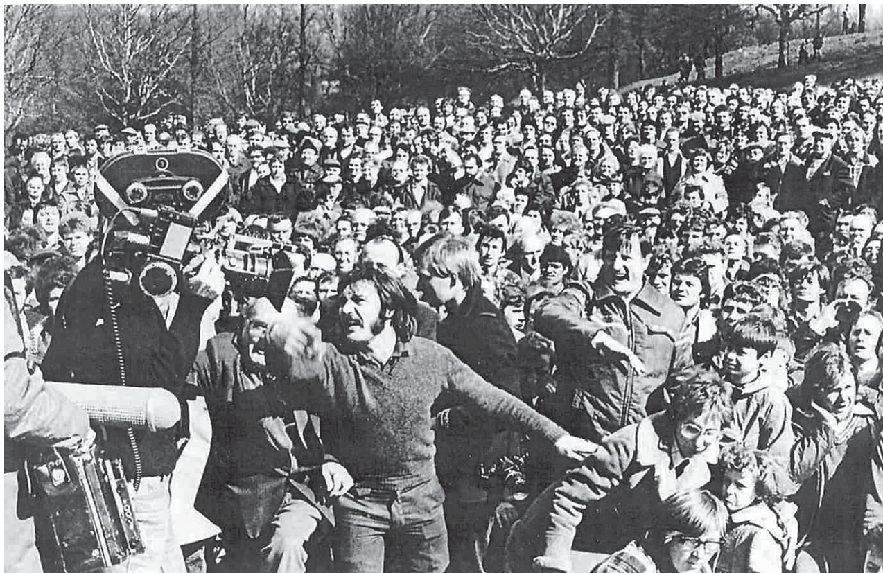
El context econòmic dels anys setanta havia estroncat les tres dècades de creixement i prosperitat de postguerra

ruïna econòmica i material d'Europa ni podia fer oblidar que bona part del conflicte estava motivat per l'ensulsiada del model capitalista liberal, responsable de la llarga depressió de la dècada de 1930. Així, els britànics van decidir prescindir del món vell i aristocràtic representat per Winston Churchill i van establir allò que els historiadors hem anomenat consensus keynesià o socialdemòcrata, amb la reducció de les desigualtats socials i la intervenció de l'Estat com a regulador de l'economia. El context de guerra freda, amb l'amenaça (per a molts, esperança) comunista, també resultava ser un estímul per proveir de serveis públics gratuïts (especialment sanitat i educació), sistemes de pensions públiques, habitatges de lloguer municipal assequibles i increments salarials notables, amb lleis i regulacions que atorgaven un poder considerable als sindicats.