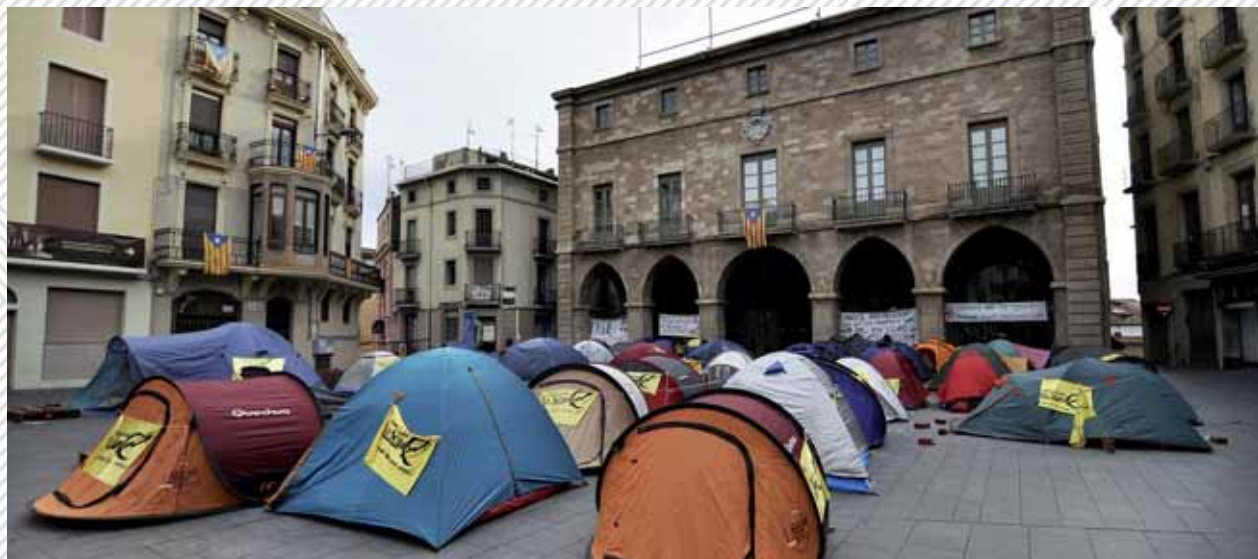
Acampada contra el desallotjament de l'Ateneu La Sèquia de Manresa

L'edifici de l'Ateneu La Sèquia, a Manresa, havia estat una escola i una residència per a la gent gran durant les últimes dècades. Quan va ser okupat, feia vuit anys que estava abandonat. L'immoble és propietat de la congregació religiosa Hijas de San José, que té la seu central a Madrid i que va presentar una denúncia contra les okupants. La gent de l'Ateneu es va posar en contacte amb la congregació per intentar obrir un procés de mediació i trobar una solució no judicial a la situació, cosa que les