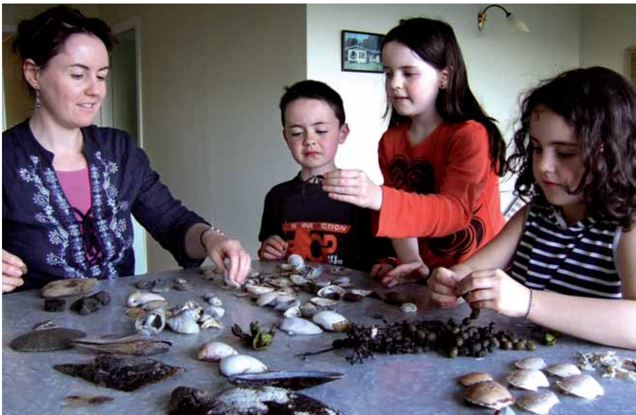
L'educació a casa significa "assumir de manera integral l'educació dels fills amb la possibilitat de contactar amb especialistes per ampliar l'educació" - Bournagain

ritme, motivada per la pròpia curiositat i en un entorn familiar. L'educació a casa és una opció reconeguda legalment a molts països europeus, però, a l'Estat espanyol, existeix un buit legal i una manca de reconeixement social que afecta les famílies que practiquen aquest tipus d'educació.