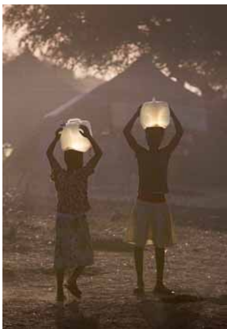
Al poble ugandès d'Elegu, ja s'han registrat més de 25.000 refugiades sud-sudaneses que demanen asil

Mentre l'Autoritat Intergovernamental sobre el Desenvolupament de l'Àfrica Oriental (IGAD), una organització supranacional, condueix les negociacions de pau entre Kiir i Machar a la capital etiop d'Addis Abeba, centenars de milers de sud-sudanesos creuen les poroses fronteres que separen el Sudan del Sud d'Uganda i cerquen refugi i asil en algun dels centres de recepció de refugiades improvisats a Arua, Adjumani, Kyandongo, Elegu o Terego. A Elegu, ja s'han registrat més de 25.000 refugiades que demanen asil al país, un centre que rep diàriament prop de mil persones desplaçades pel conflicte. Mentre les agències de les Nacions Unides, els governs implicats i la comunitat internacional diuen que estan buscant solucions al conflicte, el degoteig de refugiades augmenta diàriament.