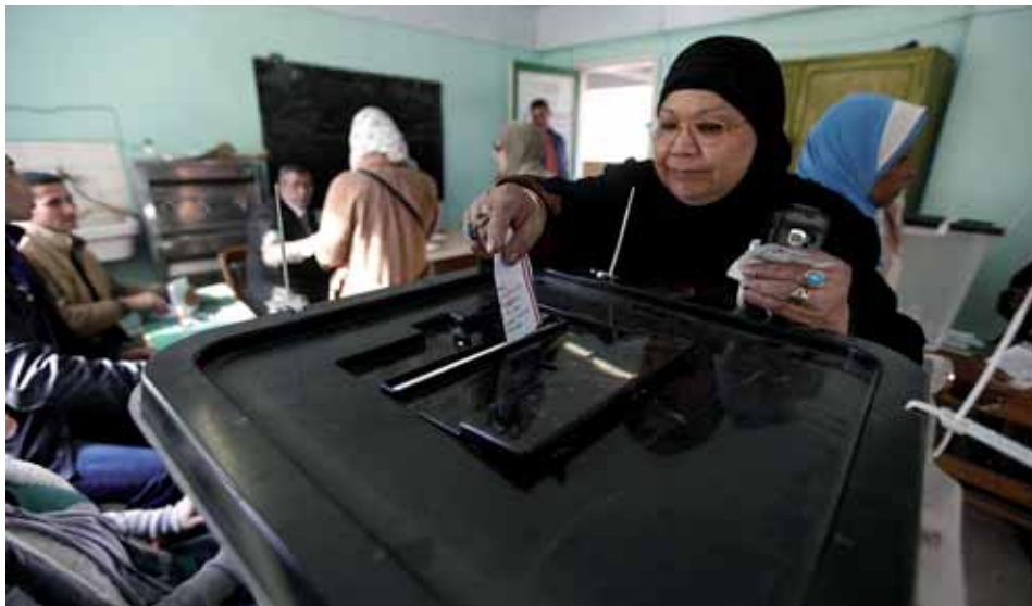
Una dona emet el seu vot durant el referèndum sobre la nova Constitució al Caire el 14 de gener de 2014

El setembre de 1981, Anwar el-Sadat va convocar un referèndum per donar llum verda a l'arrest de l'oposició interna, islamista i d'esquerra, especialment enfadada arran dels acords de Camp David signats tres anys abans amb l'Estat d'Israel. Segons les dades oficials, llavors, un 98,2% de les votacions van donar suport al govern, tot i que es registraven enfrontaments molt