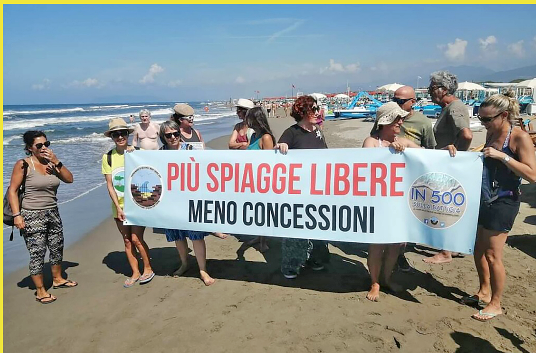
La primera acció del moviment a les platges d'Òstia (Roma)

Durant vint anys les coses italianes van funcionar d'aquesta manera, fins que es va aprovar la directiva europea número 123, coneguda com a "directiva Bolkestein", l'any 2006. Per promoure la competència, el lliure comerç i una major integració del seu mercat interior, la norma establí que els països membres de la UE gestionessin la cessió de la gestió de serveis públics per part de particulars mitjançant licitacions obertes a tots els operadors europeus. Brussel·les establí també