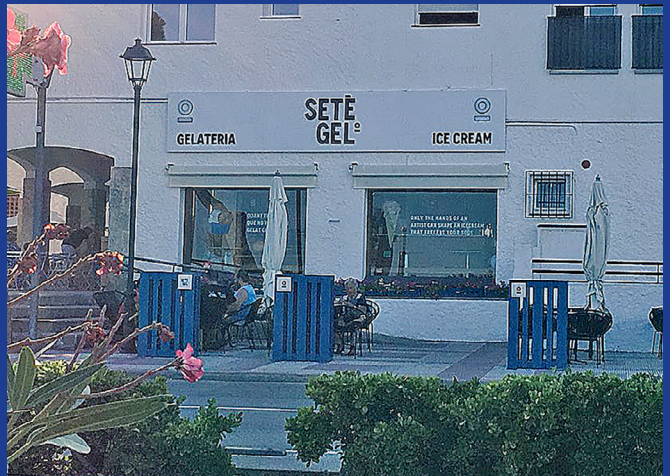
/ LAURA AGUSTI

← Disculpats els perdons! Sovint ens passem amb l'ultracorrecció.