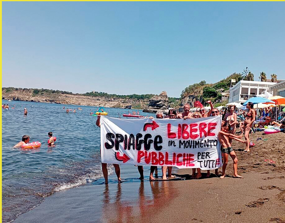
Una acció de protesta a la platja de Pozzuoli, a la rodalia de Nàpols

Però les concessions van començar a adoptar un rol més oligàrquic a partir de l'any 1992,