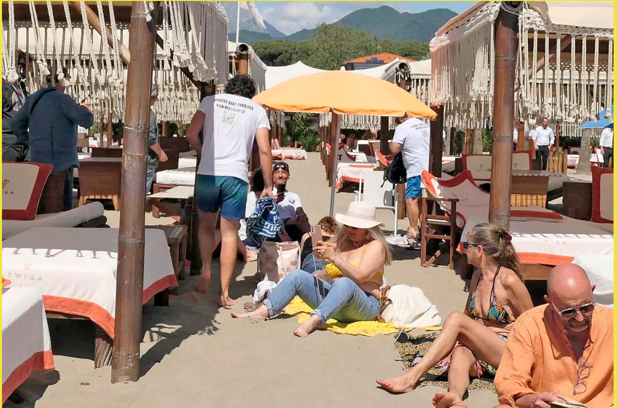
Ocupació de la zona de pagament de la platja de Marina de Petrasanta

F inca que el sol és una font d'energia gratuïta, poder-ne gaudir en algunes ocasions pot sortir car. Per exemple, a bona part de les costes italianes. Un exemple: si algú vol estirar-se sota els seus raigs a l'hectàrea de platja de Marina de Pietrasanta (a la regió de la Toscana) haurà de llogar un mínim de dues gandules d'alta gamma i una tenda para-sol. I pagar 600 euros al dia. Aquesta és la tarifa del Twigga, un beach club exclusiu on molta