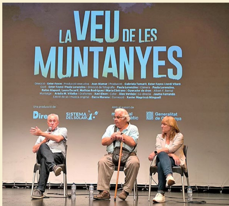
'La veu de les muntanyes' (2024) ha protagonitzat una gira d'èxit en nombre de projeccions i assistents, especialment per pobles i ciutats del País Valencià