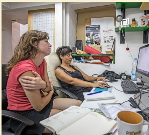
Vuit anys llargs a la seu del carrer de Riego, a Sants (Barcelona), van donar per molt. Aquí fou on va néixer la cooperativa La Directa, l'any 2016.