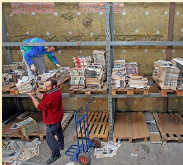
Els exemplars emmagatzemats arriben a l'antiga nau industrial de l'Hospitalet de Llobregat que va acollir la redacció durant els primers anys.