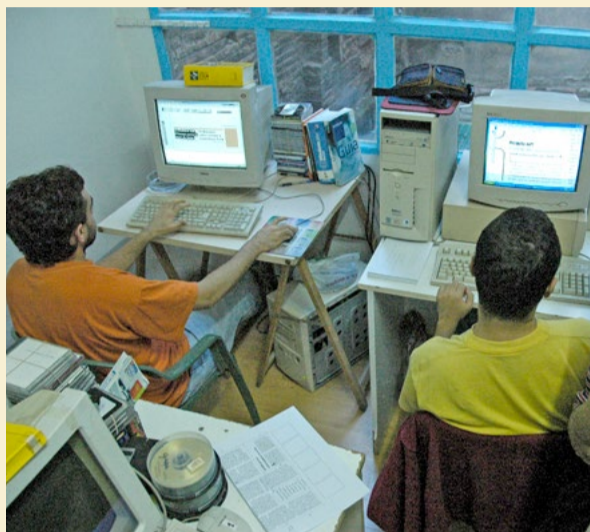
Preparant els primers números de la 'Directa' a l'Espai Obert de Sants (Barcelona).