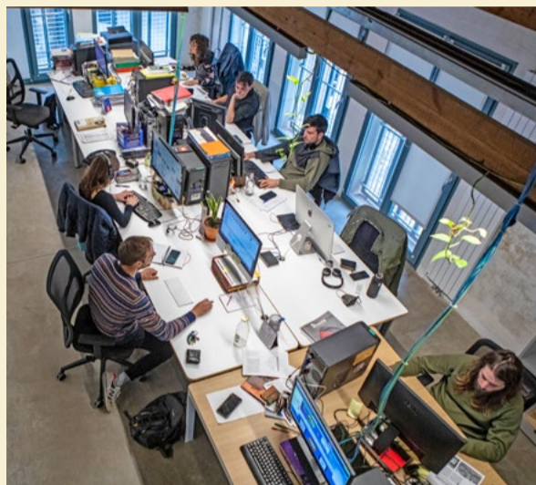
L'actual redacció a l'espai La Comunal, també a Sants, on vam fer cap a finals de l'any 2019.