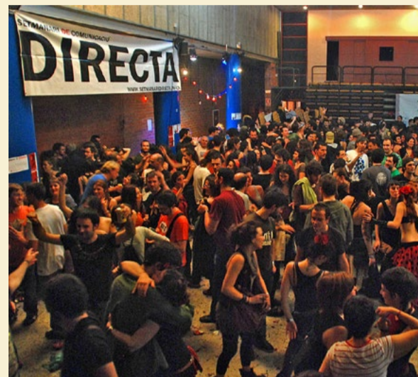
Festa del cinquè aniversari a l'Ateneu Popular Nou Barris.

La redacció d'un mitjà de comunicació és un espai de convivència: moltes hores, ritmes de tancament frenètic i nits sense dormir. En els seus vint anys d'existència, la Directa ha passat per diverses ubicacions, cadascuna amb els seus encants particulars, però sempre amb la vocació de ser aules de formació en periodisme que incomodi els poders.