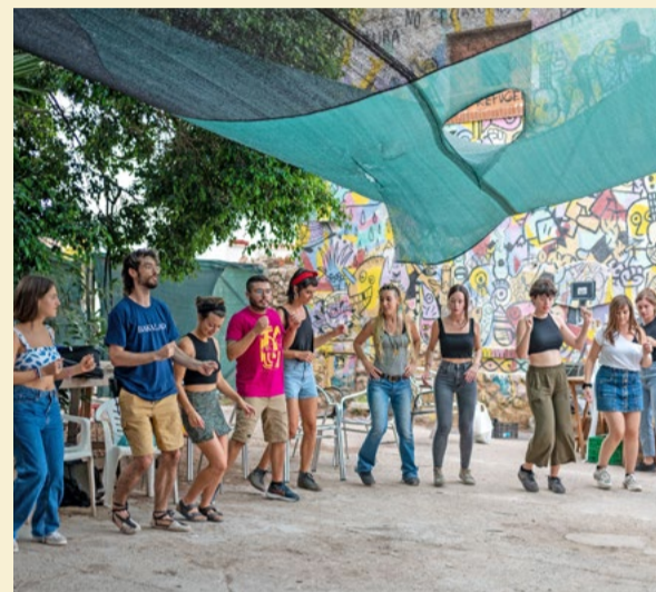
Festa del nucli del País Valencià, l'any 2022 al CSOA L'Horta.

Quan l'Espai Obert va completar el trasllat -víctima d'un procés d'especulació immobiliària al cor de l'avinguda del Paral·lel-, reubicant-se a un edifici industrial del carrer de Violant d'Hongria, a Sants, hi vam tornar. Allà vam construir l'esquelet del futur mitjà de comunicació, amb reunions maratonianes cada dissabte, per dissenyar la maqueta, l'estructura i la governança. En aquest segon Espai Obert hi vam gestar els dos números promocionals, el 0, de l'octubre de 2005, i el 00, del gener de 2006.