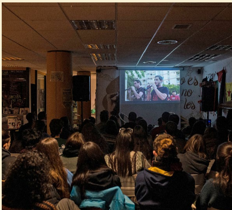
En molts llocs dels Països Catalans es va aplegar gent per veure l'emissió al '30 Minuts' de TV3 del reportatge 'Infiltrats', el gener de 2025. A la foto, a l'Ateneu Salvadorà Catà de Girona. CARLES PALACIO