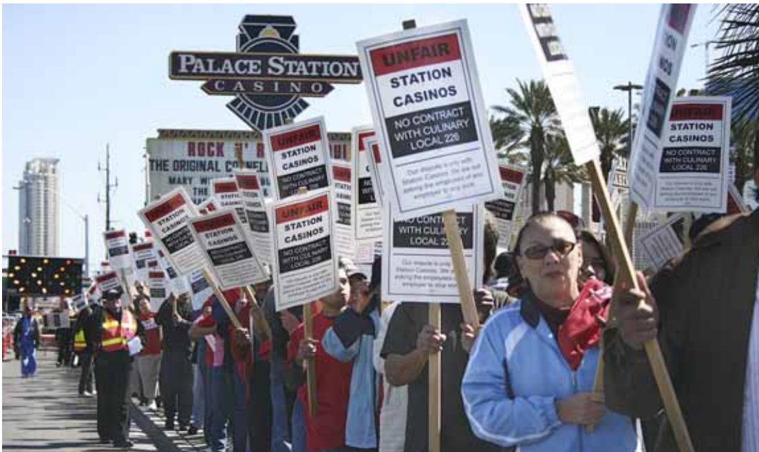
Station Casinos va acomiadar 2.800 treballadors entre 2008 i 2010 // Iban Ek