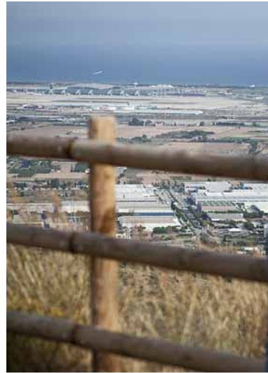
Las Vegas Sands es

Sota el delta hi ha dos aqüífers de vital importància. No només per nodrir els espais naturals (zones d'aiguamolls i altres, depenent de l'emanació de l'aqüífer més superficial), o l'agricultura (en les zones més costaneres, les pagues expliquen que no cal regar les síndries), sinó que és una reserva d'aigua dolça estratègica per a Catalunya. D'aquesta font veuen els barcelonins i barcelonines quan hi ha sequera. Si no hi ha restriccions al consum durant aquests períodes és gràcies a les aigües subterrànies. L'aqüífer abasta tot el municipi del Prat de Llobregat i, de forma parcial, altres deu municipis de la costa central, de Sitges a Barcelona. Les habitants del Prat reconeixen la qualitat d'aquesta aigua i el baix preu. Per aquests motius, l'aqüífer del Delta del Llobregat es troba protegit pel Decret 528/1988, on s'especifica la protecció vers les extraccions d'àrids o "qualsevol altra activitat que pugui ser causa de degradació o deteriorament del domini públic hidràulic".